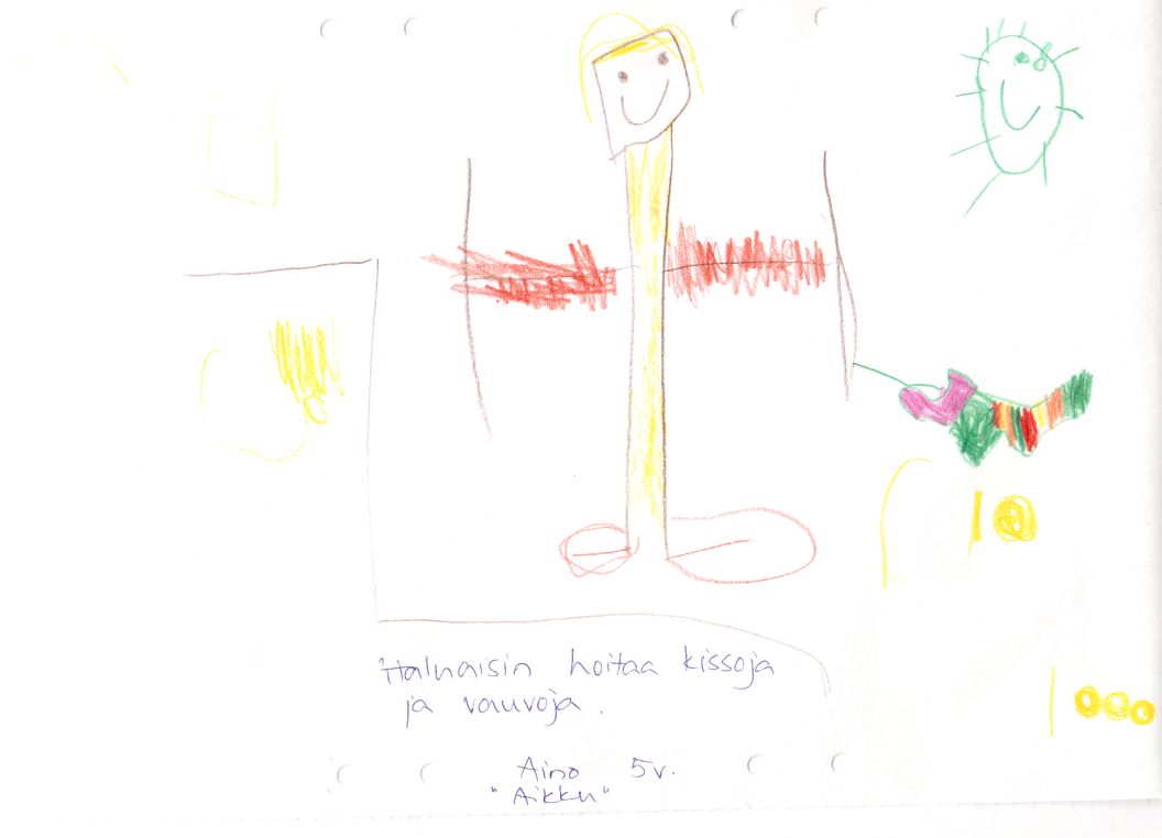
Kuvio 3. "Haluaisin hoitaa kissoja ja vauvoja." - Aino 5 vuotta