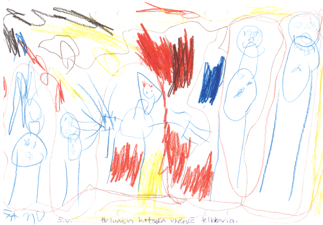
Kuvio 4. "Haluaisin katsella yhdessä telkkaria" –Samu 5 vuotta.