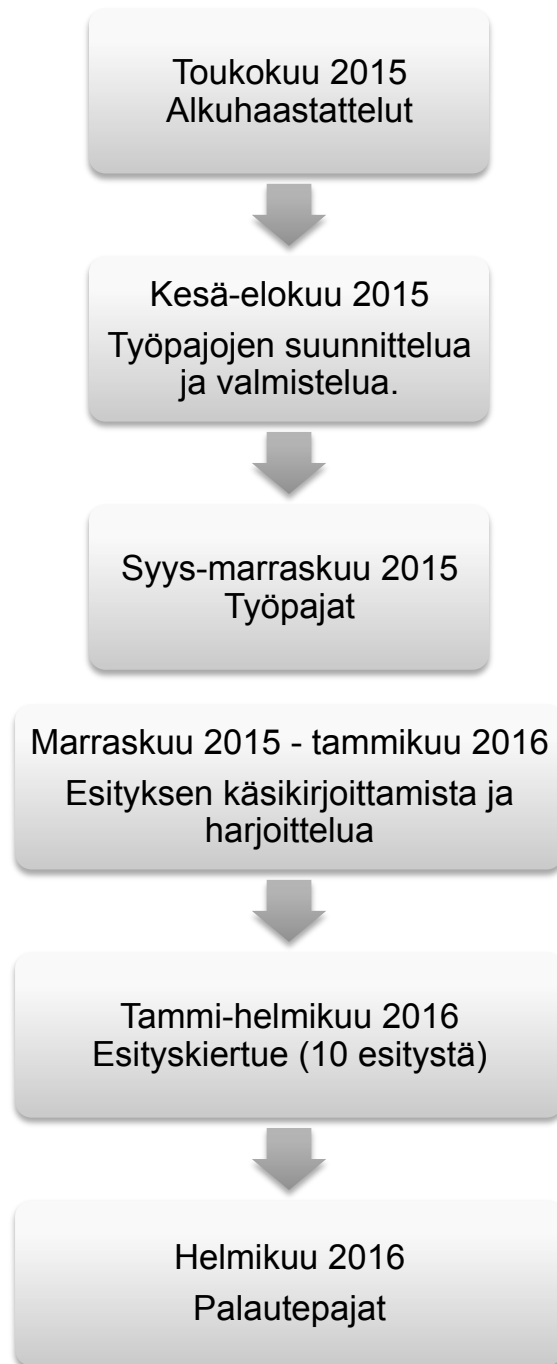
Kuvio 1. Yhdessä kerrottua -projektin kulku