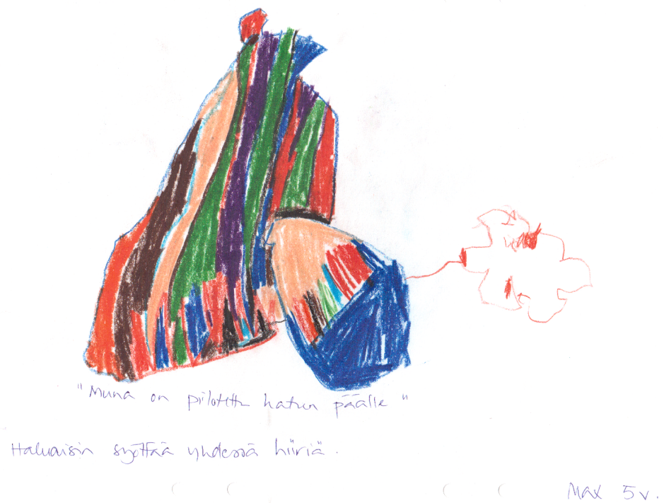
Kuvio 2. "Muna on piilotettu hatun päälle. Haluaisin syöttää yhdessä hiiriä." –Max 5 vuotta