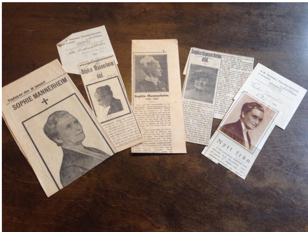
Kuvio 4. Sophie Mannerheimin kuolinilmoituksia sanomalehdissä. (Epäilyt ja Hannu 2015.)