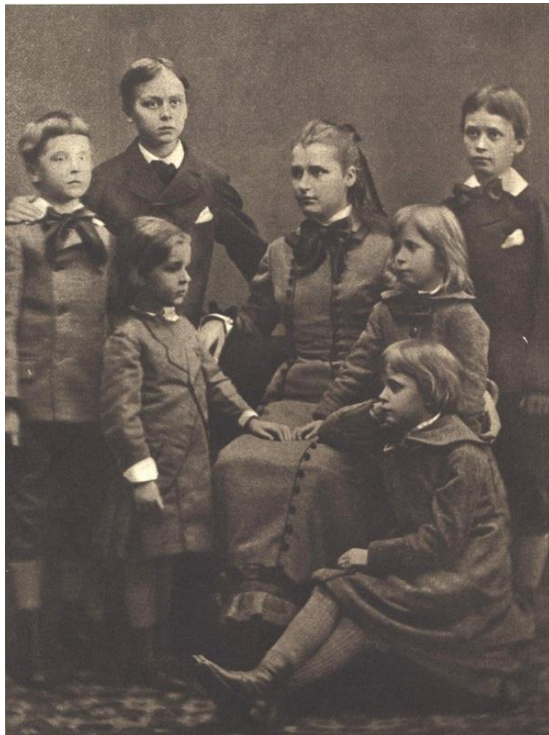
Kuvio 2. Sophie Mannerheim nuorempien sisarustensa keskellä.