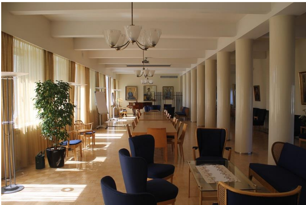
Kuvio 10. Sophie Mannerheim -sali Metropolian Tukholmankadun toimipisteessä.

Sophie Mannerheimin jäämistöä hoitotyön näkökulmasta voi löytää tänä päivänä Metropolian Tukholmankadun toimipisteessä sijaitsevasta Hoitotyön koulutuksen museosta. Museossa on muun muassa hänen ylihoitajattaren pukunsa, hänen kirjoittamiaan kirjoja sekä valokuvia. Hoitotyön koulutuksen museosta löytyy myös paljon muuta S. Mannerheimin ajan hoitotyöhön liittyvää esineistöä sekä kirjallisuutta. Tukholmankadun toimipisteessä sijaitsee myös Sophie Mannerheim -sali (kuvio 10).