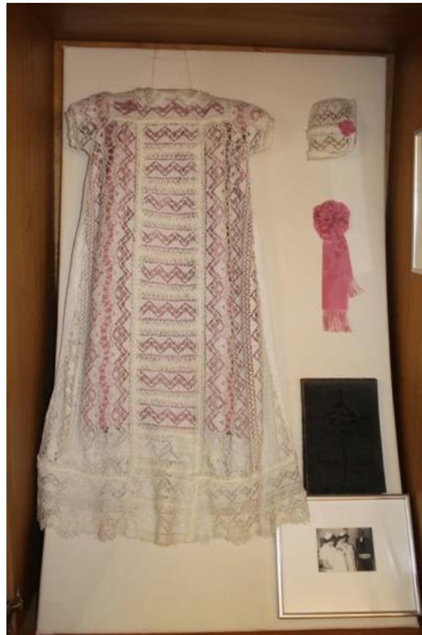
Kuvio 11. Alkuperäinen Mannerheim-suvun kastemekko, jonka suku on lahjoittanut Lastenlinnan museolle. (Epäily ja Hannu 2015.)