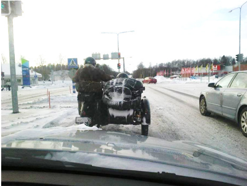
KUVA 1. Moottoripyöräilyä Suomen talvessa (Aho 2015, 15)

Alla on esimerkki siitä, miten kuva liitetään opinnäytetyöhön (KUVA 1).