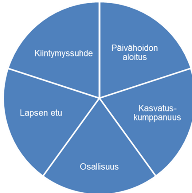
KUVIO 1. Kehittämishankkeen keskeiset avainsanat

ollut valmiit vastausvaihtoehdot, olisivat rajanneet vanhempien vastauksia liikaa. Kysymysten analysoinnin suunnittelimme tekevämme teemoittelulla.