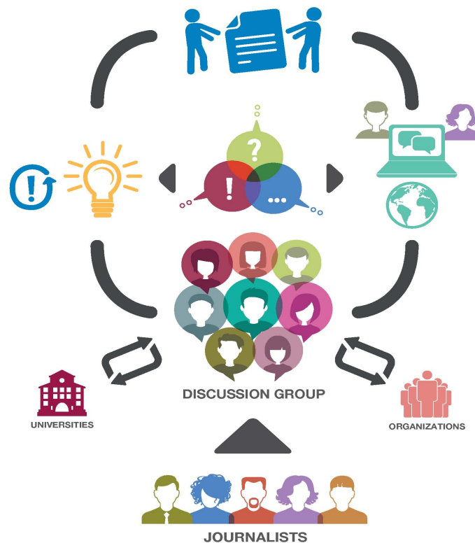
Kuvio 1. Ryhmäjournalismiin ja Kuudes kulma -verkkolehden idea Pekka Mänistön kuvaamana.

Ryhmäjournalismissa toteutetaan sekä yhteisö- että kansalaisjournalismia.