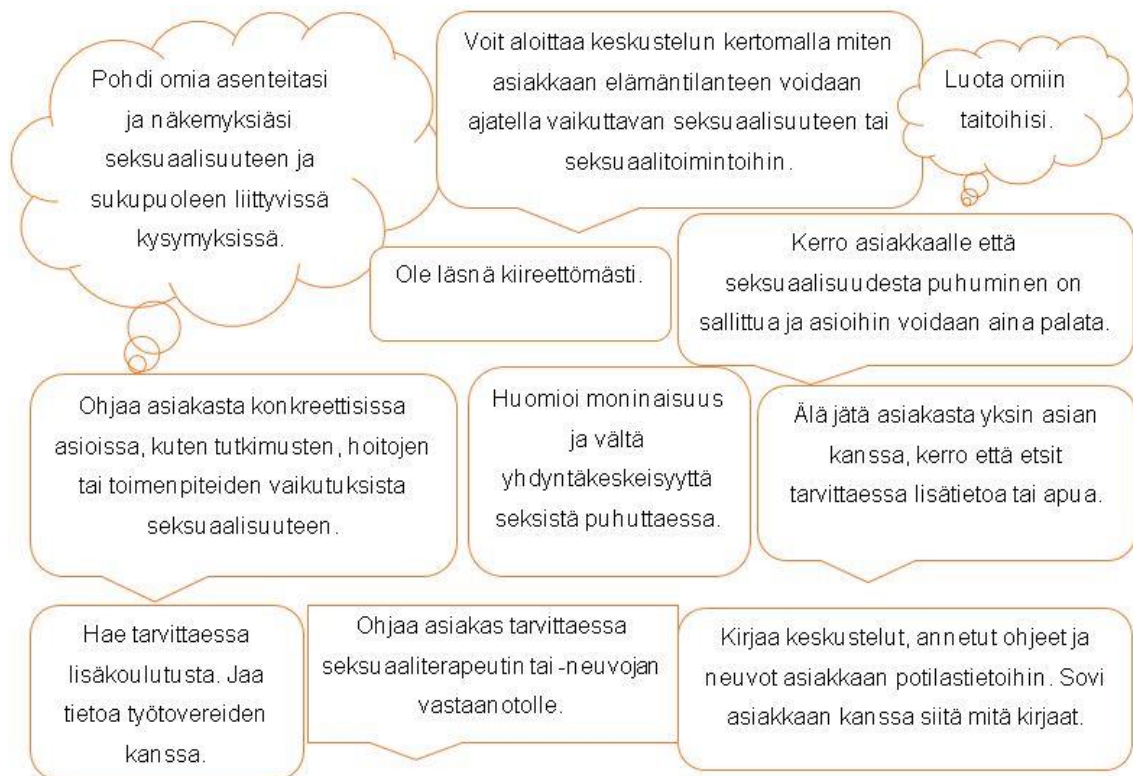
Kuvio 1. Käytännön ohjeita seksuaalisuudesta puhumiseen

Ammattimaisessa kohtaamisessa on tärkeää tiedostaa, että ammattilaisen omat kokemukset, ennakkoluulot, asenteet, pelot, moraalikäsitelmät ja tunteet sekä perusasenne elämään, itseensä ja asiakkaisiin sekä heidän tilanteeseensa heijastuvat asiakastilanteen vuorovaikutukseen. Seksuaalisuuden puheeksi ottaminen haastaa ammattilaisen määrittelemään myös omaa seksuaalisuuttaan ja sukupuolisuuttaan. Laadukkaan seksuaaliterapeutin tuottamiseksi ammattilaisten omien asenteiden ja arvojen pohtiminen, kouluttaminen ja työnohjaus ovat tärkeitä. (Vilka 2010, 86; Rynänen 2011, 65; Bildjuschkin 2015.)