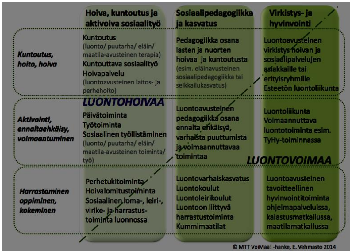
Kuvio 2. Green Caren vihreä hoiva (luontohoiva) ja vihreä voima (luontovoima). Green Care -työkirja, 8.

Vihreä voima (luontovoima) on osa Green Care -toimintaa, joka koostuen ennaltaehkäisevästä ja terveyttä tukevista hyvinvointipalveluista. Vihreä voima ja siihen kuuluvat virkistys- ja harrastustoiminta, työhyvinvointipalvelut, muut hyvinvointipalvelut sekä ohjelmalvelut, voivat tukea myös kasvatus- ja opetustyötä. Vihreä voimaan kuuluvia Green Care -toimintoja ja palveluja voivat tuottaa monet erilaiset tahot, sillä palvelujen tuottajilla ei ole sosiaali- tai terveysalan koulutusvaatimuksia kuten Vihreä hoiva -palveluilla. Asiakkaat ovat usein yksityisiä ja he voivat itse päättää millaista palvelua ostavat. Vihreä voima -palvelut tuottavat esimerkiksi erilaisia virkistäviä luontoretkiä, maatilavierailuja ja erilaisiin eläimiin tutustumista sekä luonnossa liikkumista. Toiminnan tarkoituksena on lisätä hyvinvointia ja edistää toimintakyvyn ylläpitämistä sekä tarjota elämyksiä luonnon avustuksella (Green Care -työkirja, 7. Viitattu 7.11.2015, Koukkunen, M. 2014, 11).