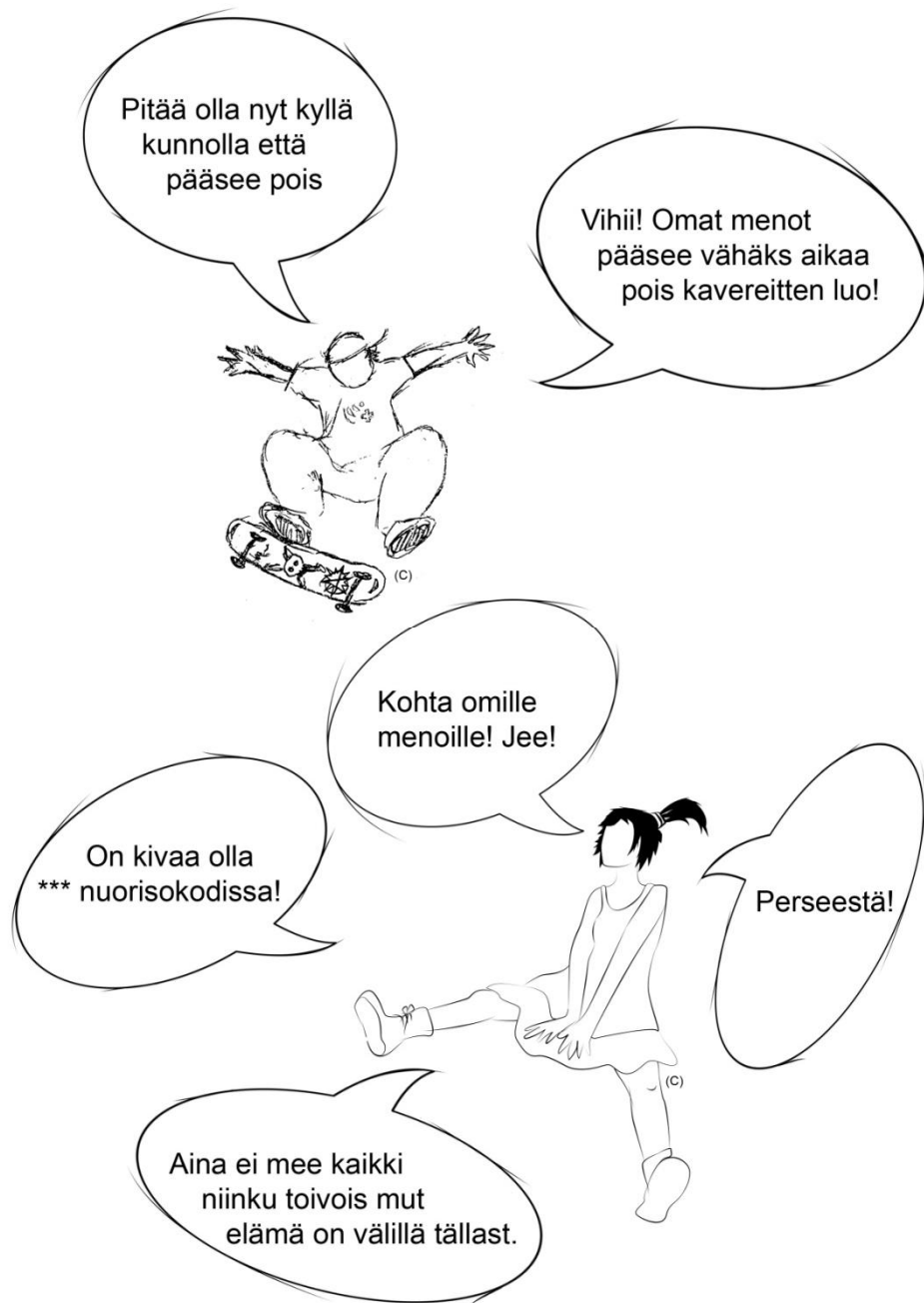
KUVIO 2. Nuorten puhekuplatehtävän tulokset