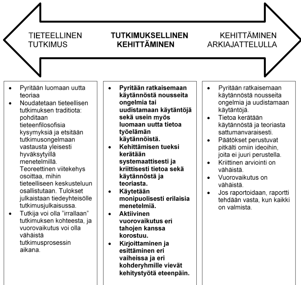
Kuvio 2. Tutkimuksellisen kehittämistoiminnan luonne (Ojasalo ym. 2009: 18).

Ojasalo, Moilanen ja Ritalahti (2009) toteavat kuitenkin, että edellä kuvattu jaottelu ei todellisuudessa ole joko-tai -asetelma, vaan kehittämistyö voi vaihtelevasti sisältää kaikenlaisia piirteitä tieteellisestä tutkimuksesta hyvinkin arkiseen ajatteluun.