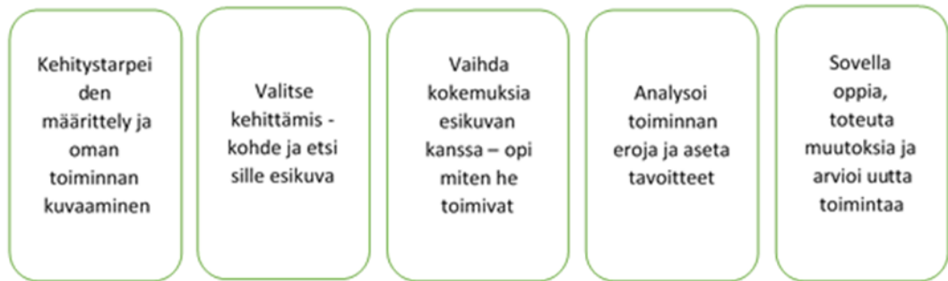
Kuvio 2. Benchmarking-prosessi (Vuorinen 2013, 160).