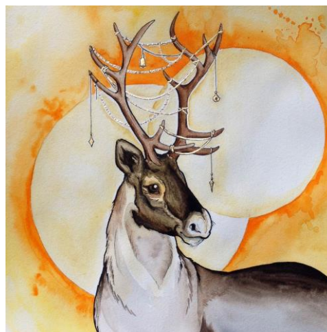
Kuva 4. Poro