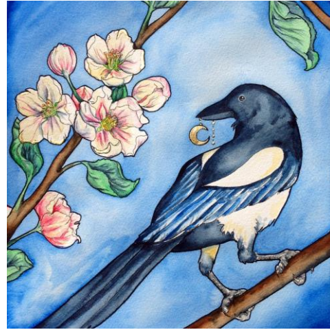
Kuva 10. Harakka