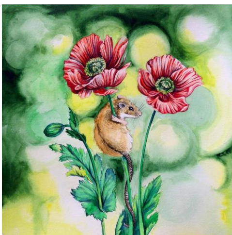
Kuva 11. Peltohiiri

Halusin korostaa suden pedon luonnetta ja maalasin sen suuhun kuolleen rusakon. Maalauksessa susi katsoo keltaisilla silmillään suoraan katsojaan, suussaan saalis. Sudet ovat laumaeläimiä, siispä kuvauksessakin korostuu yhteisöllisyys: ”Susi 20.1.–19.2. Terveen itsetunnon omaavat sudet ovat luontaista laumanjohtajatyyppejä. He ovat sosiaalisesti älykkäitä ja tarkkanäköisiä. Heillä on hyvä hierarkian taju, ja he osaavat kunnioittaa auktoriteetteja, jos se on perusteltua. Sudet pääsevät oikeuksiinsa ollessaan osa ryhmää ja harvoin heitä tapaakaan ilman seuraa.”