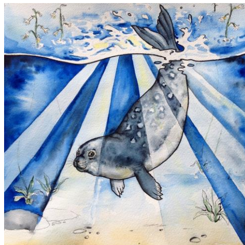
Kuva 6. Saimaannorppa