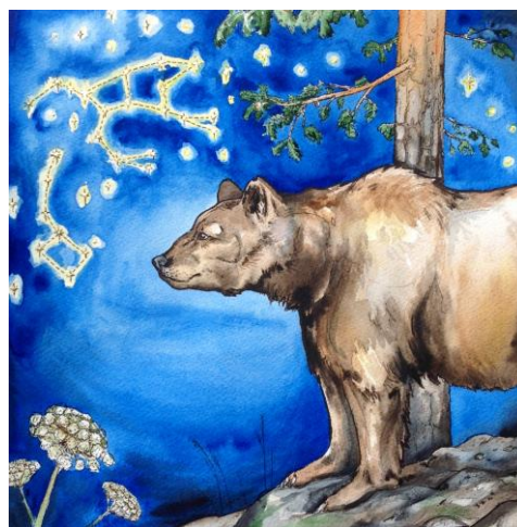
Kuva 8. Karhu