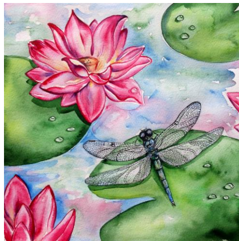
Kuva 2. Sudenkorento