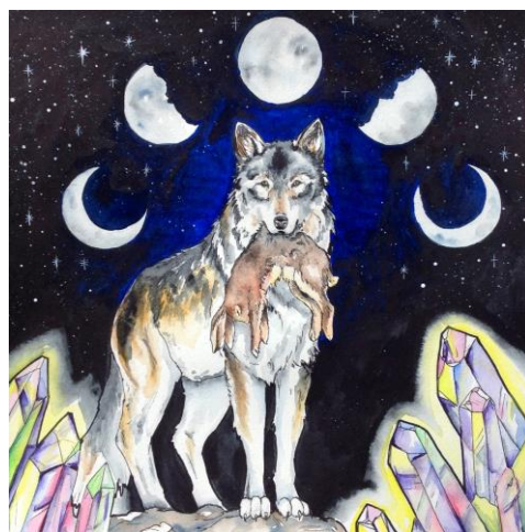
Kuva 12. Susi