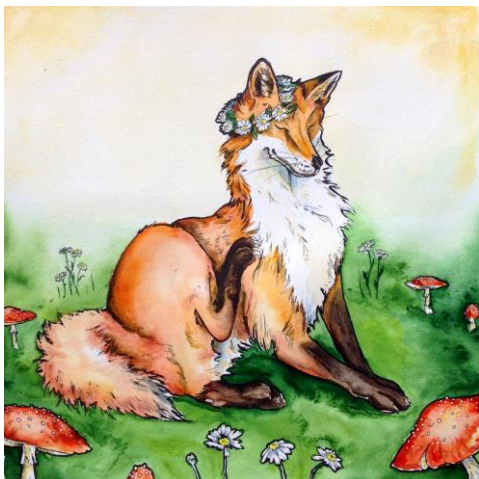
Kuva 5. Kettu