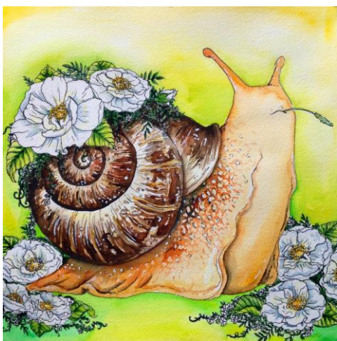
Kuva 7. Lehtokotilo

Mahtavan metsän kuninkaan luonnekuvaus kuuluu näin: ”Karhu 23.8.–22.9. Talven tullessa karhut toivovat, että koko muu maailma pysähtyisi pimeimmiksi kuukausiksi eikä vaatisi heiltä mitään. He toivovat, että voisivat vain nukkua kylläisinä koko kaamosajan. Metsän kuninkaina karhut ovat luonteeltaan itsetietoisia ja itsevarmoja. He kulkevat aina omaa tahtiaan, muista riippumatta.”