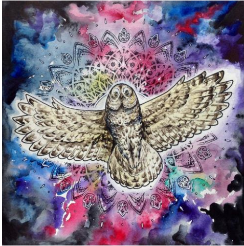
Kuva 9. Lapinpöllö