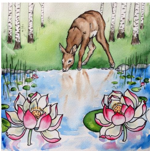
Kuva 3. Metsäkauris

Tein poron luonnekuvauksesta tällaisen: ”Poro 21.12.–19.1. Porot ovat tyypillisiä sarvipäitä, jääräpäisiä äärimmäisyyksiin asti. Heillä on suuri tarve määrätä itse omista asioistaan. Toisaalta he ovat valmiita tekemään paljon töitä niiden hyväksi, joista välittävät. Porot toimivat harkiten, hitaasti ja varmalta pohjalta.” Kauan Lapissa asunut ystävä kuvaili porojen luonnetta hyvin värikkäästi ja korosti tarinoissaan juuri jääräpäisyyttä.