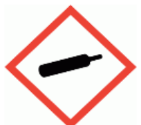
Paineen alaiset kaasut