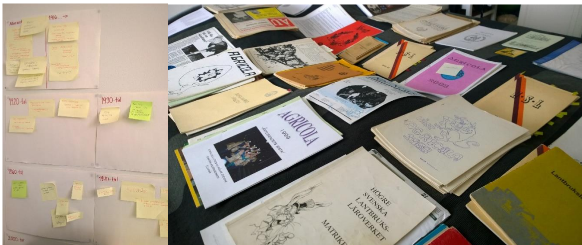
Bild 2: Visualisering av hur materialet strukturerats. Till vänster post-it lappar collage och till höger grovsortering v material.

För att skapa en helhetsbild över elevkårens 100 åriga historia började skribenten arbetsprocessen med att skapa en så kallad "mind map" på sovrumsväggen. Dessutom har en 1.60 meter bred säng fått fungera som arbetsytta för elevkårens alla bevarade skriftliga dokument. För visualisering av arbetsprocessen, se bild 2.