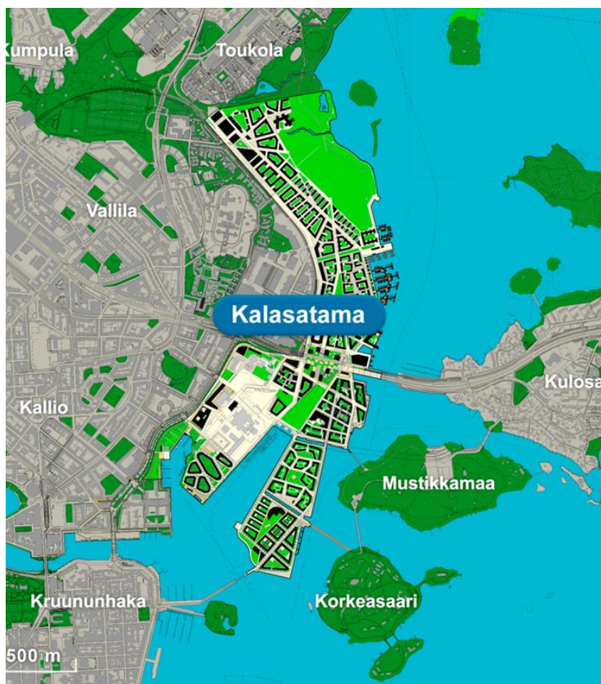
Kuva 1. Kalasatama ja lähialueet. Kalasataman alueet ja kartat, 2016.

Kuvassa 1 näkyy Kalasataman suunnitellut uudet asuin korttelit merkittynä mustalla. Kalasatama sijoittuu Kulosaaren ja Sörnäisen väliin itäisessä kantakaupungissa, josta jälkimmäisen alue on merkittynä kartalla Kallion alueeksi.