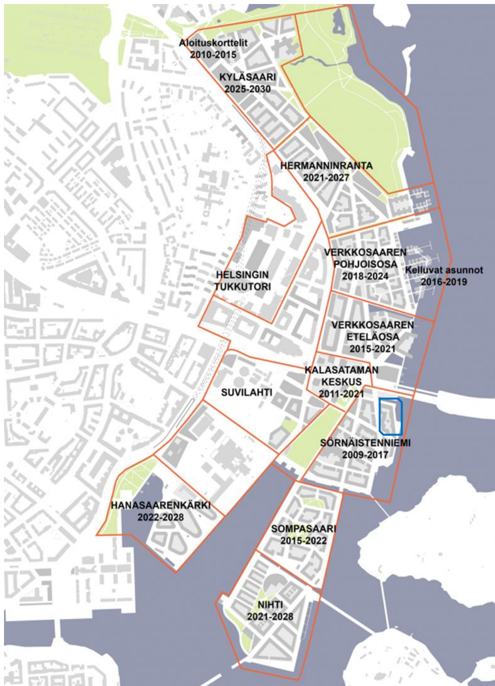
Kuva 2. Kalasataman uusi asuinalue. Kalasataman rakentaminen, 2013.

seksi alueen puuttuvasta joukkoliikenteestä. Alueelle on suunniteltu liike- ja palvelukeskusta, mutta rakennusvaiheeseen suunnitelma pääsee vasta vuonna 2018. (Perustietoa, 2016.)