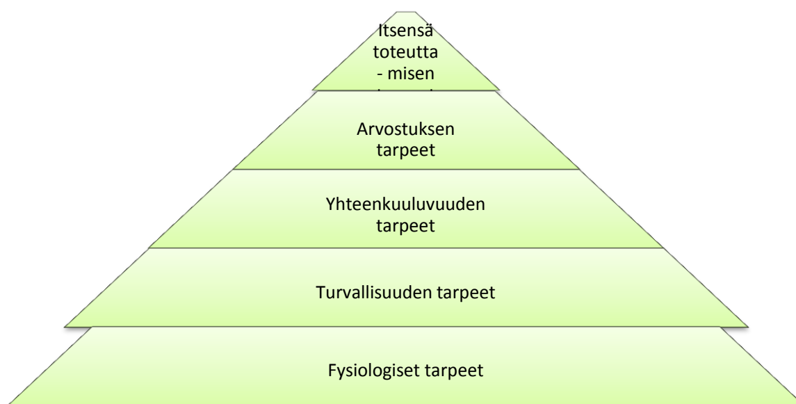
Kuvio 2. Maslow'n tarvehierarkia

Maslowin (1943) mukaan turvallisuuden tunne kuuluu yhtenä viidestä ihmisen perustarpeisiin. Maslow'n pyramidi-malli (Kuvio 2) on yleinen käsitys teoriasta, vaikka sitä ei ole alkuperäisessä teoksessa kuvioon laitettu.