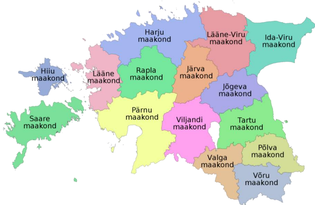
Kuva 3. Viron maakonnad.