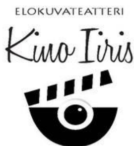
KUVA 1. Kino Iiriksän yritystunnus. (Lahti Region Oy 2016.)

Kino Iiriksessä työskentelee tällä hetkellä kaksi elokuvasihteriä sekä puolitoista konemiestä (yksi kokoaikainen ja yksi osa-aikainen). Lisäksi toimintaan osallistuu myös vapaaehtoisia esimerkiksi lipunmyynnin muodossa. (Kalliorinne ym. 2016.)