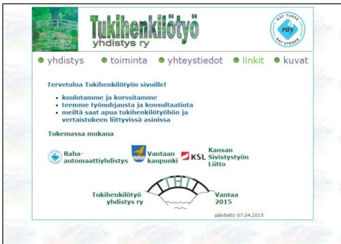
Kuva 1: Ruutukaappaus alkuperäisestä etusivusta

Yhdistyksen viestinnän kohderyhmiin kuuluvat ainakin heidän palveluidensa asiakkaat (päihdekuntoutujat), yhteistyökumppanit, rahoittajat, oma henkilöstö ja tiedotusvälineet. Vaikka yhdistys on pieni, internet tarjoaa hyvän mahdollisuuden saada näkyvyyttä sen toiminnalle kohtuullisen vaivattomasti.