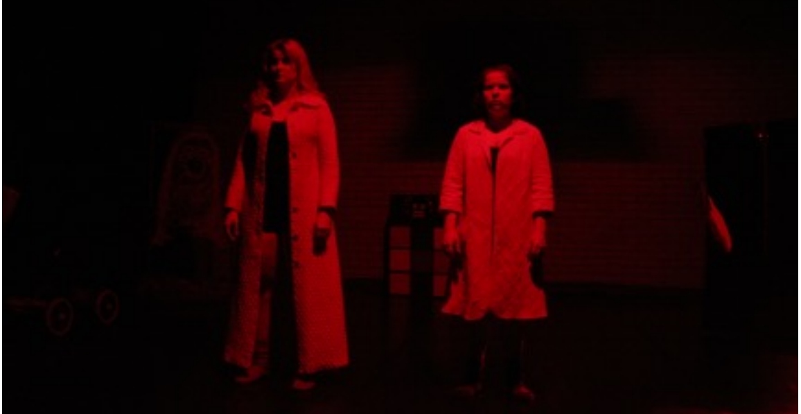
KUVA 9. Äidit.

Epilogi on juoneen liittymätön kohtaaminen, jossa kerrotaan esimerkiksi päähenkilöiden elämästä varsinaisten tapahtumien jälkeen. Niinpä vielä lopuksi kerron omia pohdintojani prosessista. Mitä olen oppinut? Mitä jäin pohtimaan?