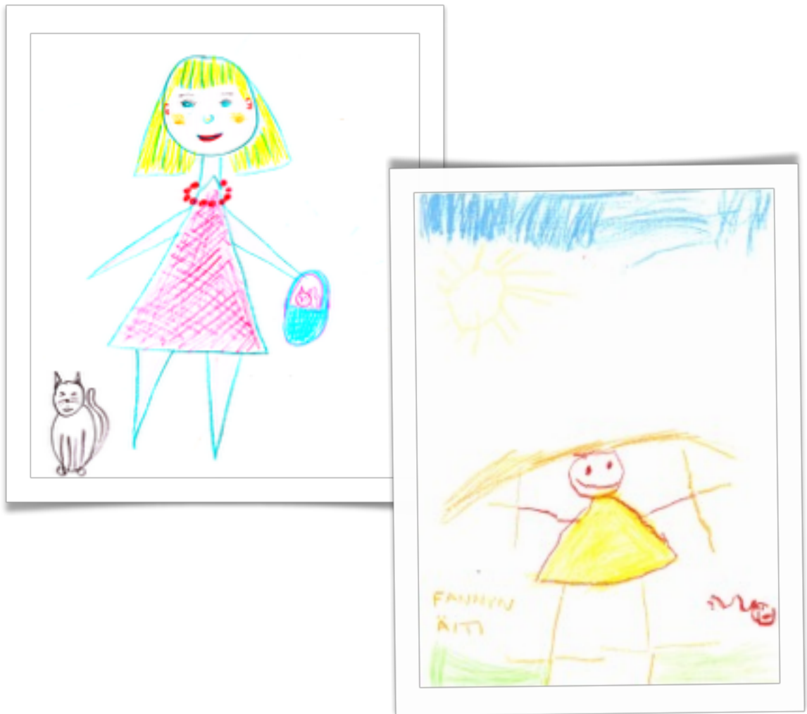
KUVA 2. Päiväkotiryhmän kollektiivinen kuvaus äidistä vasemmalla ja lapsen piirtämä kuva äidistä oikealla.

Marraskuussa 2014 teimme ryhmäni kanssa tunnetilaharjoituksia, joissa mietimme eri tunnetiloja: miltä ne näyttävät, tuntuvat ja kuulostavat. Näiden harjoitteiden jälkeen äänitimme vielä äänimateriaali, tunteiden äänistä. Lapset saivat myös kertoa ääninauhalle pohdintoja siitä, mitä rakkaus tai ilo on. Nauhoituksia käytettiin myös esityksen äänimateriaalina.