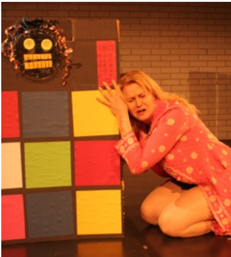
KUVA 8. Asiantuntija robotti ja äiti.

Vastaukset sai palauttaa esityksessä lavastuksenakin käytetyn ”asiantuntijarobotin” (KUVA 8) sisään.