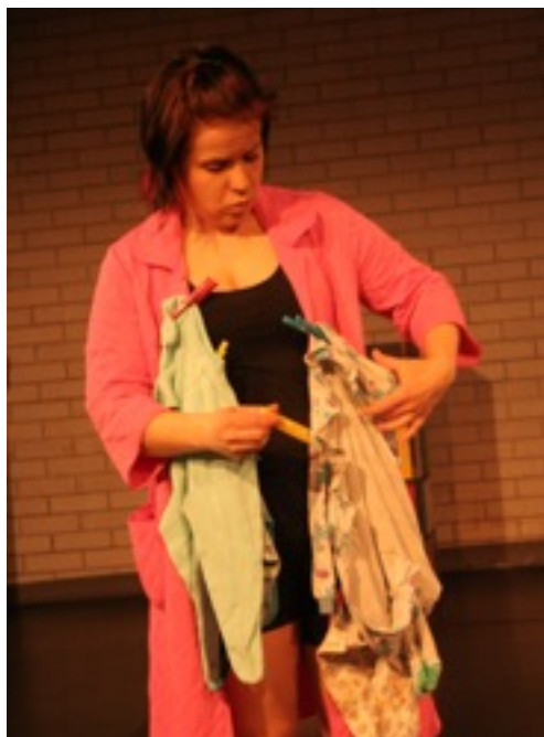
KUVA 6. Äiti ripustaa pyykkiä itseensä.

Pyykkihuoneimprovisaatiosta lopulliseen käsikirjoitukseen muokkautui useampikin kohta. Esimerkiksi näytelmän alkupuolella oleva monologi, jossa äiti ripustaa pyykkiä itseensä (KUVA 6) kertoen samaan aikaan siitä, kuinka yrittää nauttia ihan joka hetkestä, niinkuin ulkopuolisetkin koko ajan kehottavat.