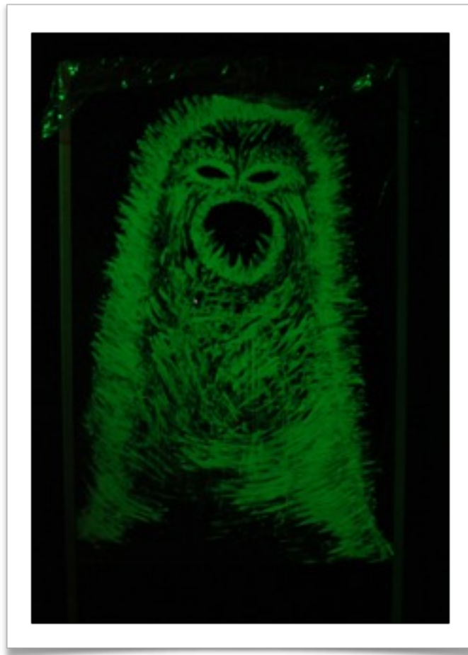
KUVA 4. Mörkö.

liittyy myös häpeä ja huono omatunto, joka esimerkiksi lapselle huutamisesta tulee. (Karvonen 2016.) Toisaalta näen Mörön hahmon kuvaavaan myös ikään kuin vanhemmuuteen liittyviä odotuksia ja niiden luomia paineita.