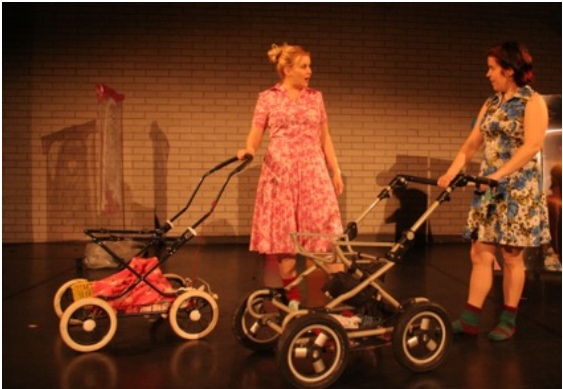
KUVA 1. Vaunuttelevat äidit.

Ote mörköpäiväkirjasta 14.9.2014 Tampereella: Päätettiin, että esitys pyrkisi tuomaan näkyväksi sellaisia vanhemmuuteen liittyviä kipupisteitä tai tabuja, joita ei helposti muutoin nosteta esiin tai joista ei puhuta. Pohdittiin ympäröivän maailman tuottamista paineista olla oikeanlainen hyvä äiti tai vanhempi. Roolitusta lähdetään rakentamaan kahden äidin tai äitihahmon ympärille (KUVA1).