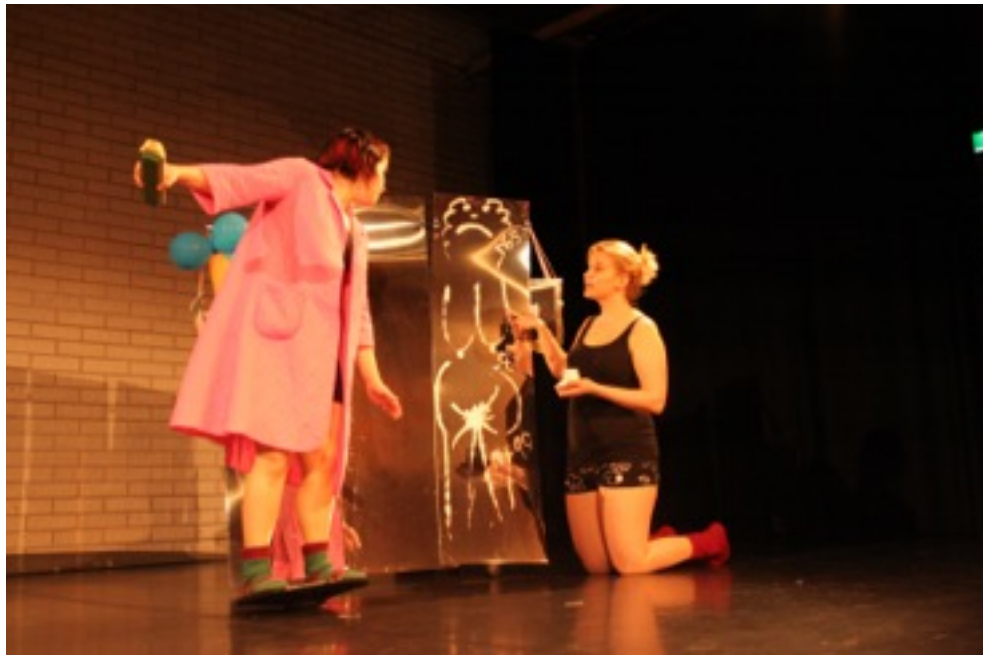
KUVA 3. Äiti tasapainoilee.

Ote mörköpäiväkirjastani 1.11.2014, Harjoitukset Tampereella: Tänään kuvattiin materiaalia esitystä varten ohjaajan kotona. Neuvolakohtaukseen improvisoitiin sisältöä. Syntyi hyviä ja käyttökelpoisia ideoita: minä tasapainoile tasapainolaudalla (KUVA 3) ja Minna piirtää ”neuvolakäyriä” peiliin. Videokuvattiin improvisaatiot, joiden pohjalta Kirsi (ohjaaja) kirjoittaa materiaalin käsikirjoitukseen.