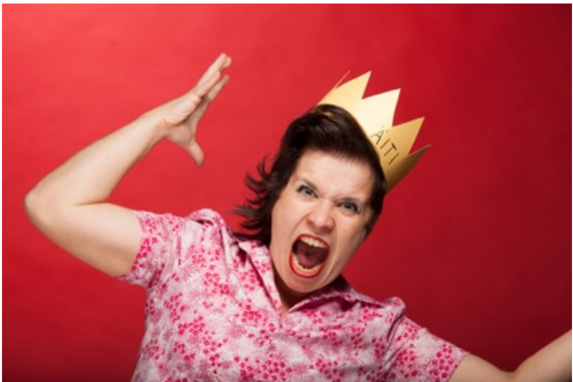
KUVA 7. Äidin raivo.

Tunteet (KUVA 7) ovat intuitiivisia arvioita siitä, mitä tilanteet yksilölle merkitsevät ja miten niissä tulisi toimia. Jokaisella tunteella on oma tehtävänsä. Esimerkiksi pelko mittaa tilanteessa olevia riskejä tai rakastuminen tunnistaa sopivan kumppanin. Tulevalla äidillä voi liittyä odotuksia myös tunteisiin, joita kokee syntymän yhteydessä, jotka voivat kuitenkin poiketa todellisuudessa paljonkin mielikuvista. (Janhunen & Saloheimo 2008, 30.) Tarkastelemalla tunteita, saadaan tietoa siitä, miten ihmiset voivat arjen eri tilanteissa. Tunteiden merkitys korostuu erityisesti ihmissuhteissa, joissa ne voivat toimia joko liimana tai kitkana. Tunteisiin liittyvä perhetutkimus on myös viimeaikoina lisääntynyt, kun on havaittu niiden vaikuttavan perheenjäsenten hyvinvointiin, ajatteluun ja toimintaan keskeisellä tavalla. (Rönkä, Laitinen & Malinen 2009, 204.)