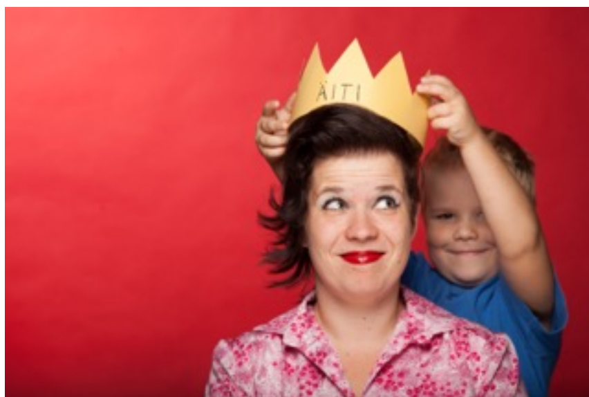
KUVA 5. Äidin odotukset.

Ihannevanhemmuuden myytit (KUVA 5) elävät yhteiskunnassamme hyvin tiukassa, eikä mediatykytys helpota oman tien löytämistä vanhemmuudessa (Juvakka 2005, 28). Myös Bardyn (2002, 39) mukaan lapsen tulo mullistaa kaiken, ennakkoon on mahdoton kuvitella millaista vanhemmuus tulee olemaan. Vaikka vanhemmuudelle ei ole olemassa yksiselitteistä, yleisesti hyväksyttyä tavoitetta, vanhemmilta odotetaan kuitenkin ”hyvää” vanhemmuutta. Vanhemmuuteen liittyvät yhteiskunnalliset odotukset ovat julkilausumattomia, piiloisia normeja, jotka vanhempien tulisi oma-aloitteisesti oivaltaa. (Hirsjärvi & Huttunen 2000, 50.)