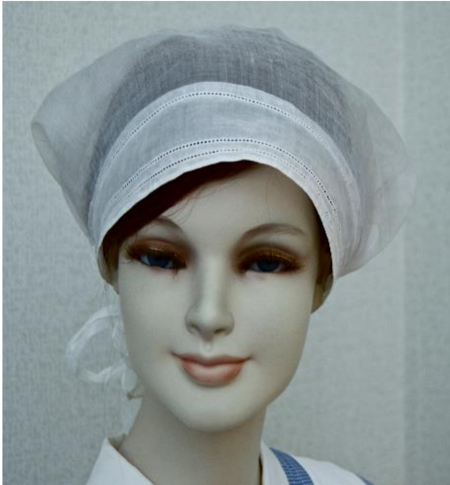
Kuvio 6. Kättilön päähine. Osana kättilön työpukua 1920-luvulla.

Valkoinen reikäompelein koristeltu huntu. Kuvattu: Hoitotyön koulutuksen museo.