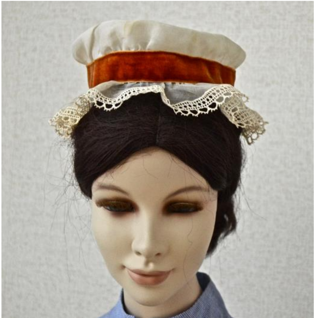
Kuvio 2. Kätilön päähine. Sairaala käytössä 1800-luvulla.

Pitsireunainen päähine, reunassa nyplätty pitsi ja oranssinen samettinauha. Ohutta batistia, pitsiä ja samettia. Kuvattu: Hoitotyön koulutuksen museo.