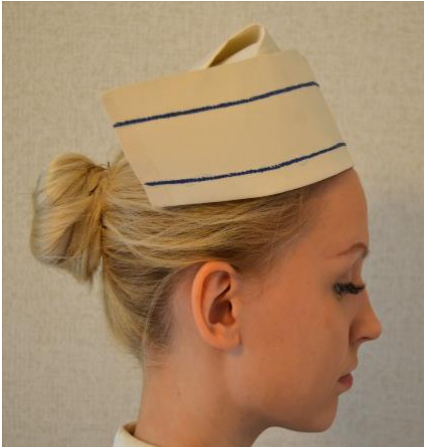
Kuvio 15. Kätilöoppilaan päähine 1940-1960 luvulla.

Valkoinen tärkätty päähine, jossa siniset nauhat, jotka osoittavat opintojen vaihetta. Kuvattu: Hoitotyön koulutuksen museo.