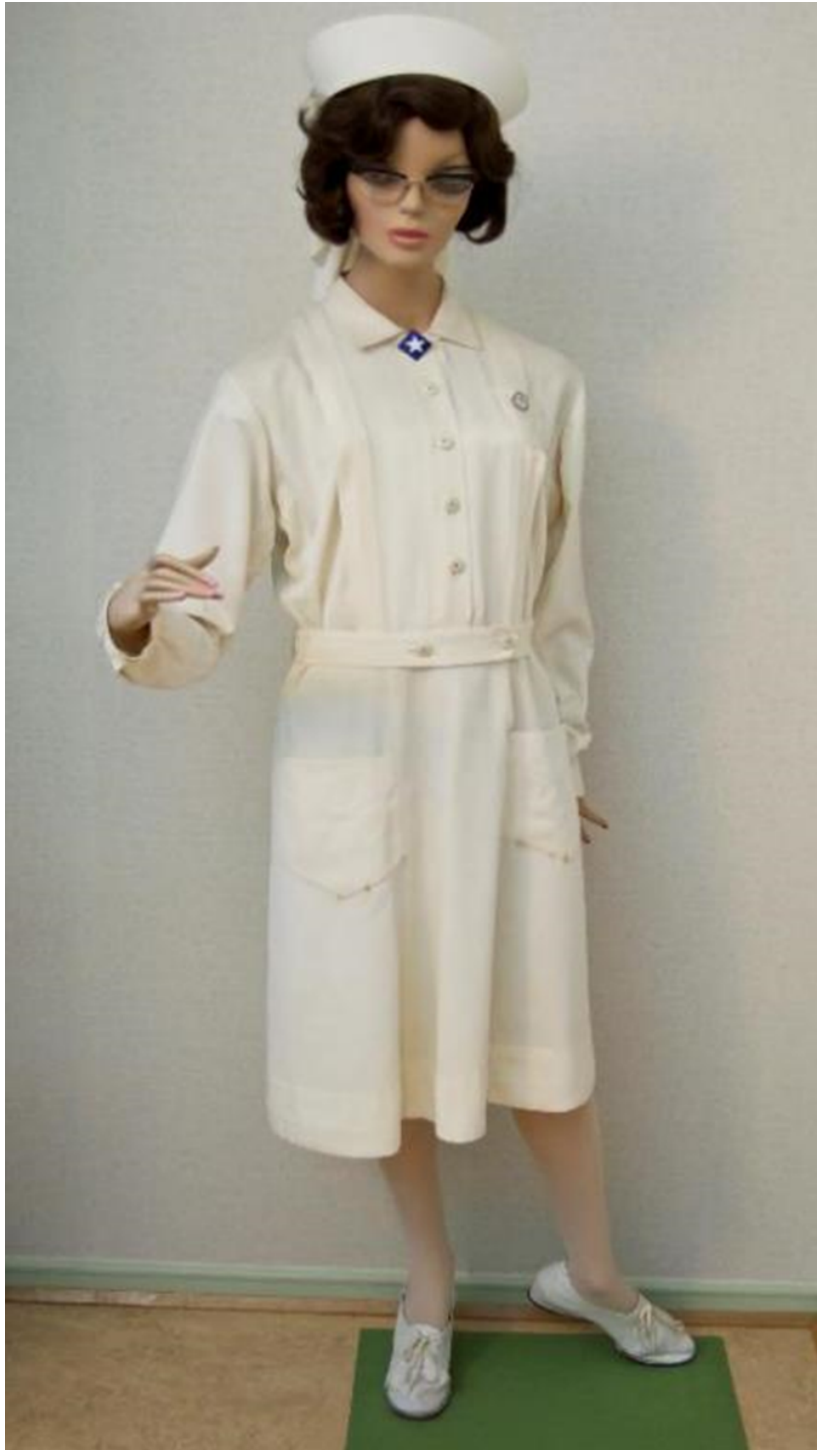
Kuvio 9. Kätilön työpuku. Kätilön virkapuku sairaala käytössä 1923-1960- luvulla.

Valkoinen pitkähihainen puku, jossa rintalaskokset, asuun kuuluu lisäksi umpinaiset valkoiset nauhakengät ja valkoiset sukat. Kuvattu: Hoitotyön koulutuksen museo. Kuvaja: Miika Kaipainen 2014.