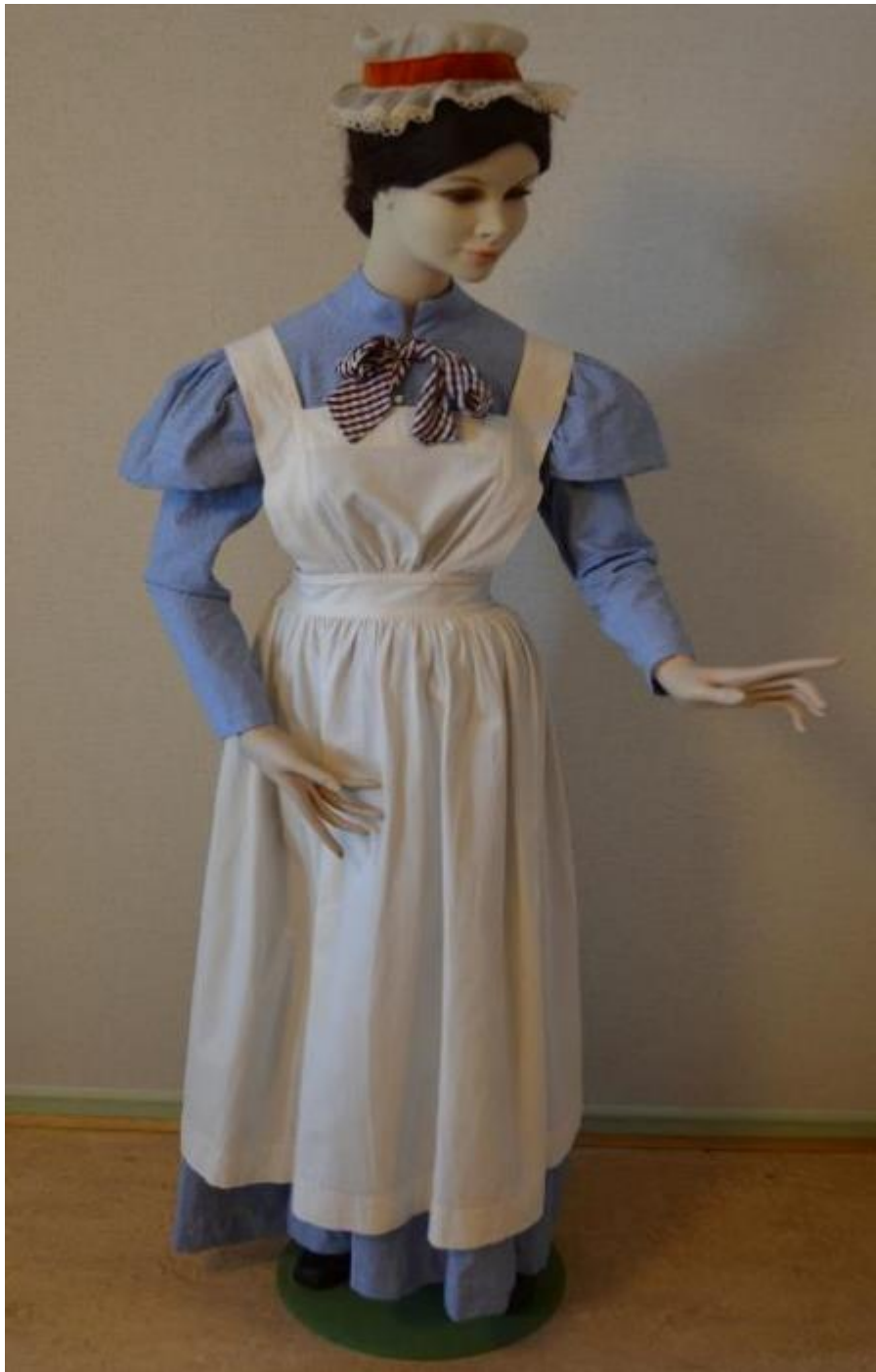
Kuvio 1. Kätilön työpuku. Sairaalakäytössä 1800-luvulla.

Sinivalkoruudullinen täyspitkähaku. Pitkät puhvihihat. Asuun kuuluu valkoinen esiliina ja ruudullinen silkkinen kaularusetti. Kuvattu Hoitotyön koulutuksen museo.