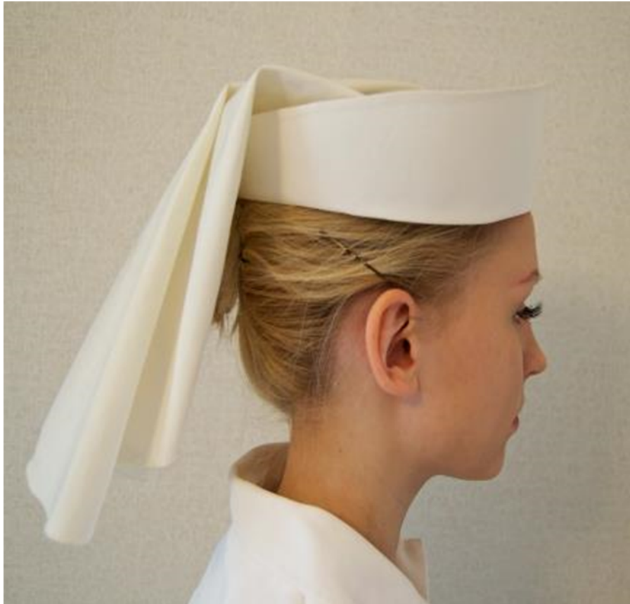
Kuvio 11. Kätilön päähine. Osana kätilön virkapukua 1960-luvulla.

Tärkkäyksellä kovitettu pyöreä hilkka, jossa huntu. Kuvattu: Hoitotyön koulutuksen museo.