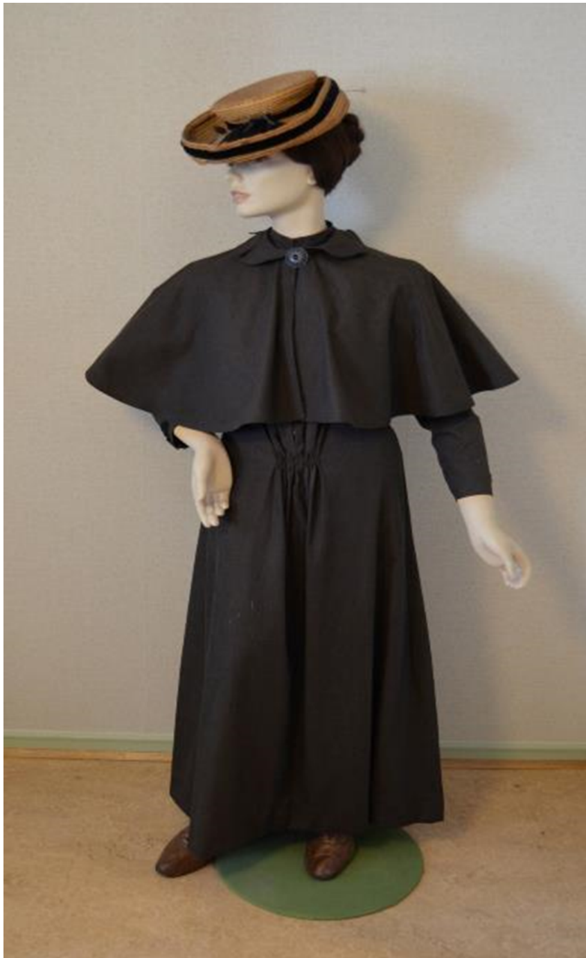
Kuvio 3. Kätilön työpuku. Hailuodon kätilön työpuku 1890-luvulla.

Tumman ruskea pitkä puku, jossa kauluksellinen keppi, joka on kiinnitetty metallisella soljella. Asuun kuuluvat ruskeat varsikengät ja olkinen lierihattu. Kuvattu: Hoitotyön koulutuksen museo. Kuvaaja: Miika Kaipainen 2015.