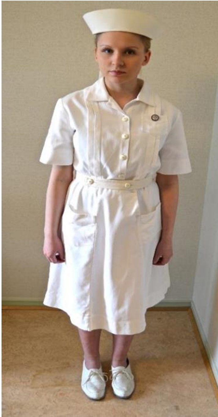
Kuvio 10. Kättilön työpuku. Sairaala käytössä 1940-1970-luvuilla.

Valkoinen lyhythihainen puku, jossa rintalaskokset ja vyö. Kuvattu: Hoitotyön koulutuksen museo.