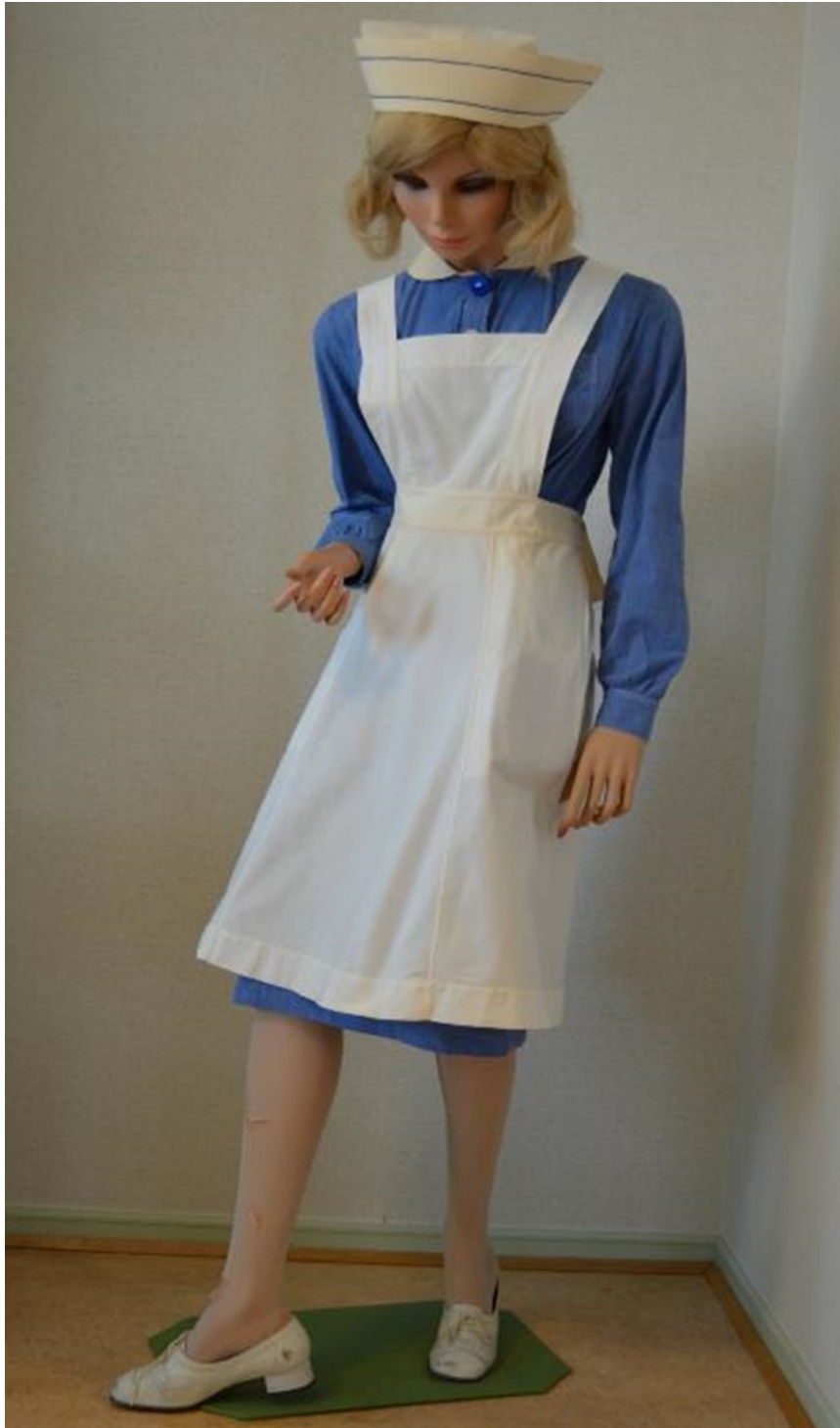
Kuvio 16. Kätilöoppilaan puku 1960-luvulla.

Sininen pitkähihainen puku, valkoinen esiliina ja valkoinen tärkätty kaulus. Asuun kuuluivat valkoiset umpinaiset nauhakengät ja valkoiset sukat. Kuvattu: Hoitotyön koulutuksen museo. Kuvaaja: Miika Kaipainen 2014.