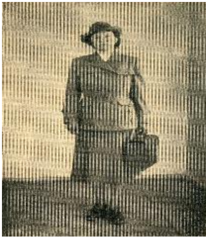
Kuvio 4. Kätilön kenttäpuku vuodelta 1945. (Kätilölehti 1950: 162)

Villakankaista, hyväksi havaittua pukua valmistettiin vielä vuonna 1961. Mallia oli vain vähän entisestään muutettu yhteisten päätösten mukaisesti Kätilöliitossa. Mikäli kätilö halusi tilata vihreän kätilön puvun, mukaan tuli liittää seuraavat mitat: rinnan, vyötärön ja lantion ympäryys sekä helman ja hihojen pituus. Puvun hinta: takki 10.000 markkaa, hame 4.500 markkaa, liivi 3.000 markkaa. (Kätilölehti 1961: 134.)