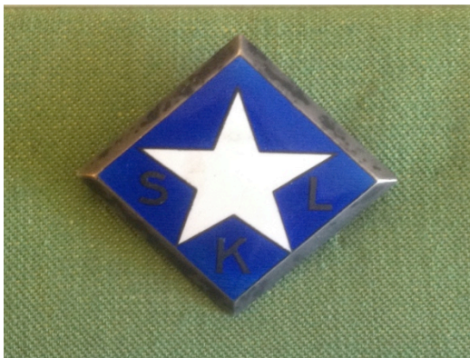
Kuvio 18. Suomen Kätilöliiton ry:n jäsenmerkki.

Merkkiä käytettiin työpuvussa 1904-1923- luvulla. Punainen viisisakarainen tähti valkoisella pohjalla. Kuvattu: Hoitotyön koulutuksen museo. Kuvaaja: Miika Kaipainen 2014.