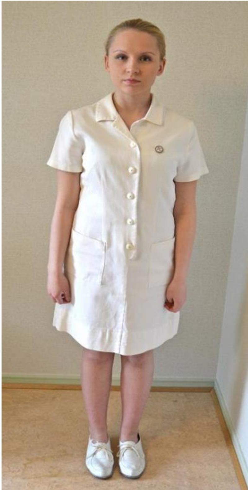
Kuvio 12. Kätilön työpuku. Sairaala käytössä 1970-1980-luvuilla.

Valkoinen lyhythihainen puku. Kuvattu: Hoitotyön koulutuksen museo.