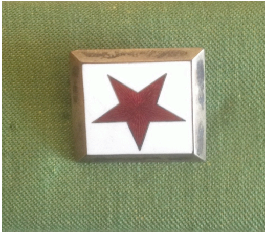
Kuvio 17. Kätilömerkki.

Merkkiä käytettiin työpuvussa 1904-1923- luvulla. Punainen viisisakarainen tähti valkoisella pohjalla. Kuvattu: Hoitotyön koulutuksen museo. Kuvaaja: Miika Kaipainen 2014.