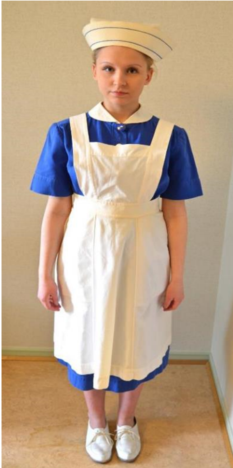
Kuvio 14. Kätilöoppilaan puku 1940-luvulla.

Sininen lyhythihainen puku, jossa valkoinen irrotettava kaulus sekä valkoinen esiliina.