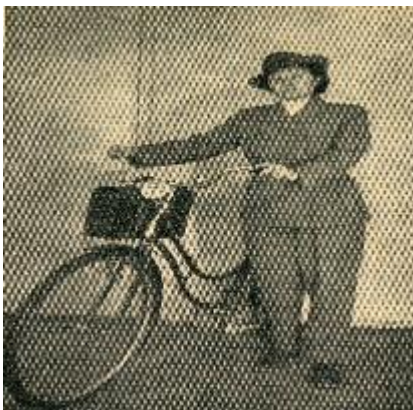
Kuvio 5. Kätilön kenttäpuku hiihtohousuilla vuodelta 1945. (Kätilölehti 1950: 163)