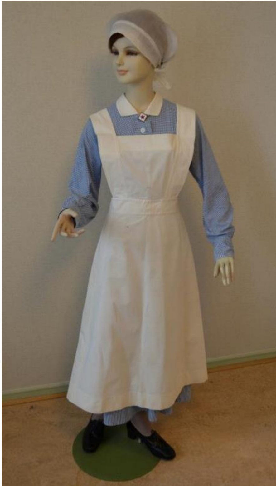
Kuvio 5. Kätilön työpuku. Sairaala käytössä 1920-luvulla.

Sinivalkoruudullinen, pitkähihainen puku, valkoinen kaulus, valkoinen esiliina ja mustat nauhakengät. Kuvattu: Hoitotyö museo. Kuvaaja: Miika Kaipainen 2014.