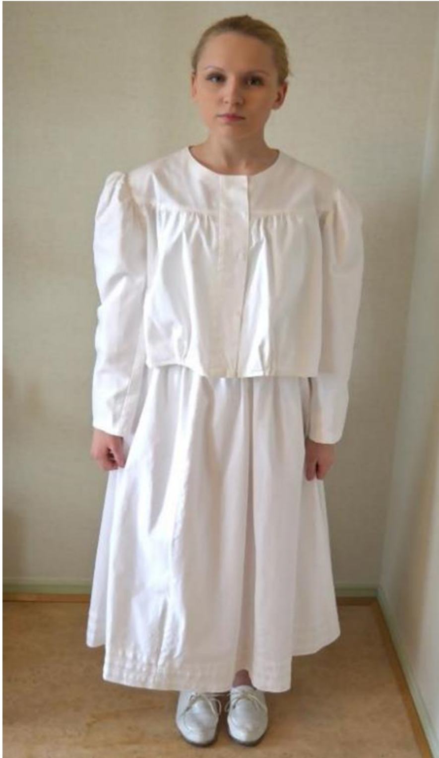
Kuvio 4. Ylikättilön työpuku. Sairaala käytössä 1900-luvun alussa.

Kaksiosainen valkoinen leninki, hameen helmassa laskokset sekä puhvit hihoissa. Kuvattu: Hoitotyön koulutuksen museo. Kuvaaja: Miika Kaipainen 2014.