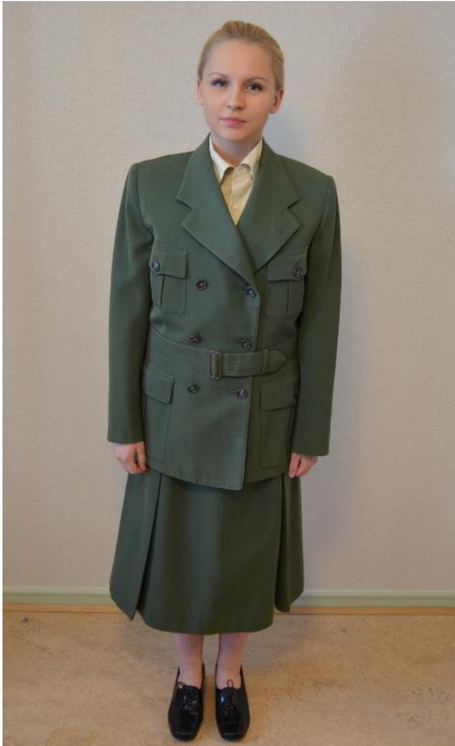
Kuvio 7. Kunnan kättilön puku eli ”kenttäpuku.”

Käytössä 1950-luvulla. Sammaleen vihreä vyöllinen jakkupuku. Pukuun kuuluvat liivi, hame, jakku ja beige paitapusero. Kuvattu: Hoitotyön koulutuksen museo.