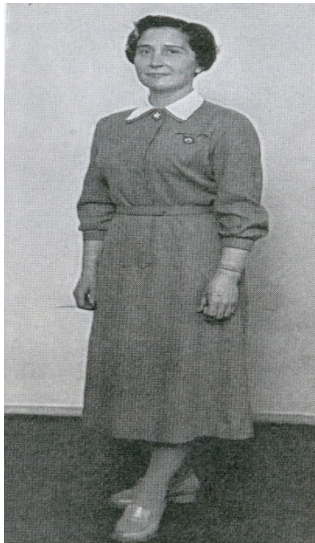
Malli 5 astelee esiin

Hoitotyön koulutuksen museossa on esillä neuvolakättilön työpuku vuodelta 1960. Tuohon aikaan puku oli harmaata villasekoitekangasta. Asuun kuuluivat myös vyö ja valkoinen kaulus. Sukat olivat ruskeat ja kengät ruskeat tai mustat. Kunnankättilön työtävien pääpainoksi muodostui ohjaus, opetus, raskauden aikainen seuranta ja synnytäneen naisen hoito sairaalasta kotiutumisen jälkeen. (Paananen ym. 2012: 21-22.)