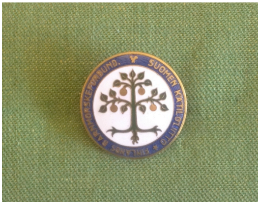
Kuvio 20. Pohjoismainen kätilömerkki.

Osana kätilöoppilaan työpukua 1934-1970-luvuilla. Valkoinen viisisakarainen tähti, osittain näkyvissä sinisellä pohjalla. Kuvattu: Hoitotyön koulutuksen museo.