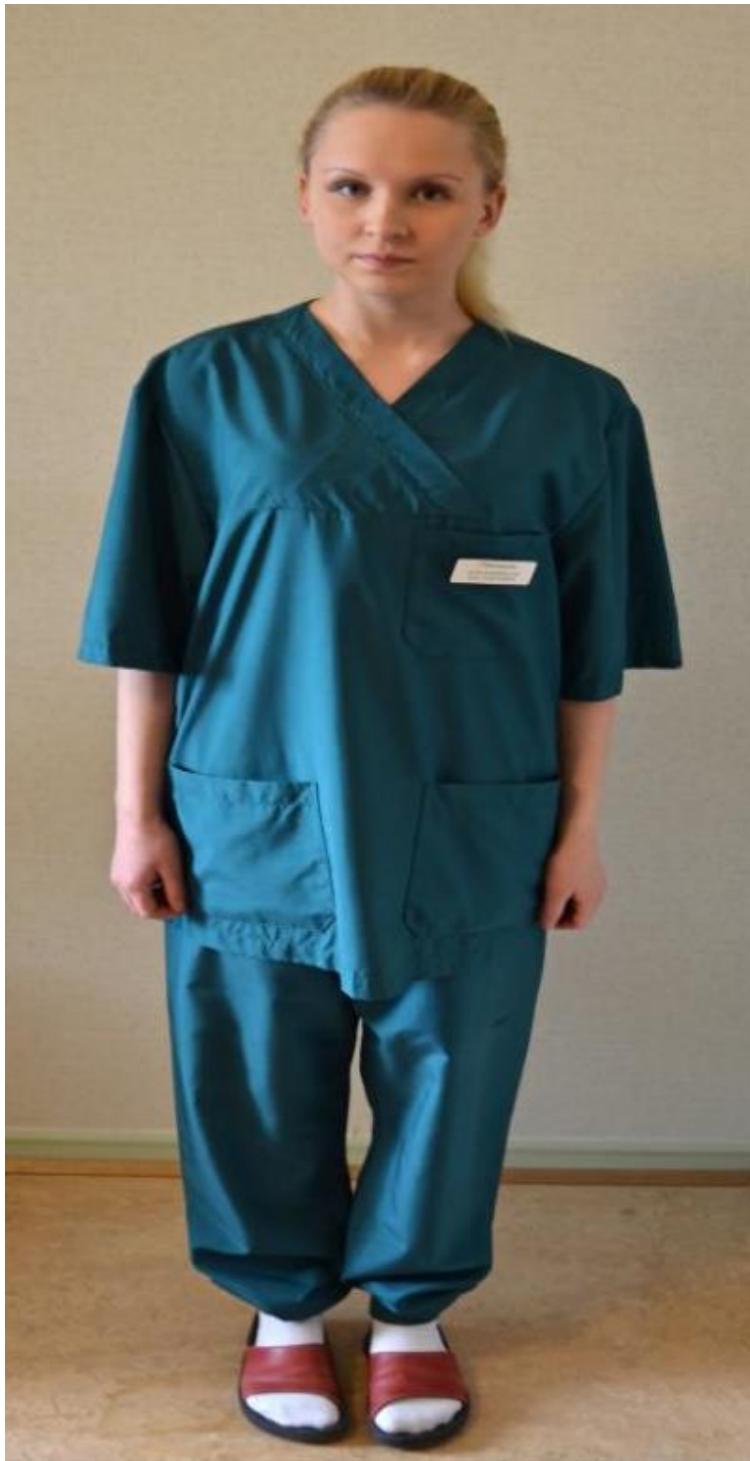
Kuvio 13. Kätilön työpuku. Sairaala käytössä 2000-luvulla

Vihreä lyhythihainen puuvilla puku. Kuvattu: Hoitotyön koulutuksen museo. Kuvaaja: Miika Kaipainen 2014.