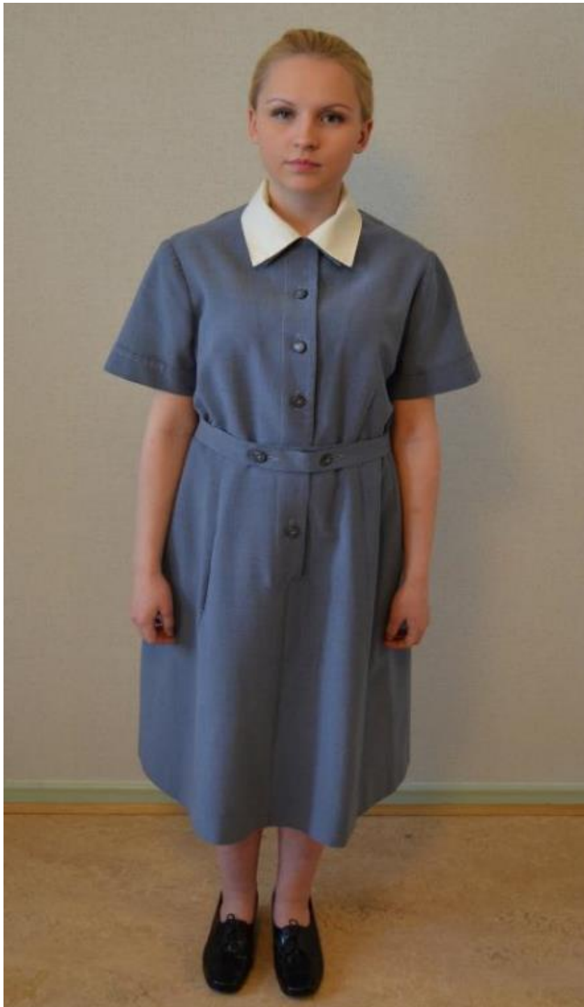
Kuvio 8. Neuvolakätilön työpuku. Käytössä neuvoloissa 1960-luvulla.

Siniharmaa lyhythihainen, valkokauluksellinen, vyöllinen puku. Kuvattu: Hoitotyön koulutuksen museo.