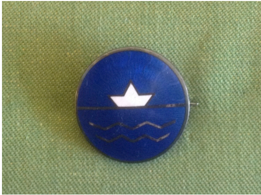
Kuvio 19. Oppilasmerkki.

Osana kätilöoppilaan työpukua 1934-1970-luvuilla. Valkoinen viisisakarainen tähti, osittain näkyvissä sinisellä pohjalla. Kuvattu: Hoitotyön koulutuksen museo. Kuvaaja: Miika Kaipainen 2014.