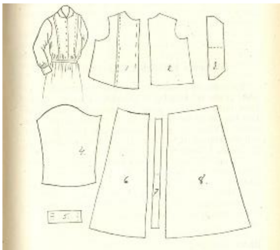
Kuvio 3. Kätilöntyöpuvun kaavat 1920-luvulla. (Kätilönkäsikirja 1929: 61 Kuva: Kaipainen Kiia ja Mähönen Mervi 2015)