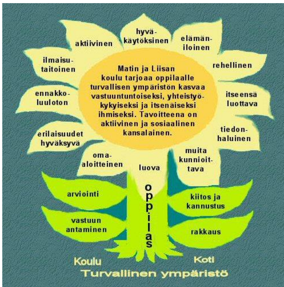
Kuva 1: Matin ja Liisan koulun toiminta-ajatus (Matin ja Liisan koulu 2014c.)

kasvamiseen. Kukan terälehdet osoittavat sitä, millaisia arvoja ja taitoja nuorella tulisi olla. (Matin ja Liisan koulu 2014c.)