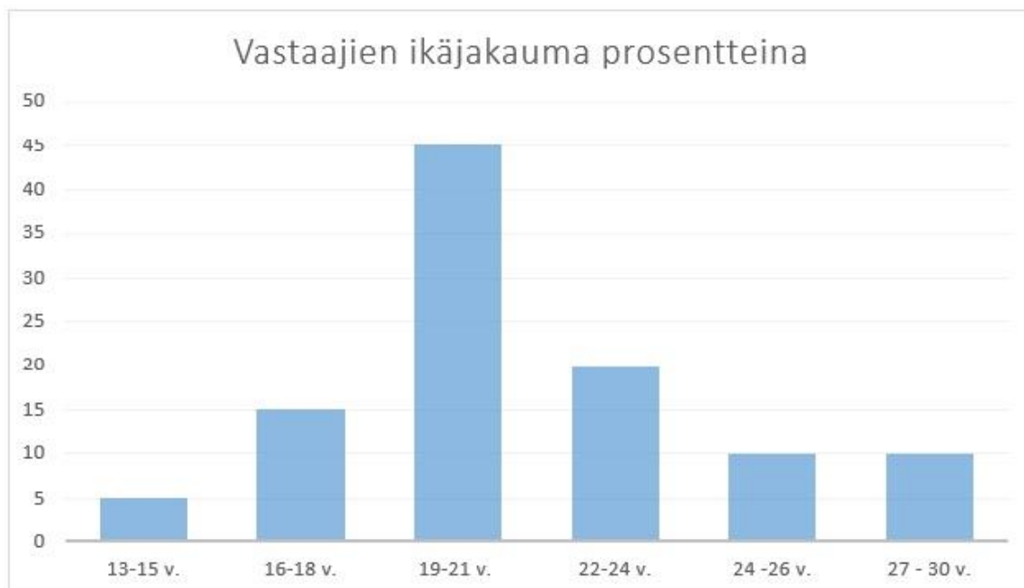
KUVIO 2. Kyselyyn vastanneiden ikäjakauma.

23 vuotta, 73 % prosenttia naisia ja 27 % miehiä (H1 Jyväskylän Best Buddies -toiminnan suunnittelija 2016).