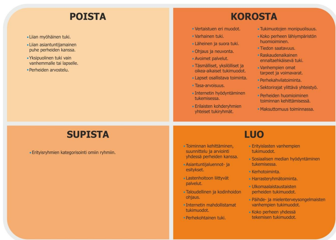
KUVIO 2. Nelikenttämalli kehittämissuhteista (Kim ja Mauborgne 2015, 70).

Tulosten ja johtopäätösten jäsentämisessä olen käyttänyt W. Chan Kimin ja Renée Mauborgnen (2015) sinisen meren strategiaa, jota voidaan käyttää havainnollistajana toiminnan kehittämisessä. Kokosin tuloksistani ja niistä johdetuista johtopäätöksistäni kehittämissuhteet seuraavan Sinisen meren strategian nelikenttämalliin, josta on selvemmin tarkasteltavissa, mitä jo olemassa olevia asioita korostetaan, mitä asioita supistetaan, mitä asioita poistetaan ja mitä uusia asioita luodaan (kuvio 2).