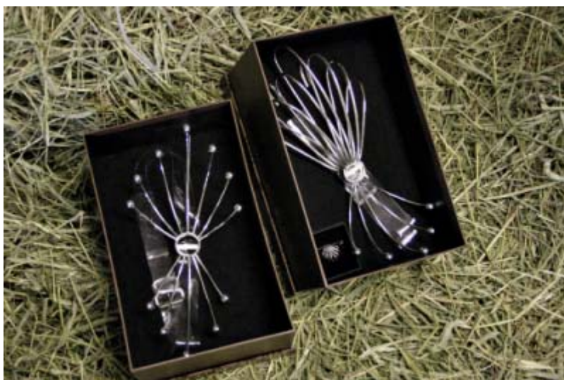
Båda smyckena för hästar och smycket till ryttaren.

Vita hästar kan även medföra ett problem genom att polerat silver inte kanske syns lika bra på vitt som på andra färger. Det kunde vara en möjlighet att till exempel oxidera silvret så att det skulle bli mörkt och på det sättet få smycket att synas bättre. Oxiderat silver kanske i sin tur inte ger samma ståtliga känsla som icke oxiderat silver.