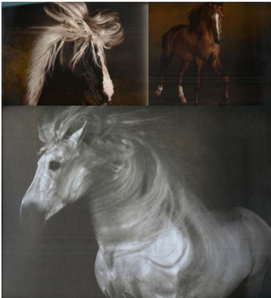
Inspirationsbilder för formgivningen av smyckena. (Yann Arthus-Bertrand, s. 152, 97, 0,)