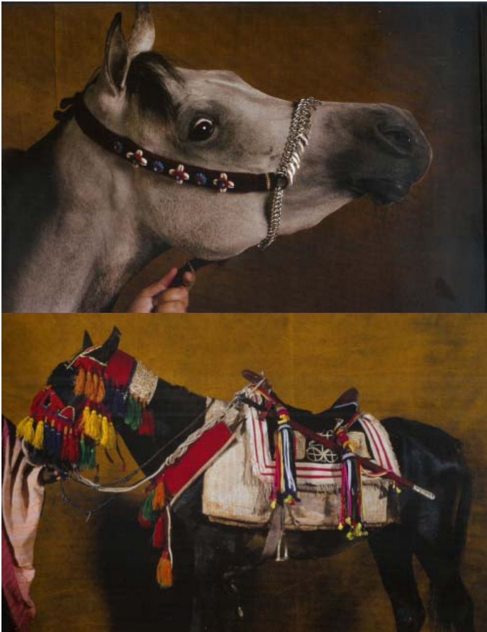
Dekorering av hästar i andra kulturer. (Yann Arthus-Bertrand, s. 105, 39)