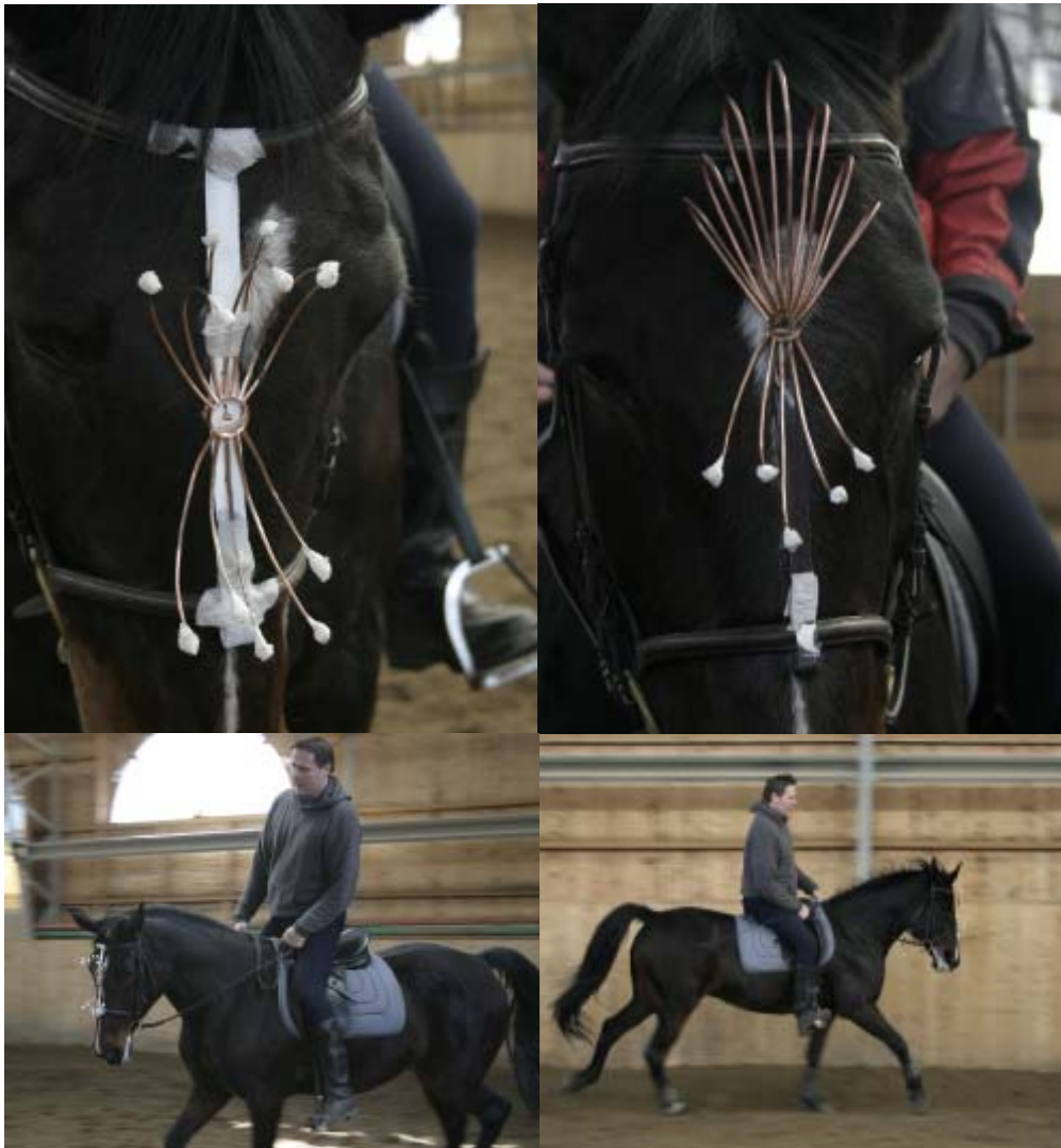
Prototyperna provanvänds före slutliga smyckena tillverkas.