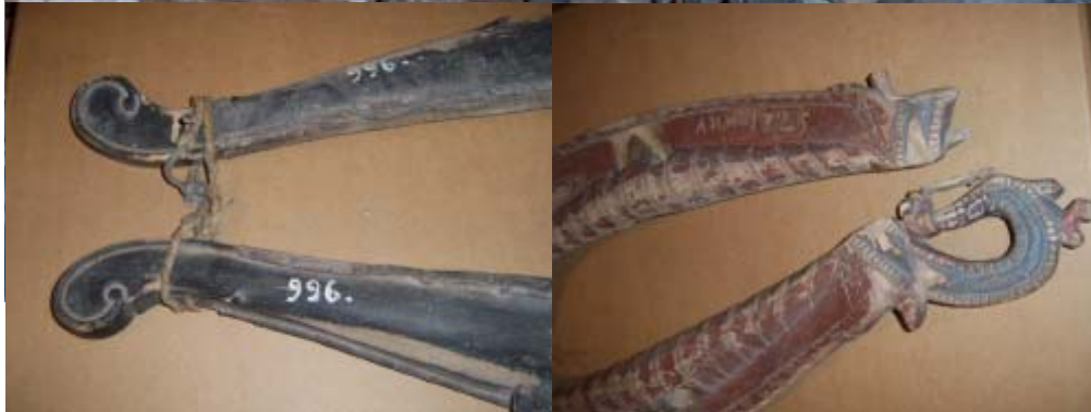
Exempel på hur rankor sett ut.