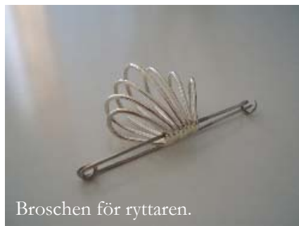
Broschen för ryttaren.

Broschen kan kallas för en biprodukt i detta arbete, men jag tror att det kan vara lätt att väcka intresset för detta smycke hos ryttarna. Smycket är en produkt som redan från tidigare hört till tävlingsryttaren och det är relativt litet för att inte göra användningen svår. Fastsättningen av smycket är löst med en vanlig nål av stål för att hållbarheten skall vara bra.