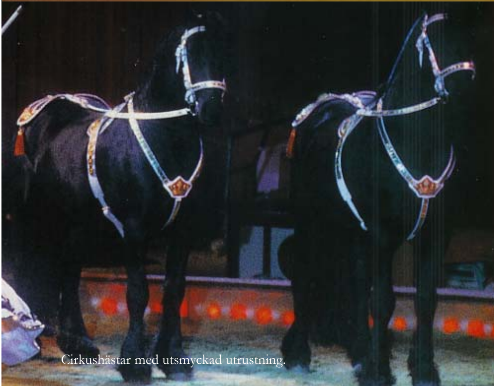
Cirkushästar med utsmyckad utrustning.