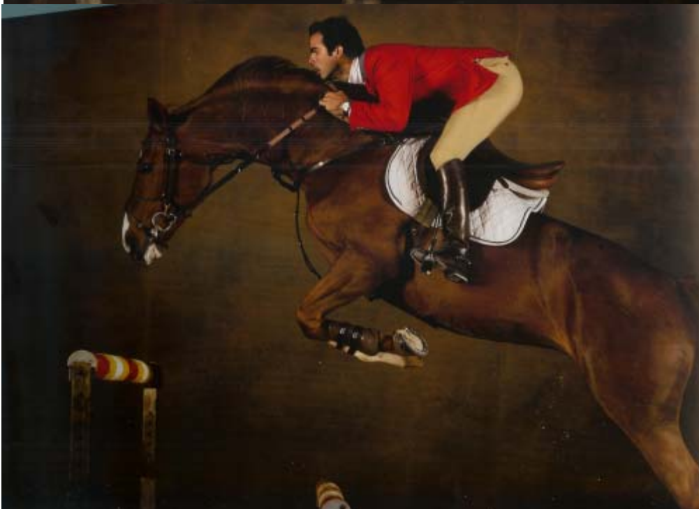
Övre bilden: Västerntidutrustning. Nedre bilden: Typisk ridutrustning i de Europeiska länderna. (Yann Arthus-Bertrand, s. 91, 127)