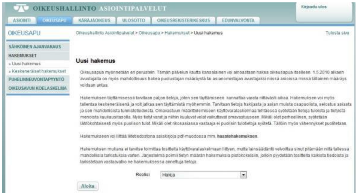
Kuva 1. Uuden hakemuksen aloittaminen sähköisessä asianhallintajärjestelmässä

varten tarvittavat tiedot. Hakijalla tulee olla selostus asiasta, sen tunnistetiedoista sekä mahdollisista muista osapuolista. Hakemukseen tulee syöttää tiedot tuloista ja tietyistä menoista kuukausitasolla sekä tietyt varat ja niihin kuuluvat velat. Ohjeistuksessa kerrotaan, että hakijan ei tarvitse liittää hakemukseen käyttövaralaskelmaan liittyviä tositteita, mutta ne tulee säilyttää mahdollisia tarkastuksia varten.