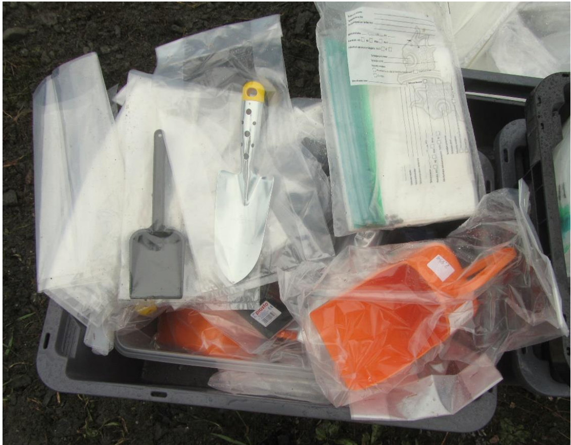
Kuva 2. Valmiiksi omiin pusseihinsa pakattuja, puhtaita näytteenottovälineitä.

Edustavan näytteenoton helpottamiseksi on alkuvalmistelujen oltava kunnossa ennen varsinaista näytteenottoa. Alkuvalmisteluihin kuuluu näytteenottovälineistön kokoaminen ja pakkaaminen, joiden yhteydessä varmistetaan näytteenottoon soveltuvien puhtaisten näyteastioiden riittävyys, näytteenottimien toimivuus ja puhtaus sekä muiden tutkimusvälineiden kunnan ja toimivuuden tarkistaminen. Kuljetuksen ajaksi on varmistettava, etteivät näyteastiat tai näytteenottovälineet pääse rikkoutumaan tai puhtaat ja likaiset näytteenottovälineet sekoitu keskenään. Näytteenoton jälkeen välineet on puhdistettava ja tarvittaessa kunnostettava tai uusittava ennen seuraavaa näytteenottoa. Virheettömät näytteenottovälineet ja laadukas työskentely varmistavat tulosten luotettavuuden ja johtopäätösten oikeellisuuden. (Kettunen ym. 2008, 41-56; Lepistö ym. 2014.)