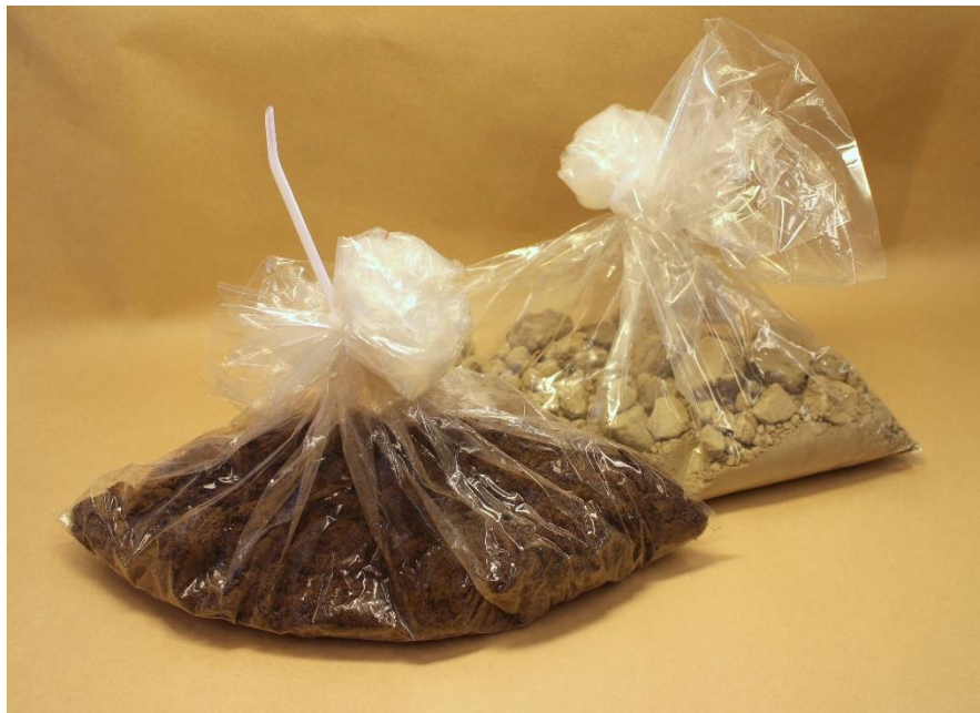
Kuva 10. Maaperänäytteitä nippusiteillä suljetuissa palojätepusseissa.

Maaperänäytteistä voidaan etsiä samoja aineita kuin vesinäytteistäkin, vain näytteenotomenetelmät poikkeavat toisistaan. Kun ympäristöriskostutuksessa halutaan kerätä maaperänäytteitä etsittäessä orgaanisia aineita (ei metalleja) näytteet kerätään lasiseen tai HDPE-muoviseen näyteastiaan tai suoraan palojätepussiin. Kerättävän näytteen tulisi olla mahdollisimman hienojakoista ja sitä tulisi olla noin ½ litraa. Näytteenotto suoritetaan puhdistetuilla mieluiten maalaamattomilla työkaluilla, kuten esimerkiksi metallilusikalla. Näyteastia otetaan täyteen ja tiivistetään lusikalla. Näyte säilytetään valolta suojattuna ja viileässä (+ 4 °C). Maaperänäytteen tulisi olla edustava näyte saastuneen alueen maaperästä, sen eri kohdista ja syvyyksistä koottu kokoomanäyte. Mikäli etsittävä aine maaperässä on metalleja, näyte kerätään samoin kuin orgaaninen näyte, mutta näyteastian tulee olla HDPE-muovinen ja näytteenottoon käytettävän lusikan muovinen virheellisten tulosten välttämiseksi. Näyteastiat suljetaan ennen pakettiin laittamista palojätepussiin. Varsinaisen näytteen lisäksi pitää muistaa kerätä nollanäyte vertailuksi saastumattomasta maaperästä. (Viitala 2012.)