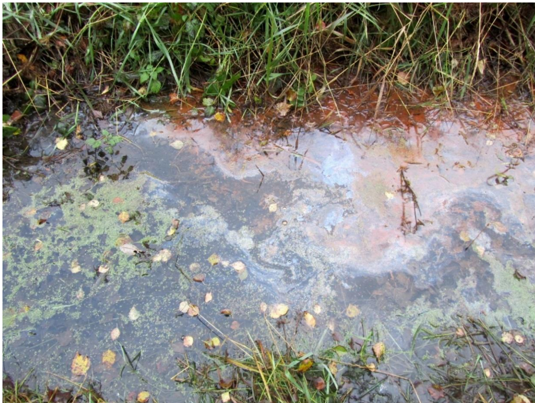
Kuva 4. Ympäristörikospaikka, öljyä veden pinnalla.

Mikäli tutkittava aine vedessä on öljyä, kerätään näyte vedenpinnalta. Astia voi olla lasinen tai kovamuovinen (HDPE). Näytettä tulisi olla 0,1-1 litra. Näytteeksi tulee ottaa myös paakkuuntunut öljy. Öljyn ollessa paksua, näyteastian on hyvä olla leveäsuinen näytteenoton helpottamiseksi. Näyteastiasta poistetaan mahdollisimman paljon sinne joutunutta vettä. Jos vedenpinnassa oleva öljykerros on ohut, näytteenottamiseen käytetään siihen erityisesti suunniteltua ETFE-verkkoa. Verkko heitetään vedenpinnalle siiman päässä esimerkiksi virvelillä. Verkkoa kuljetetaan vedenpinnassa, jolloin se kerää itseensä vedenpinnalla olevan ohuekin öljykerroksen. Verkko pakataan leveäsuiseen näyteastiaan tai suoraan palojätepussiin. Käytettävän verkon tulee olla yksittäin pakattu ja koskematon. Verkon koskettelua käsin tulee välttää. Verkkoa käytettäessä suojakäsineiden käyttö on erityisen tärkeää. Verkko kerää itseensä jopa käsissä olevia rasvoja, näin vaikeuttaa mahdollisesti laboratorioissa saatavien tulosten tulkintaa. Kaikkia näytteitä kehoitetaan oppaassa säilyttämään viileässä (+ 4 °C) ja orgaanisten näytteiden säilytys tulisi lisäksi tapahtua valolta suojattuna. (Suomen ympäristöopisto SYK-LI 2007; Viitala 2012.)