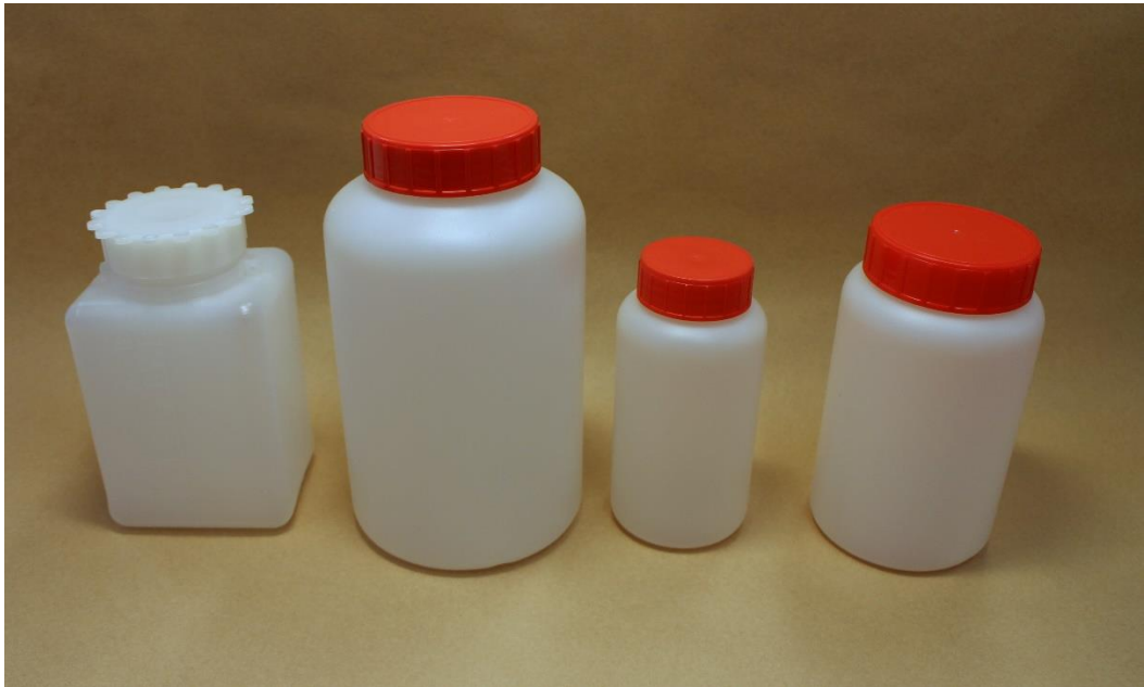
Kuva 13. HDPE-muovisia näyteastioita.

jästä astiasta voidaan tarvittaessa tutkia, irtoaako siitä jotain näytettä saastuttavaa ainetta. (Interpol 2014.)