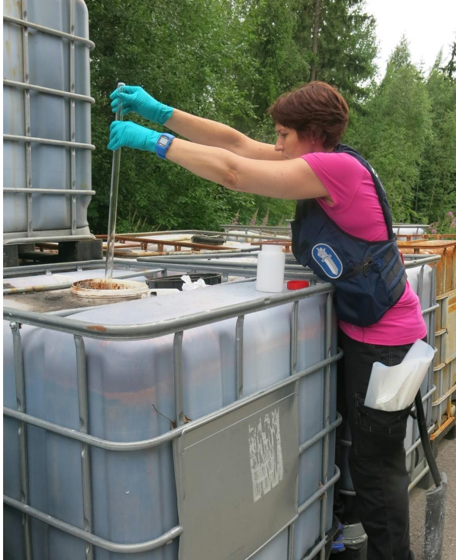
Kuva 1. Ympäristörikosnäytteenottoa säiliöstä lasisella putkinoutimella.

On tärkeää olla yhteydessä näytteitä tutkivaan laboratorioon, jotta laboratorio ymmärtää tutkimusten tarkoituksen, eli mitä ollaan tutkimassa ja miksi. Yhteydenotto on tärkeää myös sen vuoksi, että näytteenotto on erittäin tärkeä vaihe ja voi vaikuttaa laboratoriotuloksiin. Vääränlaisella näytteenotolla ja näytteiden käsittelyllä/kuljetuksella ym. voidaan pilata ko. näyte. (Interpol 2014.)