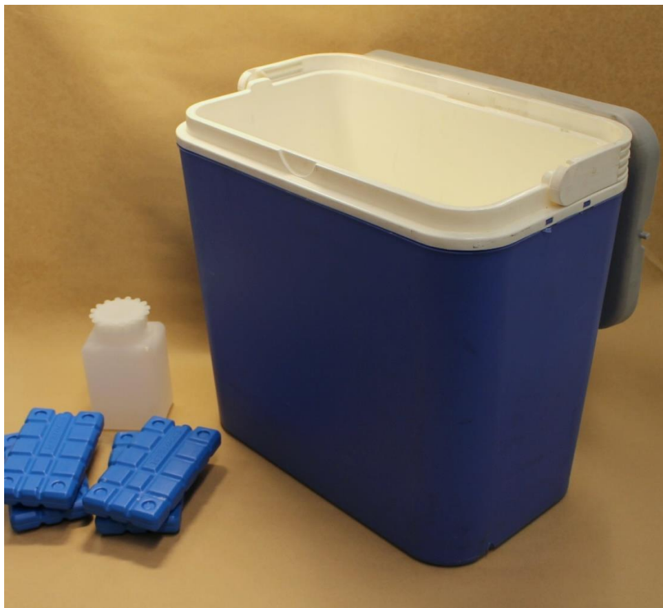
Kuva 3. Näyteastia, kylmävaraajia sekä kylmälaukku.

syivät lähes muuttumattomana lähtötilanteesta vielä vuorokauden jälkeen näytteenotosta. (Tirkkonen 2014.)