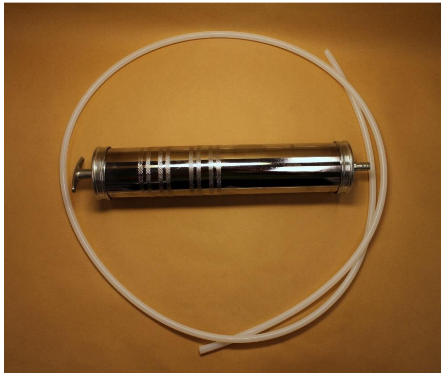
Kuva 12. Mikäli putkinoutimen käyttö ei ole mahdollista, voidaan ruiskun ja letkun avulla imeä säiliöstä nestettä näytteeksi.