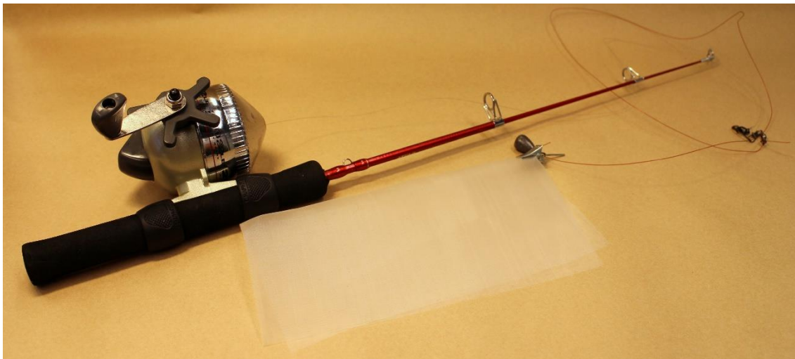
Kuva 5. Virveliin verhonipsulla kiinnitetty ETFE-verkko. Siiman päässä on lyijypaino ETFE-verkon heittämisen helpottamiseksi.