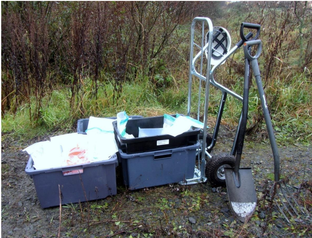
Kuva 14. Kenttätyöskentelyyn tarkoitettu, kuljetettava näytteenottokalusto.

Onko mukana oikeat ja tarvittavat näyteastiat ja kannet (sellaiset, jotka eivät kontaminoi näytteitä)?