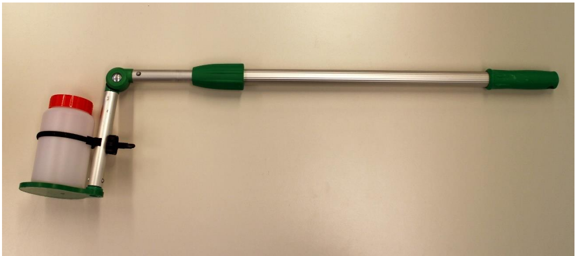
Kuva 7. Teleskooppivartinen vedennoudin, johon kiinnitetty HDPE-muovinen näyteastia.

Toinen yksinkertainen vedennoudin on varren päässä oleva näytepullo, johon näyte otetaan suoraan. Varsi voi olla teleskooppinen, jolloin näytteenotto onnistuu eri etäisyyksiltä ja hankalistakin paikoista. Joihinkin varsiin voidaan tarpeen mukaan kiinnittää monia erikokoisia tai mallisia näytepulloja ilman kiinnikkeiden vaihtoa. Varrellinen pullonäytteenotin on kevyt ja helppo kuljettaa. Lisäksi se lisää työturvallisuutta, kun näytteitä ei tarvitse kurotella tai mennä vaikeakulkuisiin paikkoihin. (Environment Canada 2005, 67-92; GWM 2016; Jyväskylän yliopisto 2016.)