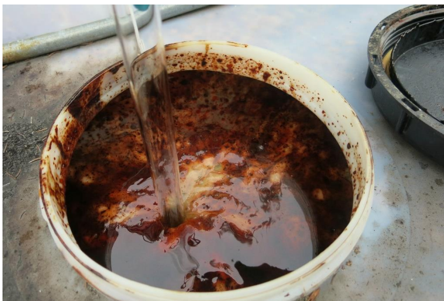
Kuva 11. Näytteenottoa lasisella putkinoutimella muovisessa säiliössä olevasta, pak- susta nesteestä ympäristörikospaikalla.