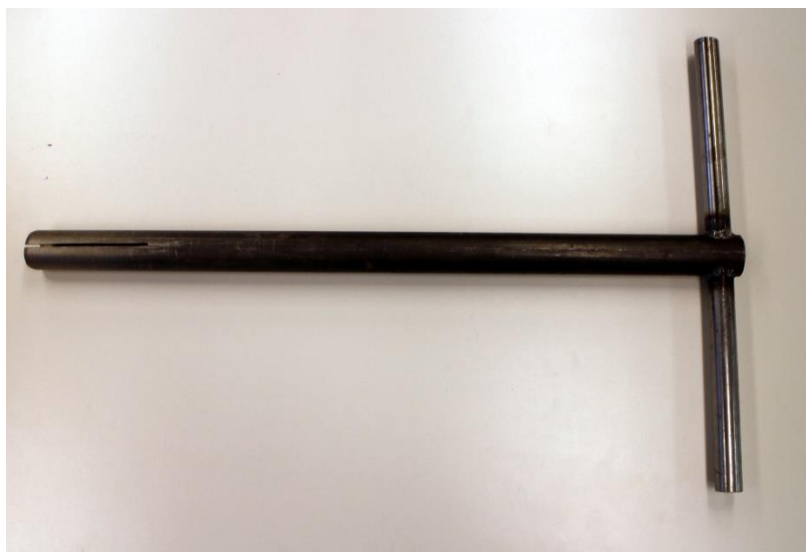
Kuva 8. Maaperänäytteenottoon käytetty omavalmisteinen kaira.

Maaperänäytteitä otettaessa voidaan valita näytteenottomenetelmäksi kairaus, koe-kuopan kaivaminen tai pintanäytteenotto. Näytteenottosyvyydellä on suurin merkitys valittaessa sopivinta menetelmää. Myös näytteenottokohteen maakerrokset, alueen maankäyttö ja pintarakenteet vaikuttavat valittavissa oleviin menetelmiin. Merkitystä on näytteenottajan kokemuksella sekä resursseilla. (Lepistö 2014.)