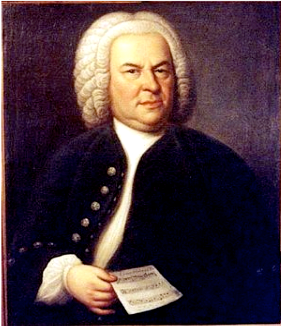
KUVIO 6. Johann Sebastian Bach.