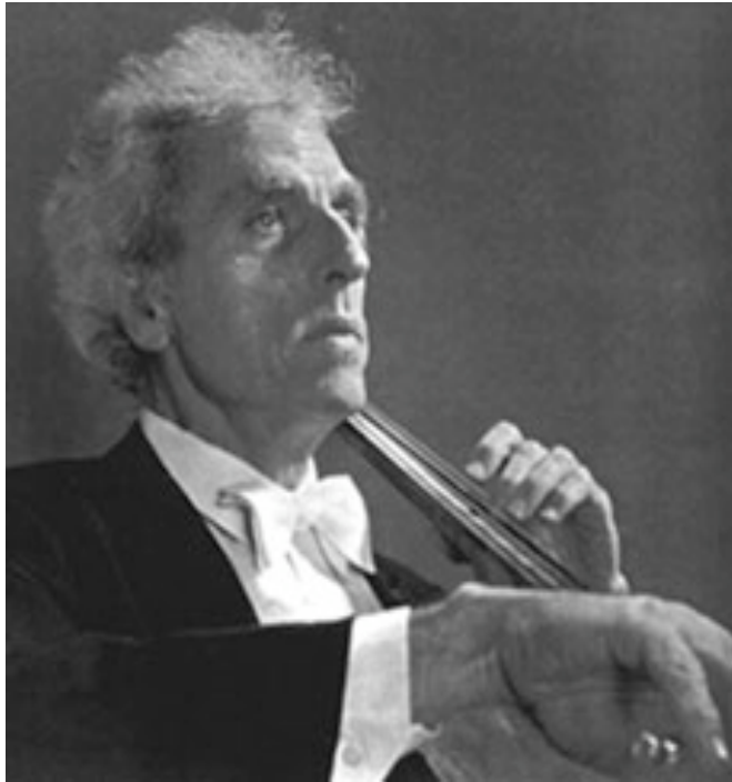
KUVIO 4. Paul Tortelier.

fraasit on tarkoitus soittaa. Toisen sarjan ensimmäinen osa alkaa piano-nyanssilla ja, osa sisältää myös erikoisen nyanssin mezzofortissimon osan puolenvälin jälkeen. Seuraava osa alkaa fortella, ja osa on tarkoitus soittaa energisesti ja ekspressiivisesti eli voimakkaalla ilmaisulla.