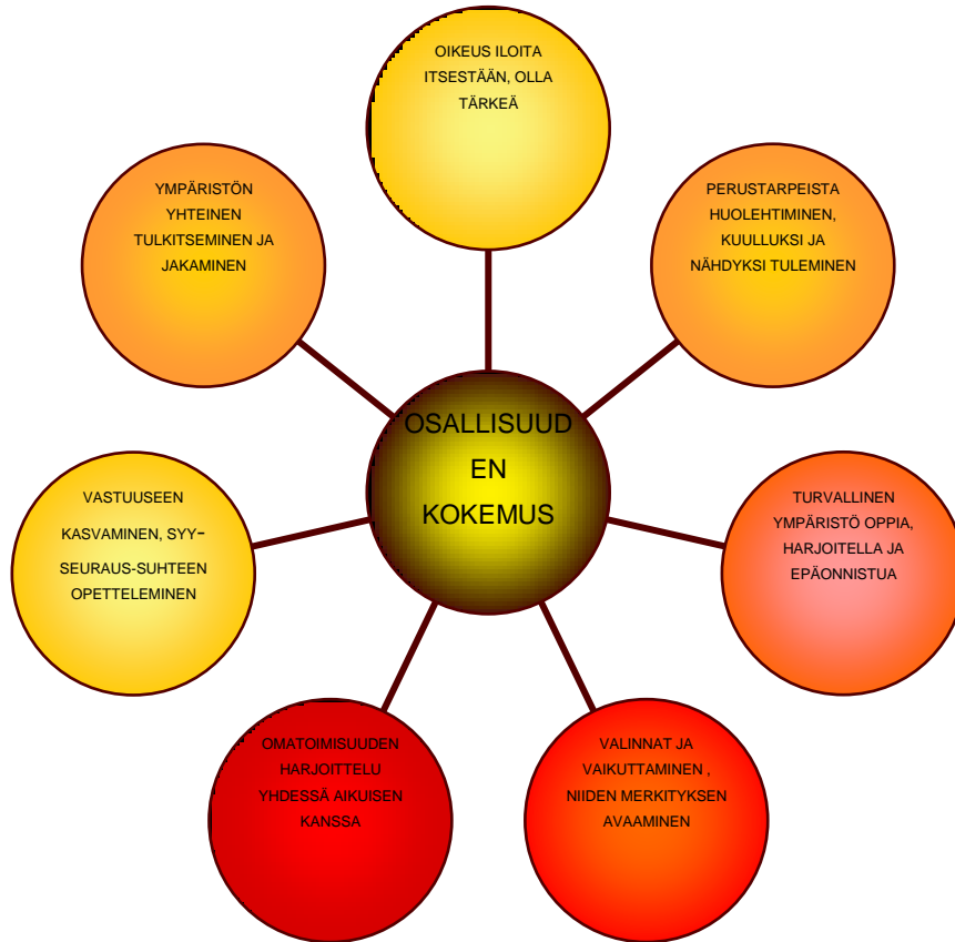
KUVIO 1. Lapsen osallisuuden kokemuksen muodostuminen (Leinonen 2014, 19.)

Pääkaupunkiseudun sosiaalialan osaamiskeskuksen Soccan varhaiskasvatukseen keskittyneissä VKK-Metro – hankkeissa tutkittiin vuosina 2009–2011 laajasti lapsen osallisuutta pääkaupunkiseudun päiväkodeissa. Tutkimusten perusteella voitiin listata seitsemän osatekijää, jotka kuvaavat lapsen osallisuuden kokemusta. Näitä tekijöitä kuvaamme kuviossa 1 Lapsen osallisuuden kokemuksen muodostuminen.