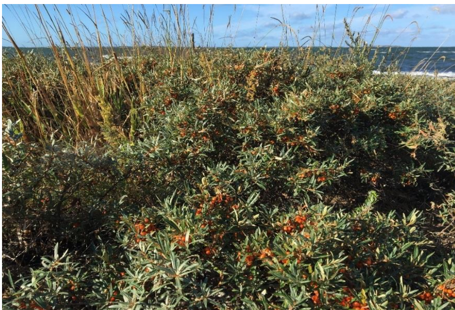
(Kuva: Lilli Temisevä 2016.)

Eräs osallistuja kertoi purjehduksen olleen uusi kokemus, jossa hän tunsi olevansa osa yhteisöä. Tunne osallisuudesta nousi esiin useassa vastauslomakkeessa tärkeänä kokemuksena. Vastaajien mukaan siihen vaikuttivat osallistujien yksilöllinen huomioiminen ja hyväksyvä ryhmähenki. Kukaan vastaajista ei kokenut oloaan ulkopuoliseksi. Kertomuksissa mainittiin uuteen kaveriin tutustuminen, ennalta olemassa olevien kaverisuhteiden vahvistuminen ja ennalta kokemattomien asioiden oppiminen. Kaksi vastaajista mainitsee kokemusten olleen luonteeltaan sellaisia, joita ei tule koskaan unohtamaan. Yksi vartiotornista otetun kuvan valinneista kertoo maiseman kauneuden lisäksi itselleen merkittäväksi tekevän hetkestä sen, että hän voitti korkeanpaikan kammonsa uskaltautumalla kiipeämään tornin ylimmälle tasolle asti. Kyselylomakkeessa kysyttiin myös halukkuutta osallistua uudelleen purjehdukselle. Vaikka kaikki vastaajat toivat esille positiivisia kokemuksia retkestä, kaksi osallistujista ei lähtisi vastaavalle purjehdukselle uudestaan. Yhtä lukuun ottamatta kaikki purjehdukselle osallistuneet suosittelisivat purjehdusta kaverille.