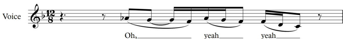
Figur 18 Etta James

Figur 17 visar hur en stigande wail och en fallande wail blandas ihop. Frasen "the night I looked at you", börjar med en kort stigande wail på ordet "the" och slutar med en fallande wail på ordet "I" och "you".