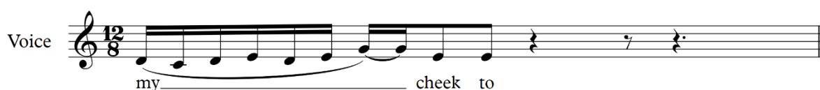
Figur 15 Snirkla kring på en ton

Figur 14 är den mest använda tekniken då det gäller låtslut. Istället för att avsluta låtar på deras grundtoner kan man som ersättning leka med tonerna kring grundtonerna innan man landar hem. Detta kan ses på ordet "need". Tonerna kretsar kring tonen d innan melodin landar hem. (Sjögren & Kullberg-Söderholm, 2009, s. 36)