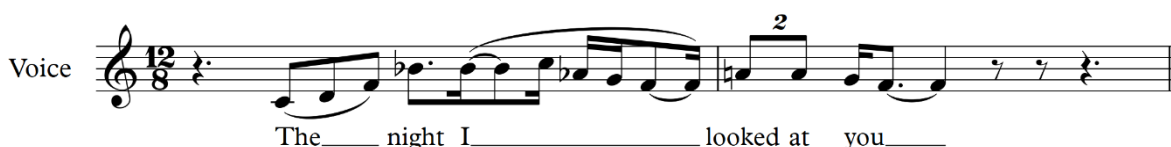
Figur 17, Christina Aguilera

Dessa fyra wailtekniker behövs inte användas skilt, utan kan även blandas ihop sinsemellan. Detta wailsätt, som kunde ses som det femte wailsättet, är mycket vanligt och är något varje artist använder sig av mer än av de enskilda teknikerna. De som gör att wailar varierar är dessa fyra sätt och den femte tekniken att kunna blanda ihop dem. På så sätt leker man med rösten och har mera verktyg att använda sig av. Se figur 17.