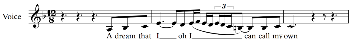
Figur 8, Christina Aguilera

Figur 7 blir melodin för frasen "a dream that I can call my own". Melodin är enkel och innehåller ingen svår rytmik heller. En variation till rytmik, tonalitet och fraserings kan ses i figur 8.