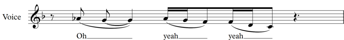
Figur 19 Beyoncé

Figur 18 och 19 visar hur fill in:s ser ut. Fill in:s är påfyllnings ord, som används mellan fraser eller mellan två ord. (Sjögren & Kullberg-Söderholm, 2009, s. 35).