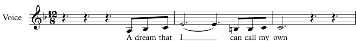
Figur 7, Etta James, melodi

Figur 6 är en mycket förenklad version på en fallande wail. Denna figur är ett exempel på hur wailen ser ut i teorin, men förblir sällan såhär simpel i praktiken. (Sjögren & Kullberg-Söderholm, 2009, s. 36)