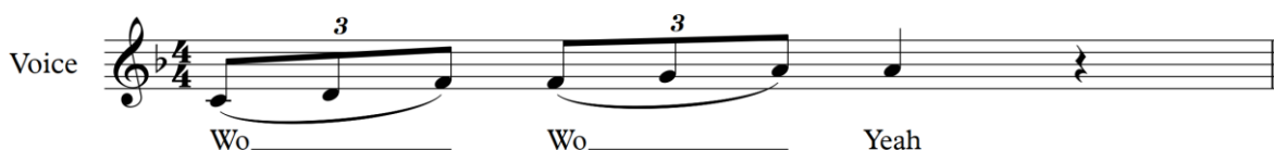
Figur 1 Stigande wail (Sjögren & Kullberg-Söderholm, 2009, s. 36)

Med en stigande wail menar man precis som namnet säger toner, som skall börja nerifrån och sjungas uppåt. Dessa toner behöver inte sjungas stegvis efter varandra utan kan också bestå av olika intervallhopp. Ju större hopp desto svårare är det att göra wailen. (Sjögren & Kullberg-Söderholm, 2009, s. 36). Se figur 1,3 och 5.