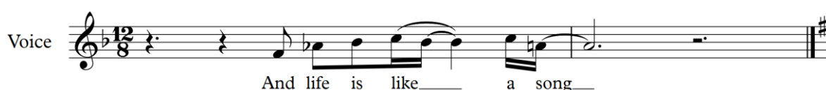
Figur 12, Etta James, melodi