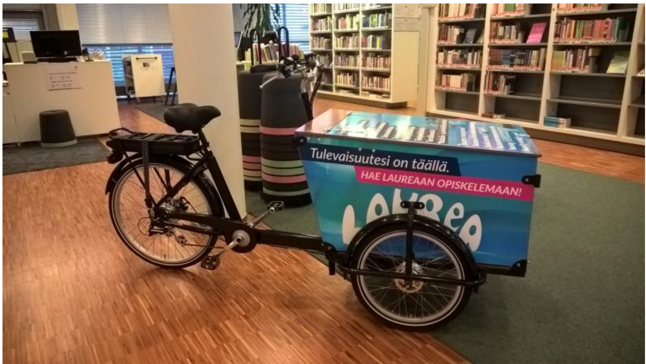
Laurean markkinoinnin kärryfillari on usein kirjastossa parkissa.