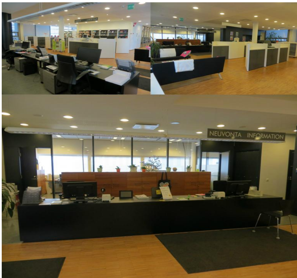
Tikkurilan kirjasto ennen remonttia.

Koko kirjastotilaa ei voitu remontoida kerralla. Päätettiin keskittyä kirjaston etuosaan, jossa sijaitsi perinteinen lainaustiski, raskaat lehtien säilytyskalusteet, lainausautomaatin ja tiedonhakupäätteiden massiiviset kalusteet. Tila oli tukossa ja värimaailma kylmää valkoista ja mustaa. Työn alle otettiin myös pieni opiskelijoiden ryhmätyötila ja tiedonhaunohjaushuone, joita kuvastaa parhaiten lempinimi ”Putka”. Muutostyö suoritettiin yhteistyössä kampuskirjaston henkilökunnan, suunnittelutoimisto Pentagon Designin ja organisaation tilavastaavien kanssa. Kirjaston toiveet muutoksen lähtökohdaksi kiteytyivät seuraaviin sanoihin: keveys, valoisuus, liikuteltavuus, esteettömyys, omatoimisuus ja yllätyksellisyys. Tilaan haluttiin luoda omat paikkansa asiakaspalvelulle, ohjaukselle, löhöilylle ja vapaalle toiminnalle.