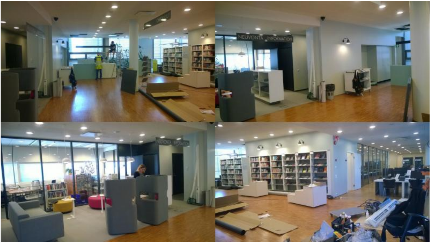
Kuvia remontin aikaisista tiloista

Kesälomalta palattiin keskelle kiivainta remonttia: kalusteita toimitettiin, sähköjä vedettiin, hälyportteja ja RFID-kalusteita asennettiin. Luovaa ongelmanratkaisua harrastettiin useaan otteeseen. Samana elokuisena aamuna, kun kirjasto aukesi, uusilta pinnoilta jynssättiin vielä mustia sormenjälkiä pois.