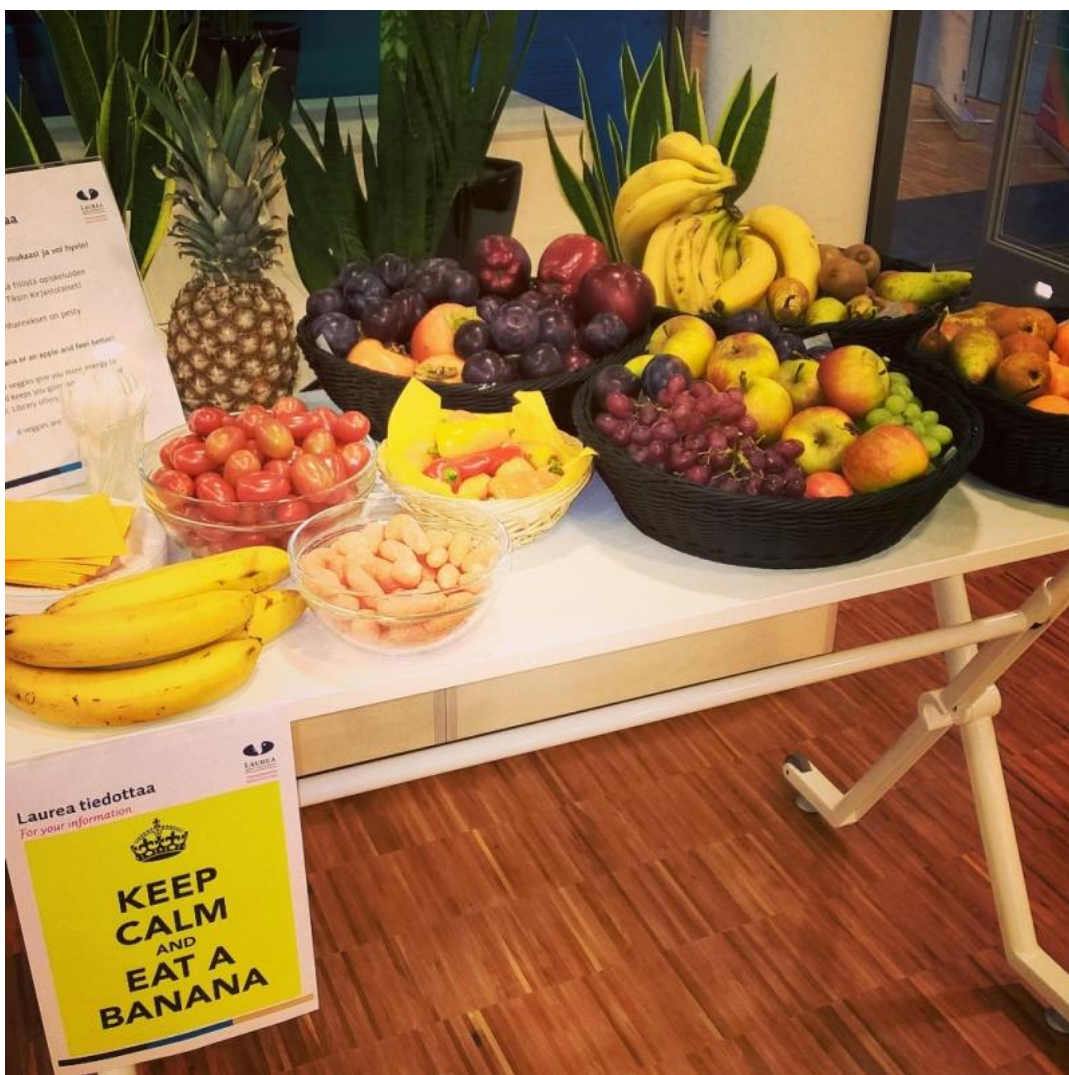
Fruit Fruit bomb –hedelmätapahtuma marraskuun pimeimpään aikaan.