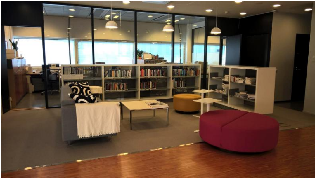
Lounge entisen asiakaspalvelutiskin tilalla.

aulatilan väljyyttä: "Miksi tässä ei ole... mitään?" Mutta löytyipä siihen vastauskin toiselta: "Tässähän voisi järjestää vaikka discon!" No niinpä – tyhjä tila täyttyy ideoilla.