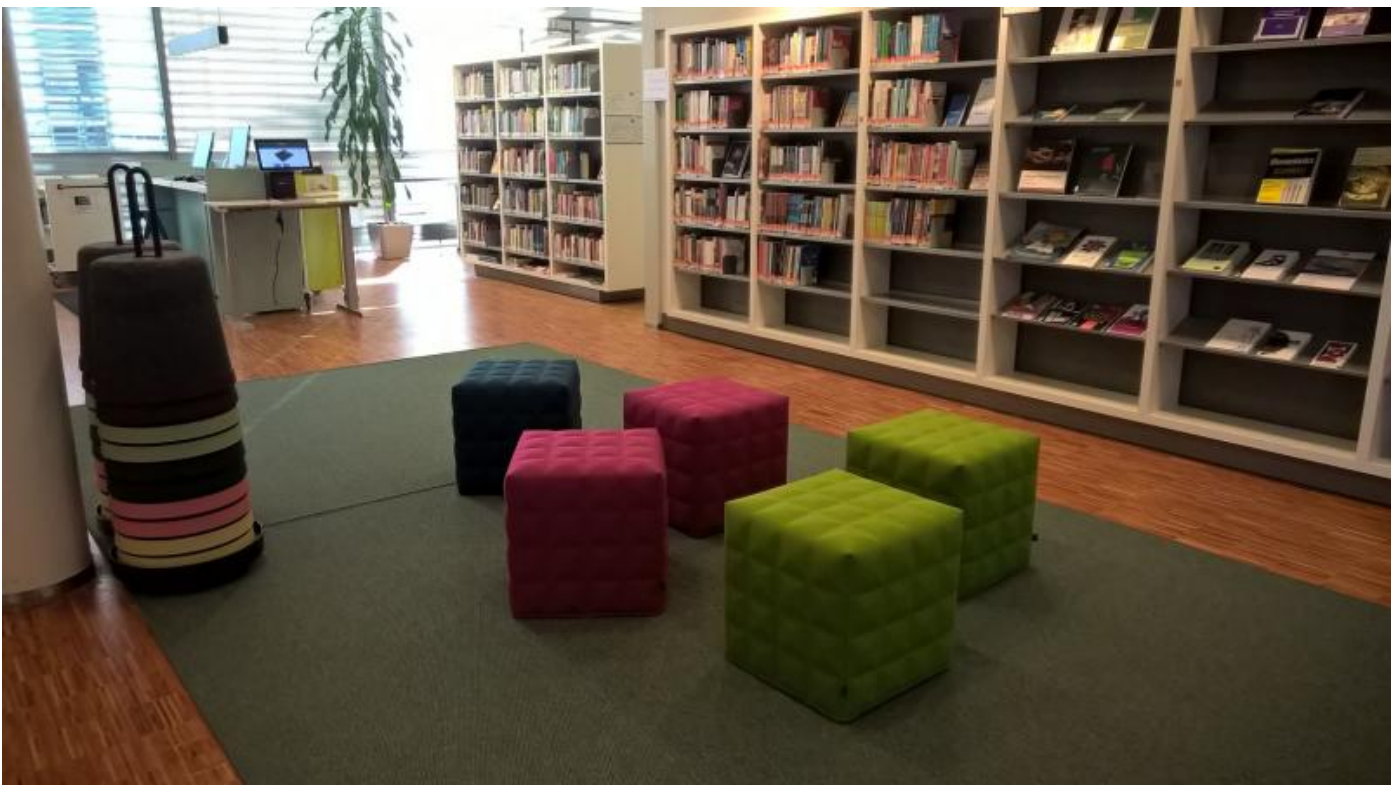
Remontin jälkeen tyhjäan tilaan tuotiin värikkäitä palleja.

Uudistuneessa kirjastotilassa neuvonta, lainaus ja tiedonhakupisteet siirrettiin oven läheisyydestä suoraan aulan vastakkaiselle puolelle niin, että katsekontakti syntyy heti kun asiakas astuu sisään. Lainauskalusteet täydentyivät palautusautomaatilla. Vanhan asiakaspalvelutiskin paikalle rakennettiin Lounge-tila sohvineen, raheineen ja kirjahyllyineen. Hyllyt täyttyivät pikkuhiljaa kaunokirjallisuudella, toisesta kampuskirjastosta siirtyneillä matkaoppailla ja lehdillä. Lounge-tila toimii löhöilytilan lisäksi odotustilana opiskelijoille, jotka asioivat samassa tilassa työskentelevien erityisopettajan tai opintopäällikön kanssa.