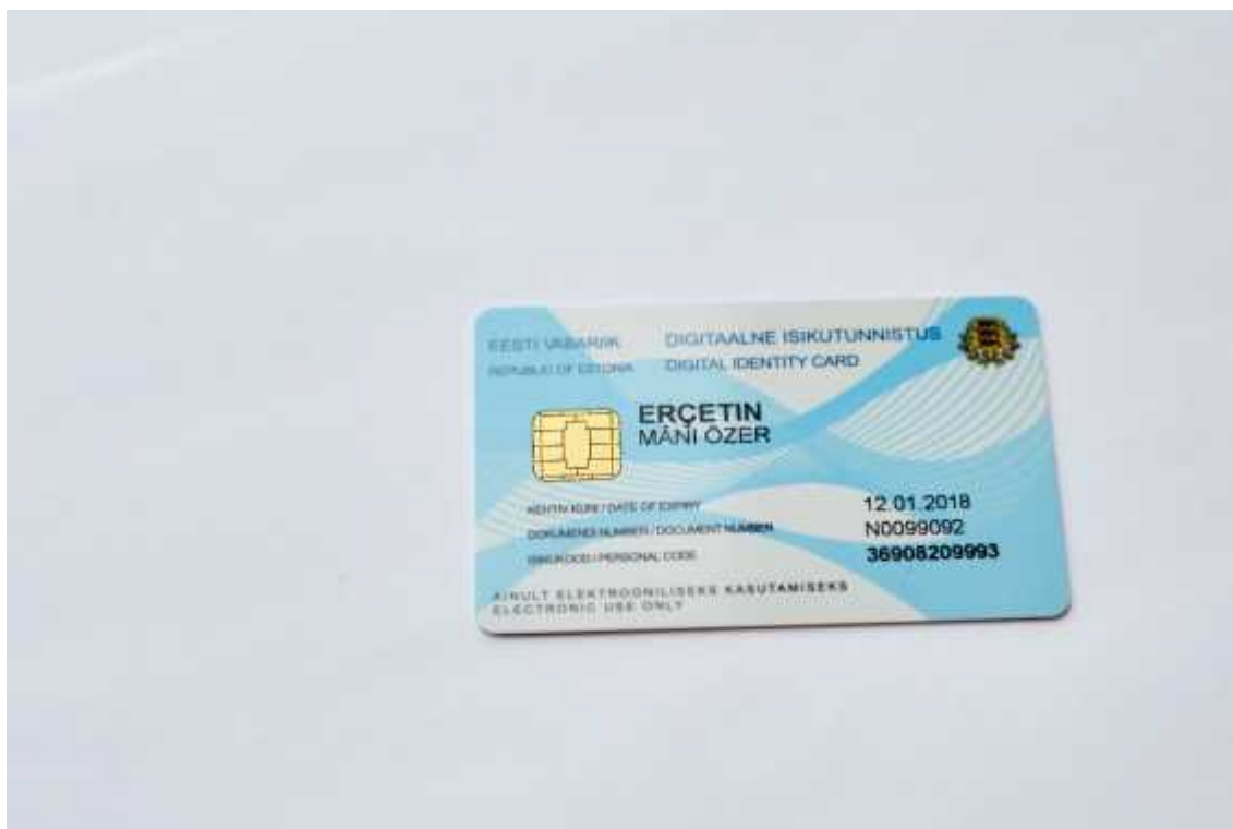
Kuva 1: E-residentin digi-ID -kortti.