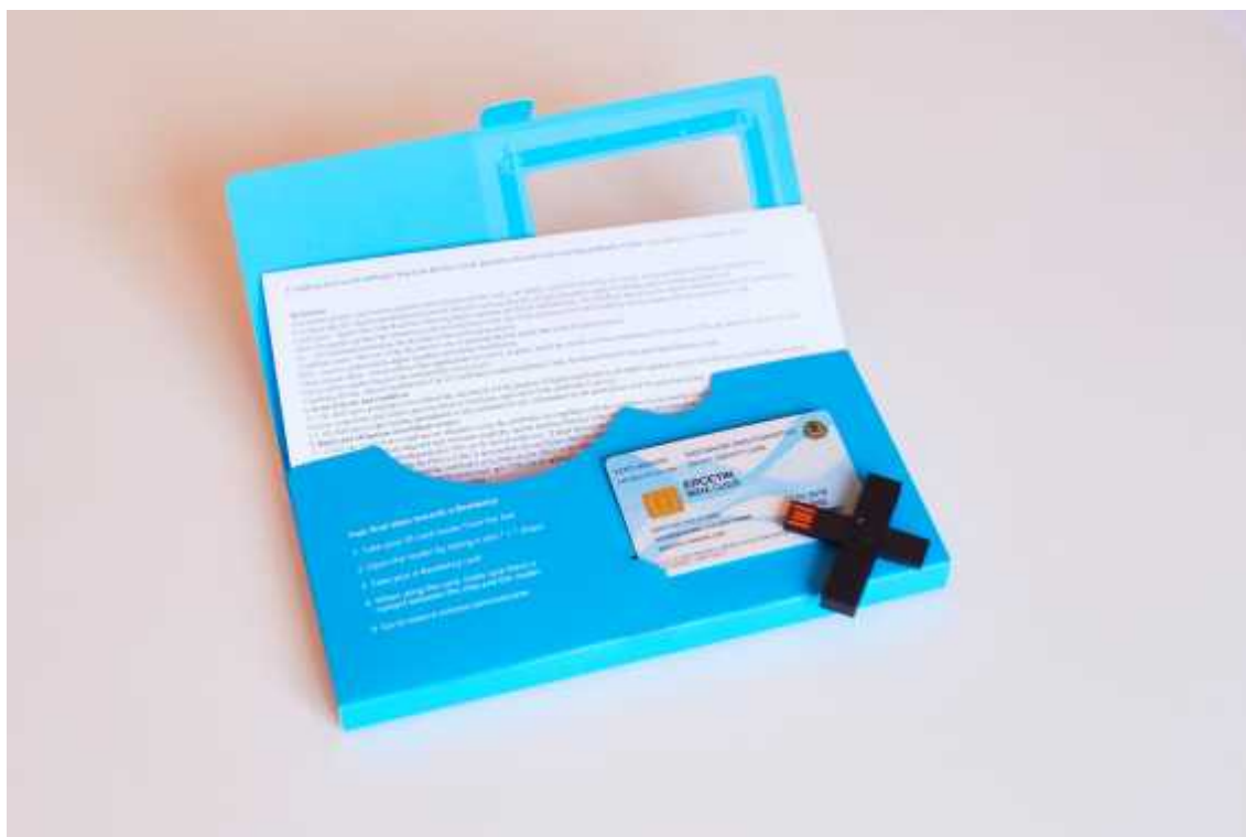
Kuva 2: E-residentin paketin sisältö