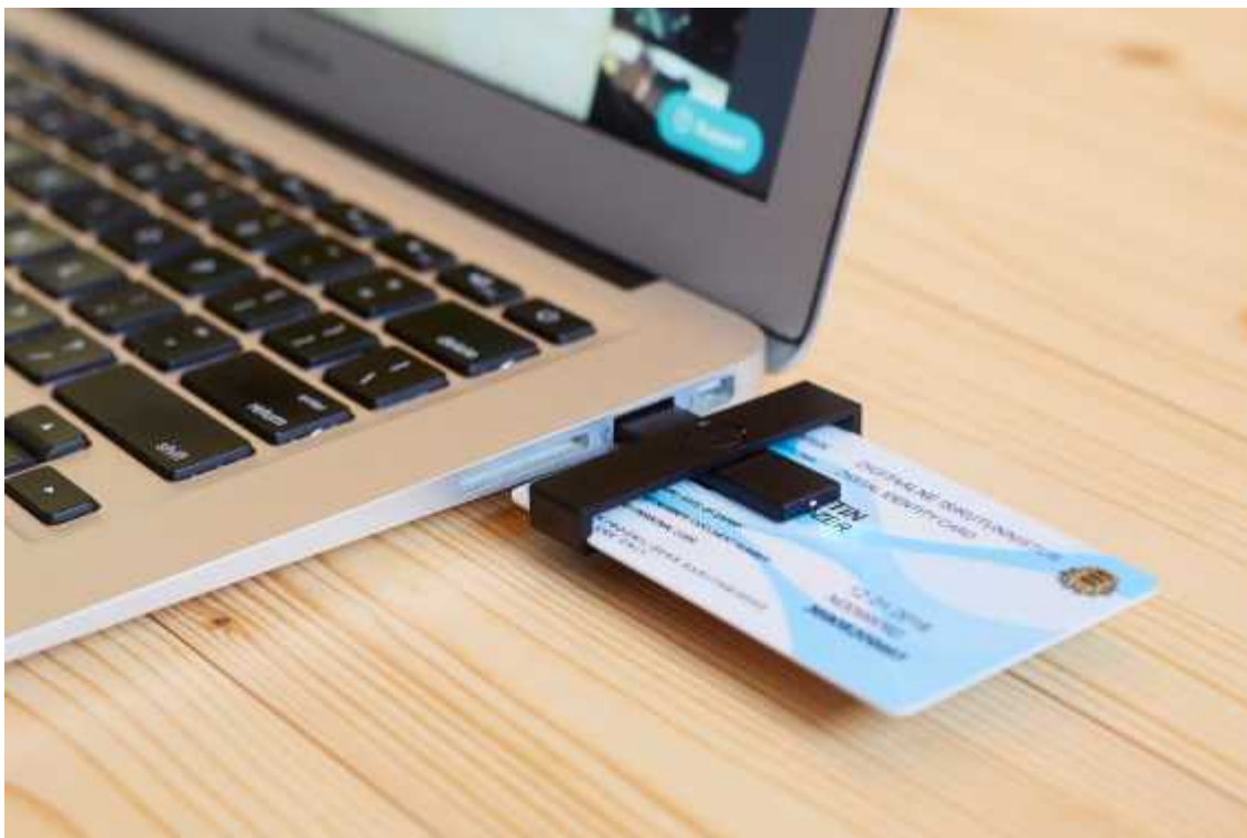
Kuva 3: E-residentin digi-ID -kortin kortinlukijan käyttö