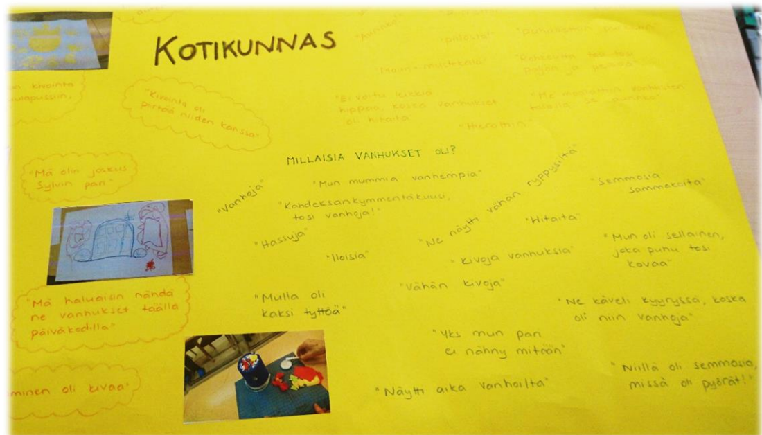
Kuva 4. Ajatuskartta.

Lasten kanssa koetut keskustelut sekä ajatuskartan kokoaminen heidän kanssaan toivat ilmi paljon sitä, mitä lapset haluaisivat tehdä ikäihmisten kanssa. Käsittelin tätä teemaa jo ennen tuokioita lasten kanssa, jonka perusteella muokkasinkin tuokioiden sisältöä vielä enemmän heidän toiveidensa mukaiseksi. Piirtäminen ja etenkin ikäihmisille piirtäminen koettiin mieluisena monen lapsen kohdalla. He kokivat myös mieluisaksi sen, miten ikäihmiset olivat kehuneet heitä ja heidän erilaisia taitojaan, kuten piirustustaitoja, askartelutaitoja ja käyttäytymistään.