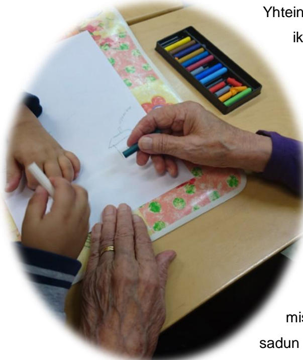
Kuva 2. Ikäihmisen ja lapsen yhteinen piirustus

toteutin tämän niin, että luin sadun, jonka olin itse tuokiokokonaisuuden teemaan liittyen kirjoittanut, ja lapset ikäihminen parinaan saivat kuuntelemisen jälkeen kuvittaa sen haluamallaan tavalla.