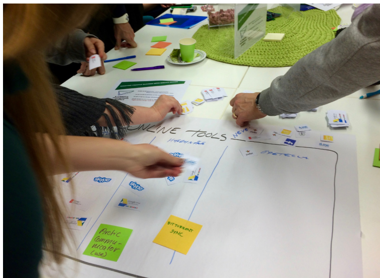
Kuva 4. Yhteissuunnittelu on osallistavaa monin eri tavoin.

aikana. Minkälainen on heidän kiinnostuksensa löytää aikaa työprosessiin vai antavatko he mieluummin opiskelijoille vapauden työstää toimeksiantoa ilman suurempaa omaa panosta?