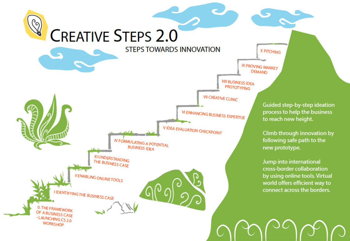
Kuva 1. Creative Steps 2.0 innovaatioprosessi etenee 10+1 portaan kautta kohti pitsausta.

välille yhteisen toiminnan piirin, jonka kautta tuotetaan hyötyä molemmille yrityksille ja mahdollistetaan kansainvälinen verkostoituminen yrityksille ja opiskelijoille.