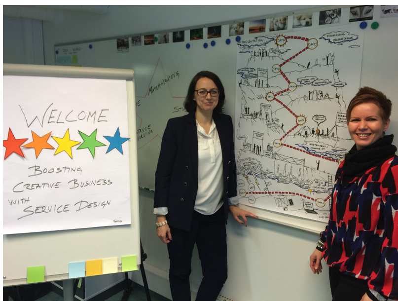
Kuva 2. Yhteissuunnittelutyöpajassa yrittäjien näkökulmat saatiin esille viiden tähden menetelmän avulla.

Palvelutuotanto on keino kehittää sisältöä paremmaksi asiakkaan tarpeita vastaavaksi palveluksi. Yhteissuunnittelu on nopean kehittämisen muoto, jossa asiakas osallistetaan mukaan palvelun kehittämiseen hyödyntämällä luovia käyttäjakeskeisiä suunnittelumenetelmiä (Vaajakallio & Mattelmäki, 2011, 79). Yhteissuunnittelun kautta asiakkaan näkökulmat tulevat esille, jolloin ne voidaan huomioida palvelun muotoilussa. Creative Steps 2.0-malli on palvelutuote, joka innovaatiotyöpajan muodossa tarjoaa yrityksille kehittämissympäristön ja yhteisen kansainvälisen kohtaamispaikan.