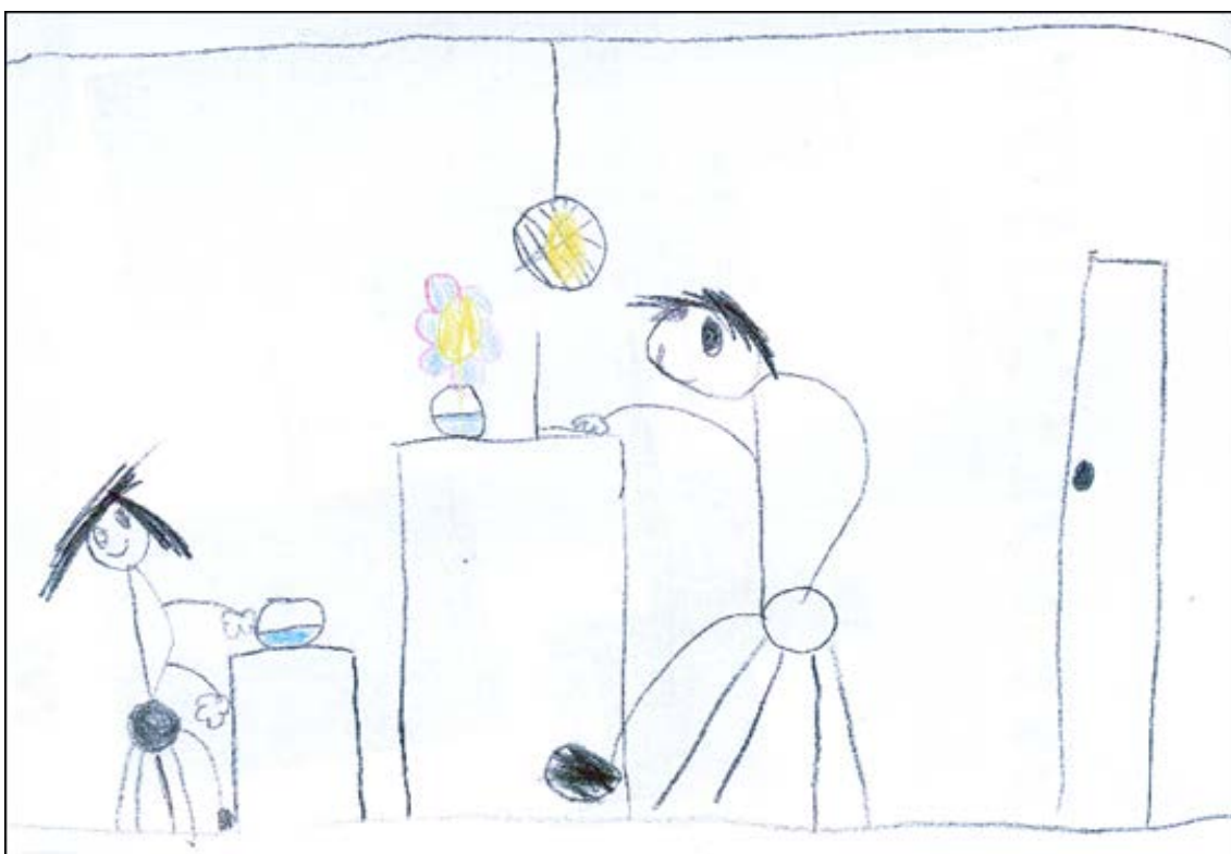
Kuva 5. Lapsen piirustus 1

Erään lapsen piirustuksessa (Kuva 5.) hänen vanhempansa oli tekemässä töitä työhuoneessa, ja lapsi itse istui vieressä “katsomassa ipadissa jotain ohjelmaa, vaikka pikku kakkosta” (H2).