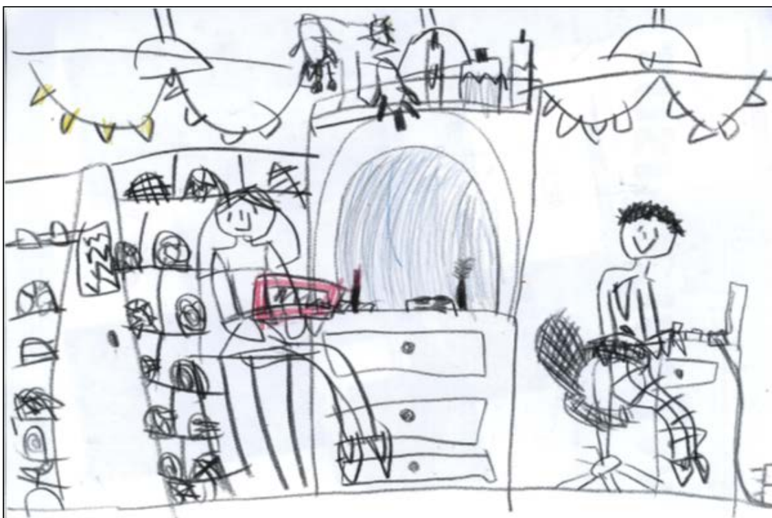
Kuva 6. Lapsen piirustus 2

Eräs lapsista piirsi (Kuva 6.) itsensä ja isänsä työhuoneeseen: isä istui tietokoneellaan ja lapsella oli vieressään omat touhut oman pienen pöytänsä ääressä. “Mä aion silleen tehdä mut tuolille tonne pöytään sitten tohon... tai siis johonkin penkkiin mis mä katon jotain ipadia” (H2).