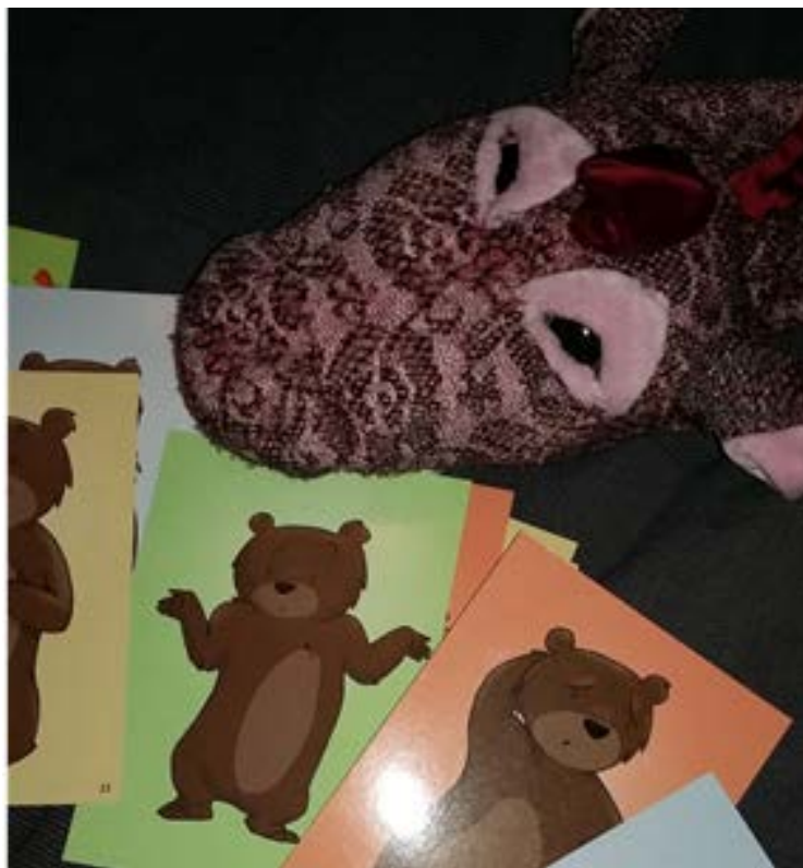
Kuva 3. Nallekortit sekä lohikäärme-käsinukke

Tuokion lopuksi muutamat lapset halusivat antaa meille piirustuksensa ja myöhemmin pyysimme heidän vanhemmiltaan lupaa näiden julkaisuun. Pyysimme lapsilta palautetta haastattelusta ilmeitä ja tunteita kuvaavia Nallekortteja (ks. Kuva 3.) käyttäen. Lapset valitsivat muun muassa kortteja, joiden he kuvasivat tarkoittavan mukavia, hauskoja, outoja ja tylsiä tunteita. Molemmat haastattelut kestivät noin 45 minuuttia sisältäen alkuleikin ja palautteen antamisen.