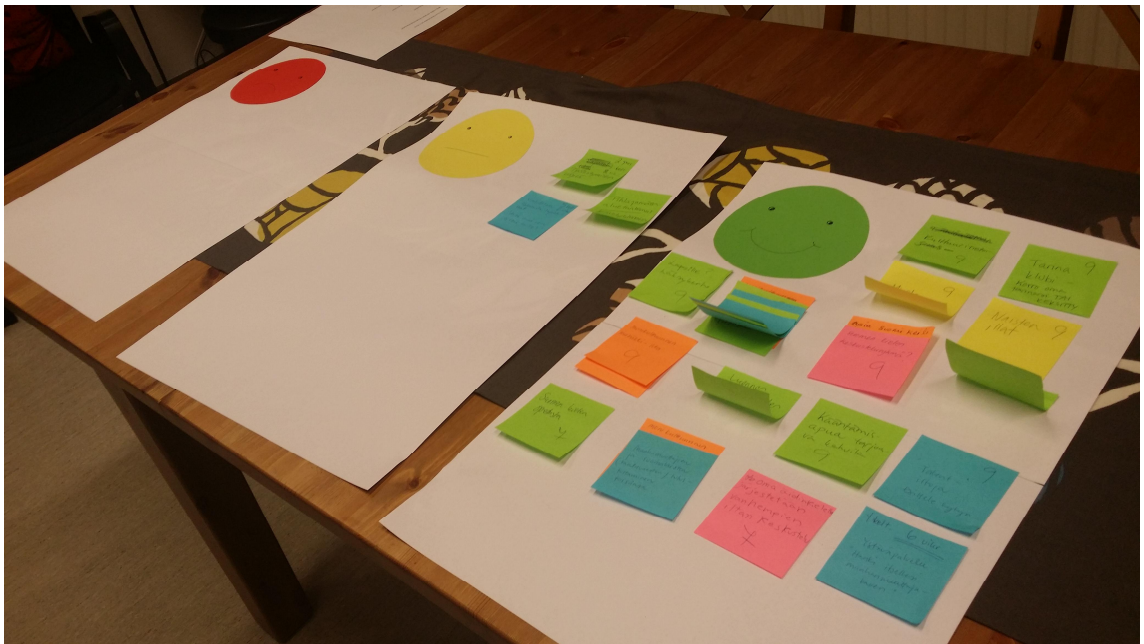
Kuvio 5. Ideat luokiteltiin liikennevalotyöskentelyn avulla (Oksa 2016).

Innostajista toinen ohjeisti osallistujille liikennevalotyöskentelyn periaatteet, kun toinen taas jakoi osallistujille työskentelyssä tarvittavat materiaalit yhdessä yhteisöpedagogiopiskelijan kanssa, kuten olimme ennalta sopineet. Osallistujille jaettiin vihreä (kannatan, haluan toteuttaa), keltainen (idea epäselvä) ja punainen (en kannata, en halua toteuttaa) pahvilappu. Edellisellä kerralla tuotetut, post-it-lapuilla olevat ideat käytiin siis läpi yksitellen, ja niiden kohdalla jokainen osallistuja ilmaisi mielipiteensä nostamalla oikean värisen lapun ilmaan. Yksi osallistuja joutui lähtemään liikennevalotyöskentelyn aikana.