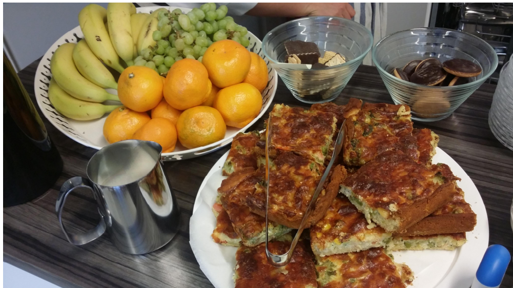
Kuvio 6. Tarjoiluista nautittiin jokaisessa työpajassa (Oksa 2016).

Kolmas työpaja järjestettiin 31.5. klo 17.30–19.30. Työpajan aluksi näytimme asukastalon tietokoneilla osallistujille tekemämme muistion ja perustamamme Facebook-ryhmän. Suunnittelutyöskentelyn tuottamasta aineistosta eli muistiosta sovittiin, että se on kaikkien osallistujien yhteinen ja vapaa myös muokattavaksi. Yksi osallistuja kiitteli muistion jakamista Facebook-ryhmässä, koska lukemalla muistion hän pääsi mukaan työskentelyyn, vaikka oli ollut pois edelliseltä kerralta. Kävimme läpi muistion yhdessä osallistujien kanssa ja yhdessä huomasimme, että ruoka painottui ja oli tullut esiin monen eri osallistujan ideoinnissa. Muistion läpikäymisen jälkeen siirryimme pöydän ääreen.