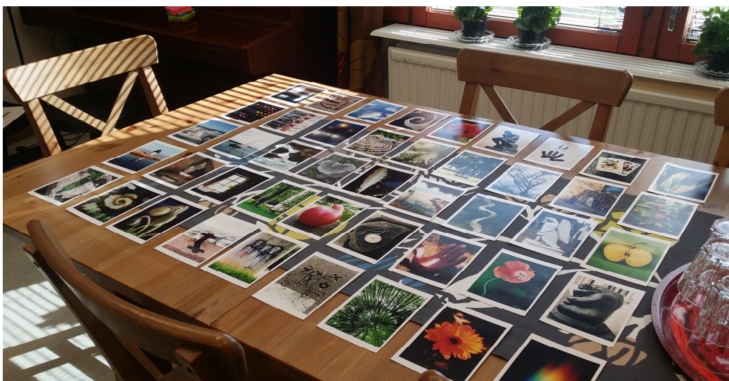
Kuvio 1. SpectroVisions –kuvakortit asukastalon pöydän päälle aseteltuina (Oksa 2016).

Ensimmäisen suunnittelutyöpajan tavoitteena oli tutustuttaa osallistujia toisiinsa ja aloittaa ideointi monikulttuurisen kahvilatoiminnan sisällöiksi. Ensimmäinen suunnittelutyöpaja jakautui kolmeen vaiheeseen: 1) tutustumiseen, 2) ideointityöskentelyyn ja 3) ideoiden purkuun ja palautteen antamiseen työpajasta. Ensimmäisessä työpajassa osallistujat tuottivat ideoita monikulttuurisen toiminnan sisällöiksi. Ideat käytiin läpi purkamalla ne yksitellen tapaamisen lopuksi.