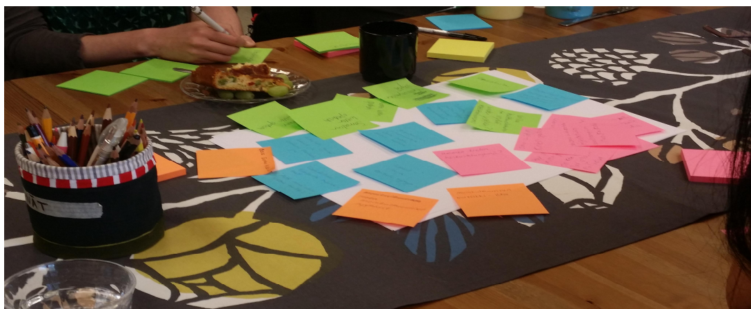
Kuvio 3. Järjestösatanen –ideointi käynnissä asukastalolla (Oksa 2016)

Esittelyvuoroon päästyämme kerroimme, että työpajat osa opinnäytetyötämme ja että niistä tehdään kirjallinen raportti. Selvensimme osallistujille, että työpajoihin osallistumi- nen on anonymia eli osallistujat eivät ole tunnistettavissa opinnäytetyöhön kuuluvasta kirjallisesta raportoinnista, ja että työpajoihin osallistuminen perustuu vapaaehtoisuu- teen. Kerroimme myös, että keräämme palautetta työpajoista. Yksi osallistuja joutui tässä vaiheessa lähtemään muun menonsa vuoksi, mutta ilmoitti tulevansa taas seuraavalla kerralla. Opinnäytetyöprosessi ei aiheuttanut osallistujissa juurikaan kysymyksiä.