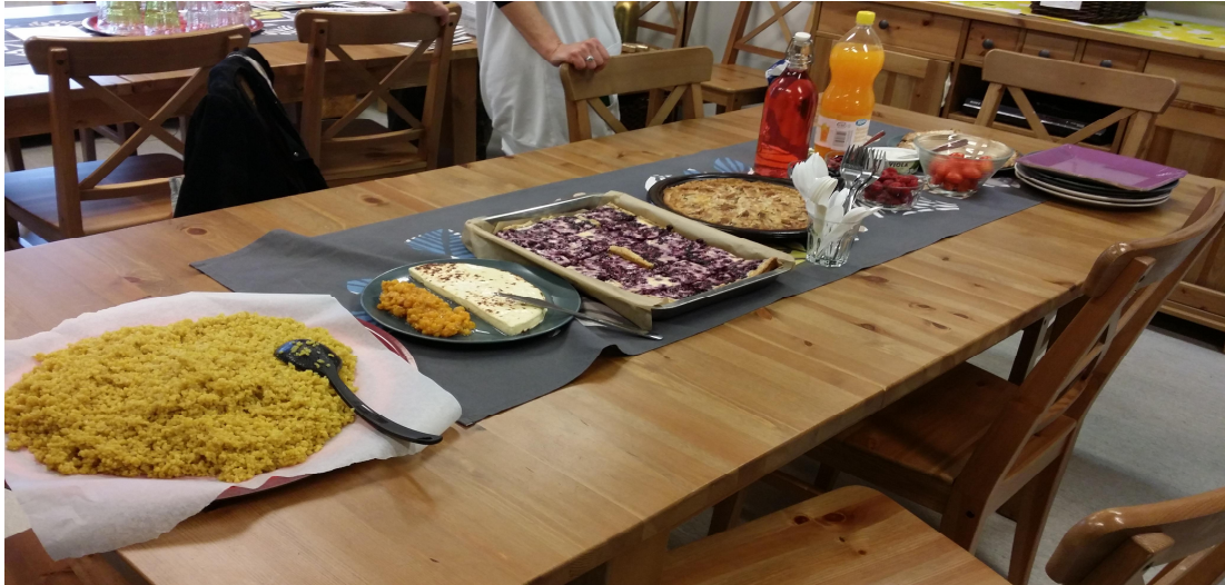
Kuvio 7. Jokainen osallistuja toi ruokaa monikulttuurisiin nyyttäreihin (Oksa 2016).

Tunnelma nyyttäreissä oli rento, ja jokainen osallistuja toi jotain ruokaa mukanaan jaettavaksi. Sosiokulttuurisen innostamisen mukaisesti viimeisellä tapaamisella oli juhlan tunnelmaa (Kurki 2000: 149), mitä kuvaa se, että nyyttäreihin osallistujat halusivat ottaa valokuvia. Yksi osallistujista valmisti tarjottavan ruoan paikan päällä. Monikulttuuristen nyyttäreiden osallistujilta emme enää keränneet palautetta. Osallistujat innostuivat kuitenkin pohtimaan tarjoiluiden ääressä monikulttuurisen toiminnan jatkoa asukastalolla. Diakonissa kertoi kirkon monikulttuurisesta työstä ja vapaaehtoisista henkilöistä, jotka mahdollisesti voisivat olla kiinnostuneita osallistumaan monikulttuurisen toimintaan asukastalolla. Kerroimme yhteydestä Helsingin kaupunginkanslian alaisen Kohtaamiskahvila-hankkeen koordinaattoreihin ja tulevasta tapaamisesta heidän kanssaan. Irakilais-taustainen henkilö toivoi meiltä suunnittelutyöpajojen tuloksien (Liite 3) jakamista tulevassa yhteistyötapaamisessa Kohtaamiskahvilan koordinaattoreiden kanssa. Havaintojemme mukaan monikulttuuristen nyyttäreiden osallistujien välisessä yhteisessä reflektoinnissa korostui monikulttuurisen toiminnan jatkamisen toive.