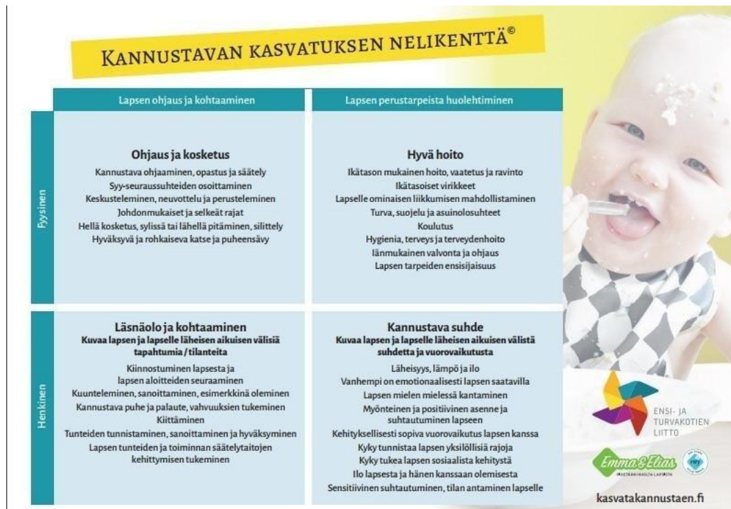
Kuva 3. Kannustavan kasvatuksen nelikenttä (Ensi- ja turvakotien liitto 2017).

opettaa ja suojella lasta, kunnes lapsi on tarpeeksi kypsä ottamaan vastuun omasta käyttäytymisestään ja teoistaan. Kuriin ei liity pelkoa, vaan päinvastoin on järjestystä ja turvallisuutta. Samalla kun kuri rajoittaa negatiivisia tekoja, se kasvattaa lasta ja lapsi oppii sitä kautta tuntemaan itseään. Kurinpidossa ei saa koskea lapseen, mutta valtaa saa käyttää sanoin, katsein, elein ja äänenpainoin. Ristiriitatilanteissa tärkeintä on oikeudenmukaisuus. Aikuisen pitää nähdä oma kurinpitonsa laaja-alaisena ja pitää osata ennakoita. (Sihvola 2002, 145-147; Mackonochie 2006, 40.)