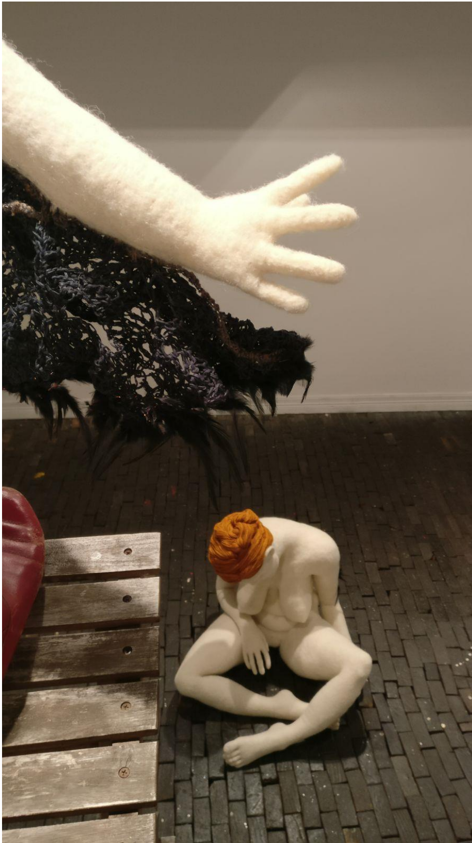
Kuva 6: Itse ja Ihtiriekkö, 2017, kuva: Pasi Lehtikoinen