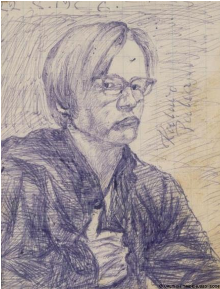
Kuva 3: Kalervo Palsa, Omakuva; nuoruuden työ, 1966

Maisema ja omakuva -tutkielmassa Jyrki Siukonen mainitsee omakuvan kuvataiteen genreistä itseriittoisimpana siitä syystä, ettei se vaadi yleisöä (Siukonen 2009, 53.) Omakuvaa on käytetty myös terapian ja voimautumisen keinona. Tuotettaessa omakuvaa tällaisilla menetelmillä, voimme nähdä, että omakuvan merkitys tekijälle itselleen ei menetä voimaansa, vaikka terapeutti(ohjaaja) olisikin kuullut yksilön oivalluksen jo monesta suusta.”Muotokuvan dynamiikka rakentuu juuri äärimmäisen konventionaalisuuden ja äärimmäisen koskettavuuden väliselle jännitteelle.” (Palin 2009, 13.)