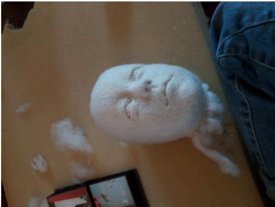
Kuvat 9 & 10: Tekoprosessi, 2016

Nimi Itse ja Ihtiriekkö rakentuu useiden itselleni merkityksellisten yhteyksien ympärille. Nimeämisprosessi alkoi sanasta sielulintu, jonka olin joskus vuosia sitten kuullut joltakulta. Törmäsin ihtiriekkö-sanaan tätä kautta ja se viehätti minua jo ennen kuin tiesin sanan merkityksen. Ihtiriekkö tarkoittaa surmatun lapsen sielua, joka ei saa rauhaa ja palaa siksi kummittelemaan. (Haavio & Harva 1992, 222).