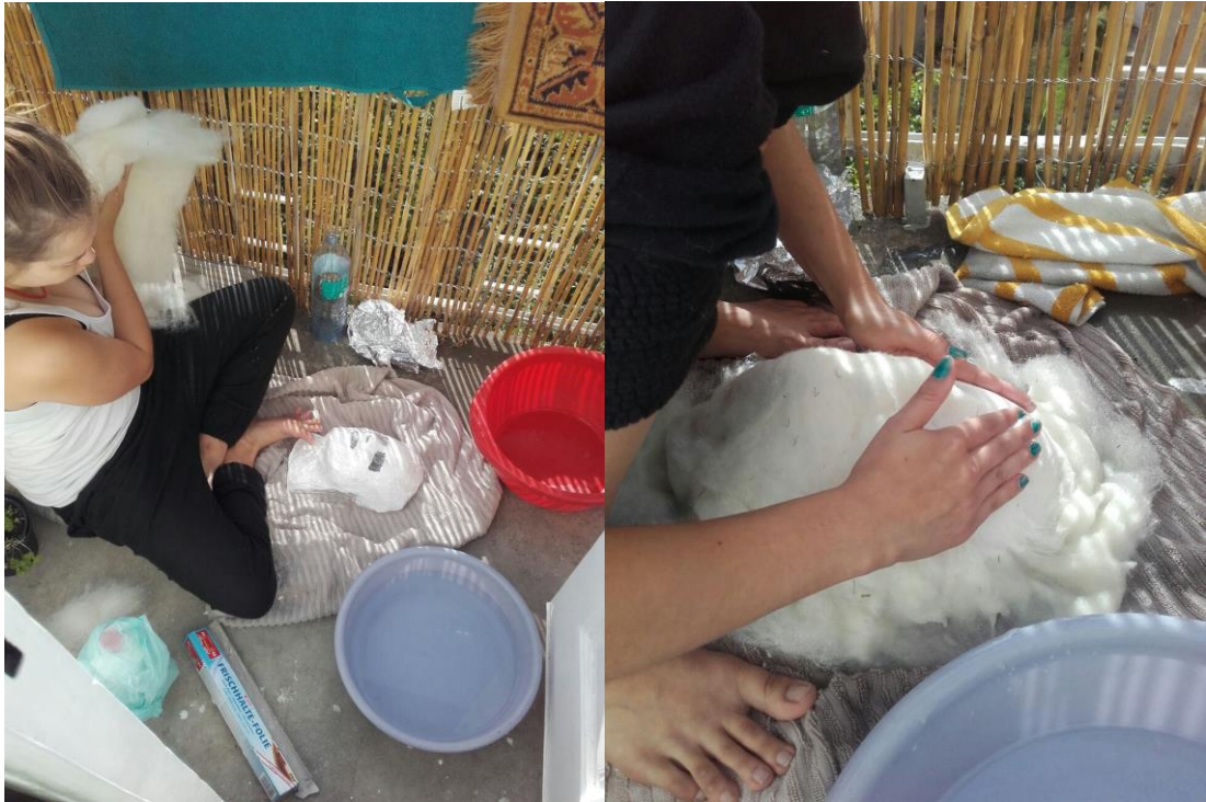
Kuvat 7 & 8: Tekoprosessi, 2016, kuvat: Benjamin Pankesegger

Itse ja Ihtiriekk on installaatio, joka koostuu kahdesta neulalla huovutetusta ihmishahmosta. Aloin harjoitella huovuttamista jo ensimmäisenä opiskeluvuoteni ja olen siitä asti kehittänyt tekniikkaani. Minulle oli tärkeää tehdä myös lopputyöni huovuttamalla, sillä haluan näyttää itselleni, mihin neljä vuotta tekniikkani opettelua on minut tuonut.