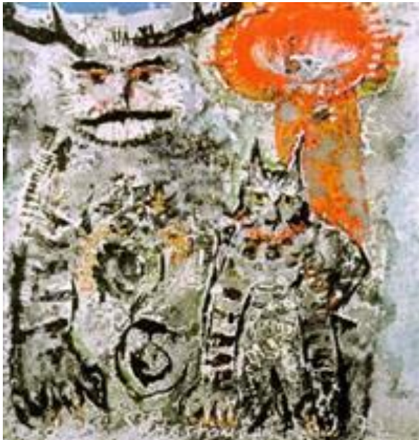
Kuva 5: Reidar Särestöniemi, Omakuva ja Ilves, 1972

Vuonna 1973 julkaistussa dokumentissa Luonnon kuviot , (Eeli Aalto, Suomi, 1973, Elävä arkisto) Reidar Särestöniemi valottaa eläinaiheidensa taustaa. Muiden perheenjäsenten suorittaessa Särestön tilan töitä agraariperheen nuorimmaksi syntynyt Reidar joutui usein tulemaan yksin toimeen ollessaan vielä liian pieni työntekoon. Leikkitoveriksi jäivät Särestön tilan kissat, koirat, hevoset sekä pässi. Särestöniemi ei omien sanojensa mukaan oppinut samaistamaan itseään ihmisiin, vaan mieluummin karhuun, ilvekseen tai riekkoon. Joissakin omakuvissaan Reidar esiintyy sarvipäisenä ihmishahmona.