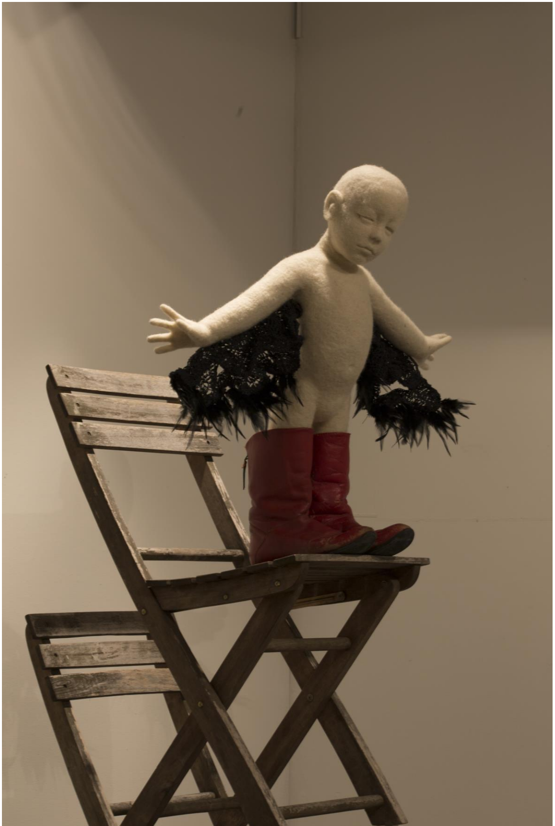
Kuva 11: Itse ja Ihtiriekkö , 2017

Minun Itse ja Ihtiriekköni symboloi intoa ja ihmettelyn taitoa, niitä asioita, joita ilman en voi luoda, joita ilman tekemiseni kadottaa merkityksensä.