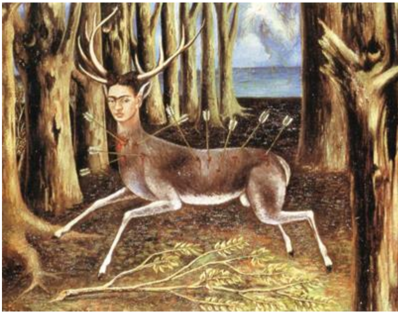
Kuva 4: Frida Kahlo, The Wounded deer , 1946

Kahlon kuvaamat eläinhahmot liittyvät Azteekkien käsitykseen nahualista (nahual), jolla tarkoitetaan toteemieläintä (spirit animal, animal alter ego). Sana nahual kääntyy espanjasta englanniksi myös tarkoittamaan sanaa double eli kaksois- tai kaksoisolento. (M.Lowe 1995, 268.)