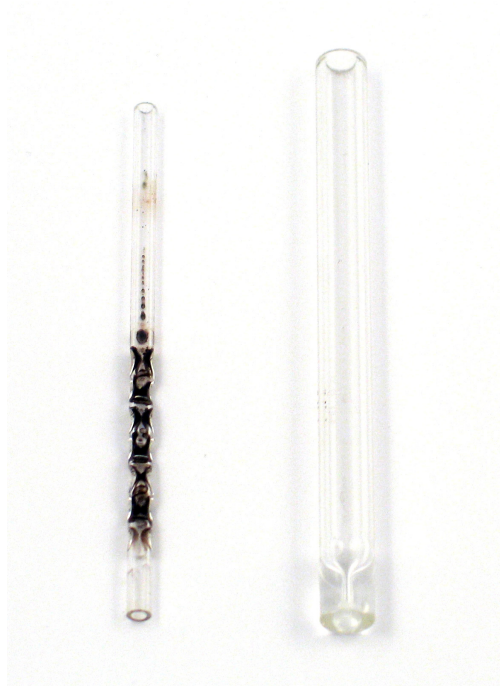
Kuva 3. Vasemmalla käytetty PTV-injektorin bufflet-injektioilasi ja oikealla splitless-injektioinnissa käytetty injektioilasi.

Koska injektioilasin ( liner ) lämpötilaa pitää pystyä nostamaan ja laskemaan nopeasti lyhyessä ajassa, on PTV-injektorin injektioilasi huomattavasti pienempi (150 - 250 µl) kuin tavanomaisesti split/splitless -tekniikassa käytetyt injektioilasit (1000 µl). Näytteet likaavat pienemmän injektioilasin nopeammin, mikä heikentää laitteen suorituskykyä ja tihentää injektioilasin vaihtoväliä. Kuvassa 3 nähdään käytössä olleet PTV-injektorin ja splitless -injektorin injektioilasit. Kuvassa näkyy bufflet-injektioilasiin kertynyt musta lika. Splitless -injektioinnissa käytetty injektioilasi on kirkas.