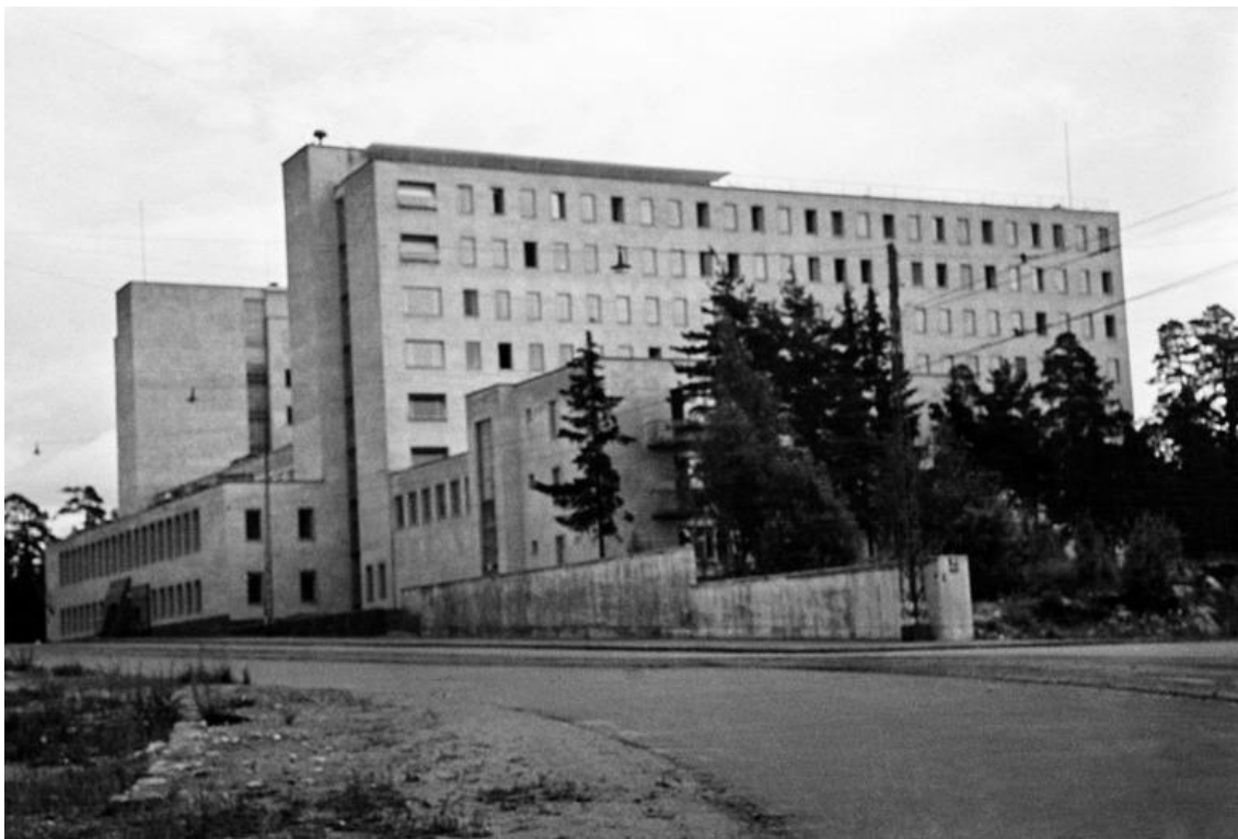
Kuvio 9. Helsingin Sairaanhoidajaopisto (Kannisto, Väinö 1942. Helsingin kaupunginmuseo).

Oheinen kuva (kuvio 9) on otettu Tukholmankatu 10 rakennuksesta B-siiven puolelta.