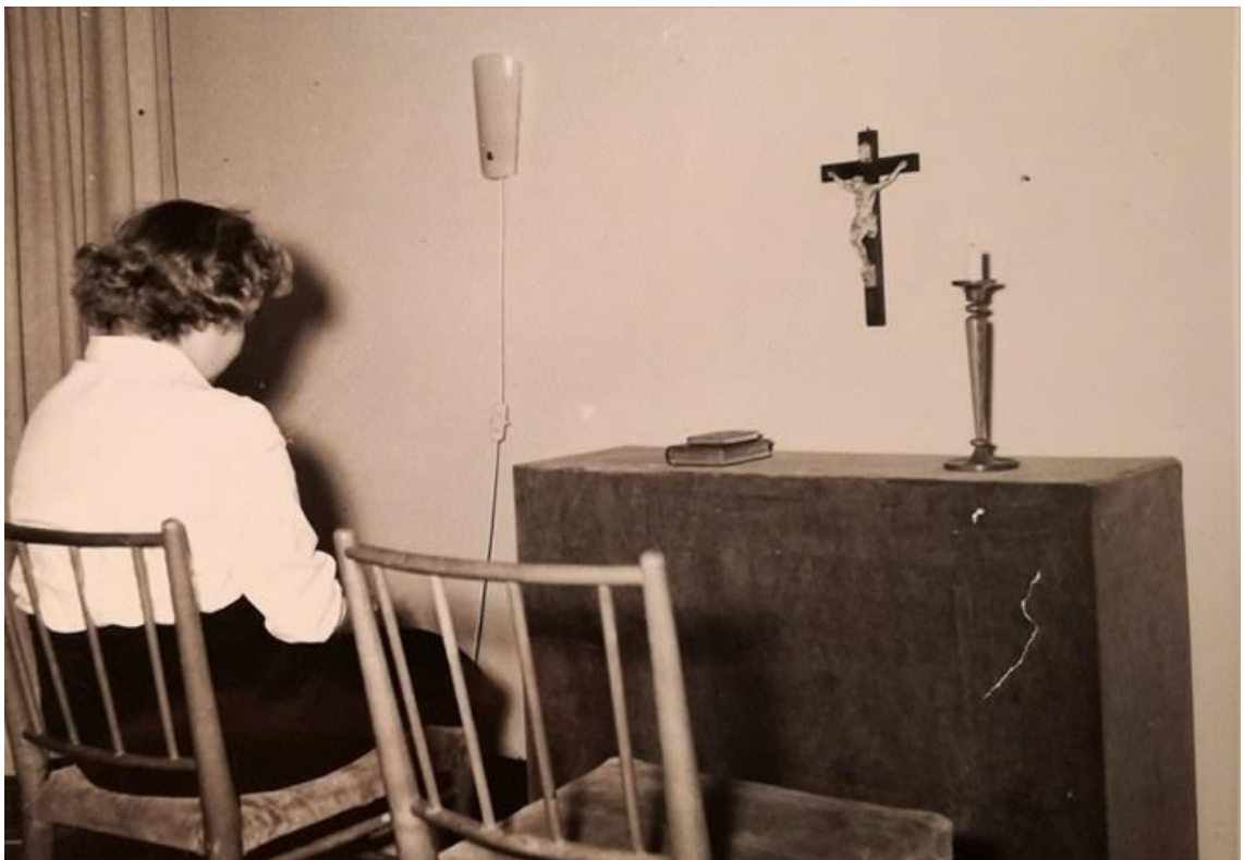
Kuvio 18. Hiljainen huone opiskelijoille (Hoitotyön koulutuksen museo. Rehtorin huone).

Oheisessa kuvassa (kuvio 18) on opiskelija hiljentymässä rakennuksen hiljaisessa huoneessa. Kuva on Hoitotyön koulutuksen museosta.