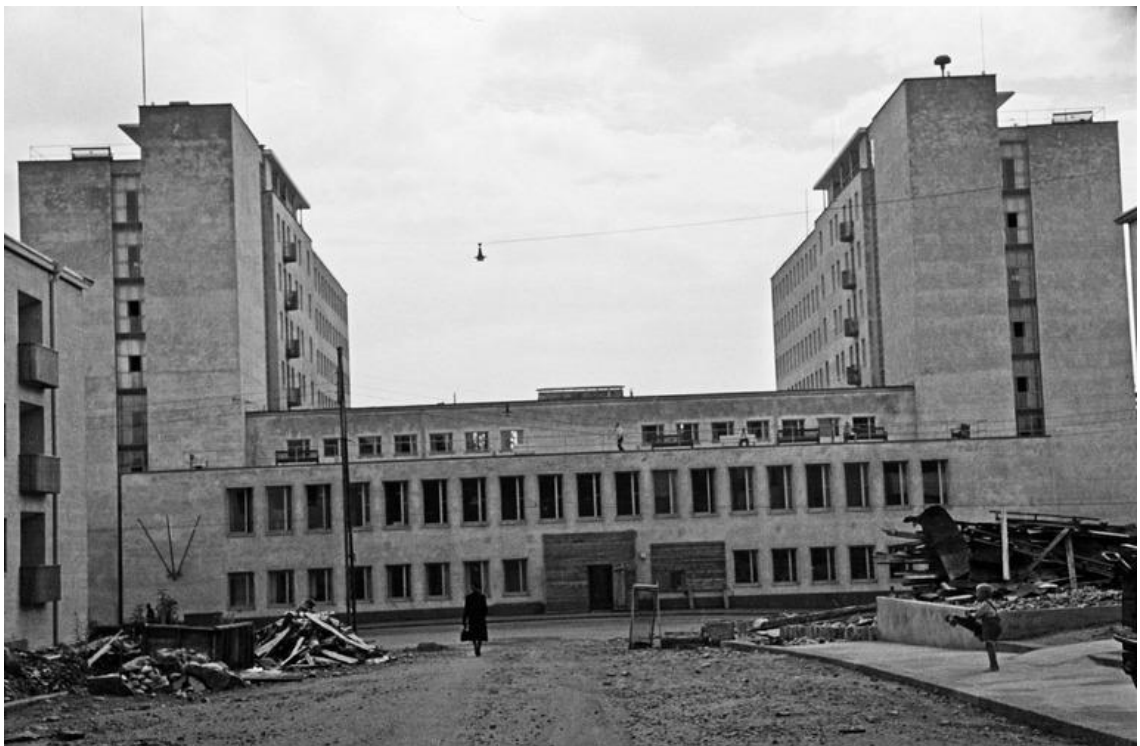
Kuvio 8. Helsingin Sairaanhoidajaopisto vuonna 1942.

Oheinen kuva (kuvio 8) on otettu Tukholmankatu 10:stä ulkoa pääovien puolelta.