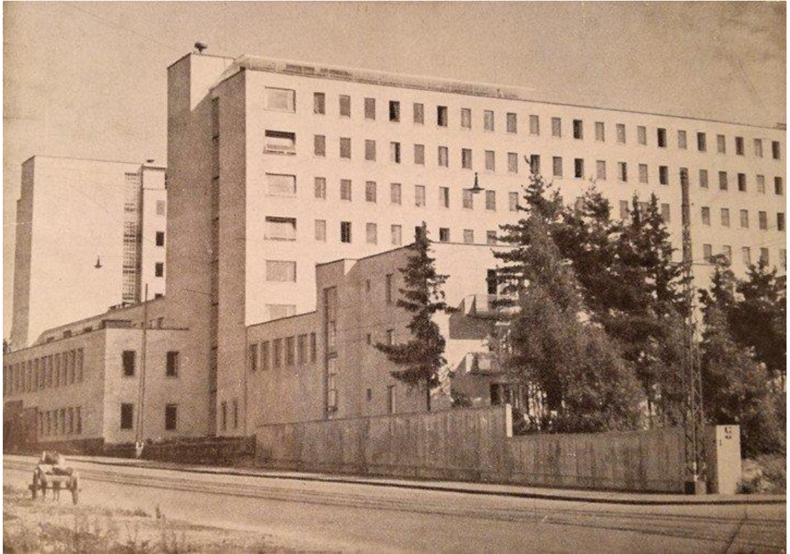
Kuvio 13. Tukholmankatu 10 1950-luvulla (Hoitotyön koulutuksen museo. Rehtorin huone).