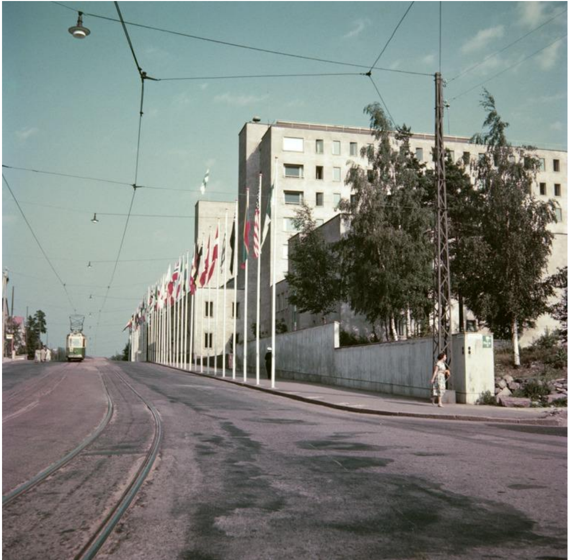
Kuvio 14. Helsingin olympialaiset 1952.

Oheisessa kuvassa (kuvio 14) näkyy eri osallistujamaiden lippuja liehumassa lipputangossa Tukholmankatu 10:n edessä.