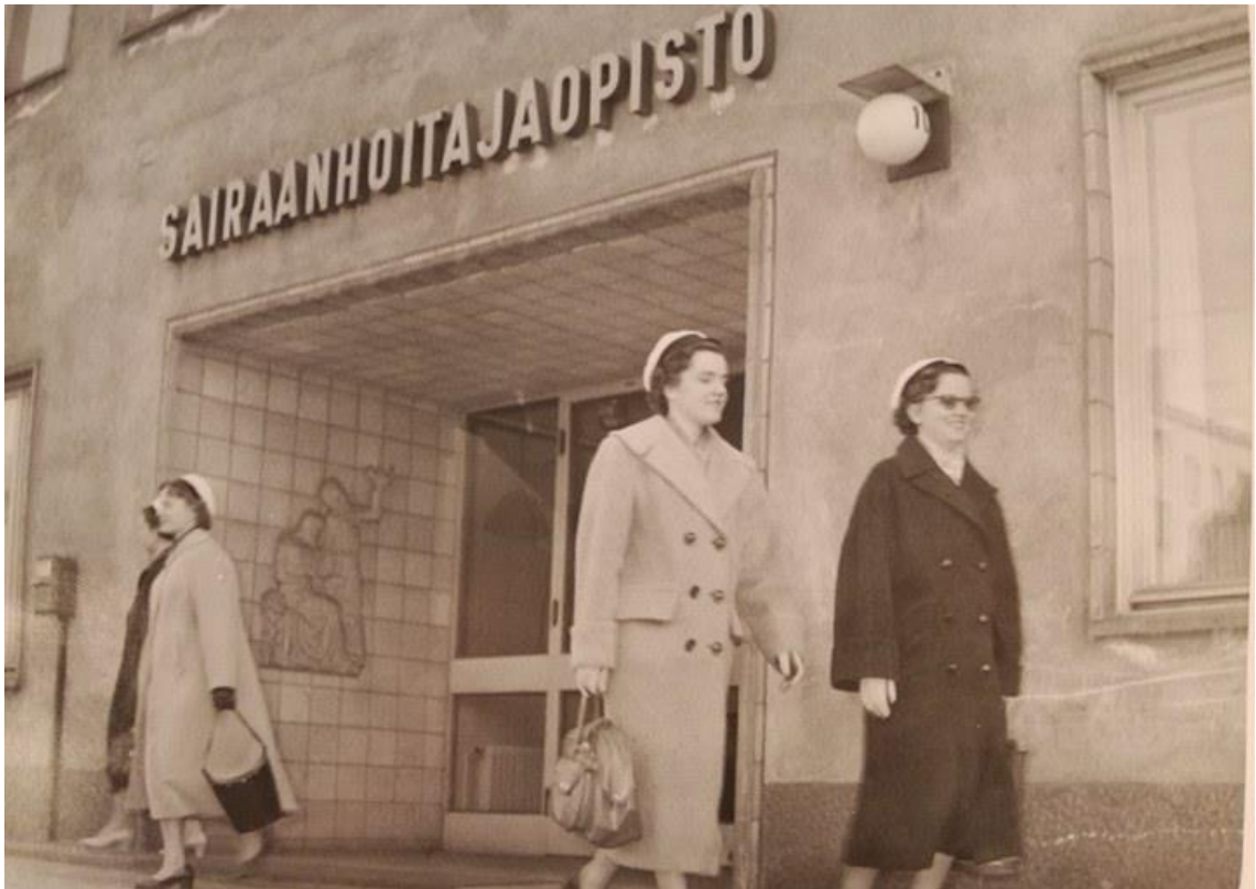
Kuvio 16. Helsingin sairaanhoitajaopisto vuotena 1964 (Hoitotyön koulutuksen museo. Rehtorin huone).

Oheinen kuva (kuvio 16) on otettu Helsingin sairaanhoito-opiston edestä vuonna 1964.