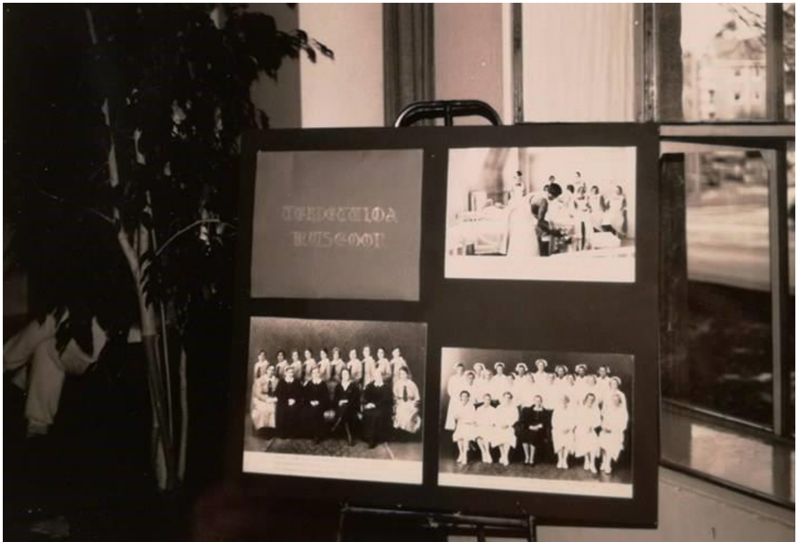
Kuvio 1. Hoitotyön koulutuksen museon näyttely 30.1.1989 (Hoitotyön koulutuksen museo. Rehtorin huone).

Oheinen kuva (kuvio 1) on Hoitotyön koulutuksen museon näyttelystä 30.1.1989.