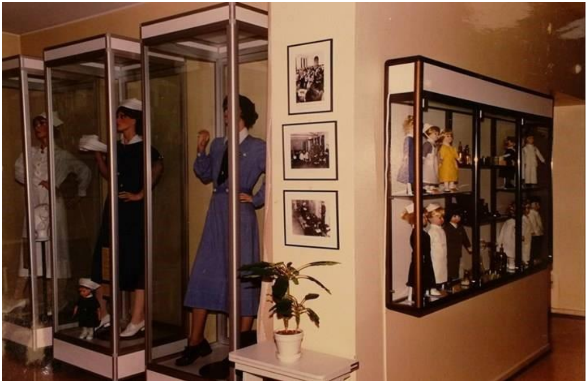
Kuvio 2. Hoitotyön koulutuksen museon kokoelma sairaanhoitajan asuista eri vuosikymmeniltä (Hoitotyön koulutuksen museo. Rehtorin huone).

Oheinen kuva (kuvio 2) on Hoitotyön koulutuksen museon käytävältä. Kuvassa on vitriini, jossa on sairaanhoitajan asuja eri vuosikymmeniltä.