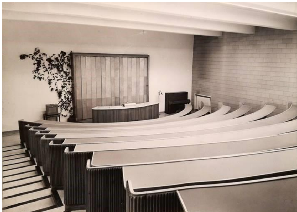
Kuvio 15. F-siiven auditorio 1950-luvulla (Hoitotyön koulutuksen museo. Rehtorin huone).

Oheinen kuva (kuvio 15) on F-siiven luentosalista 1950-luvulta.