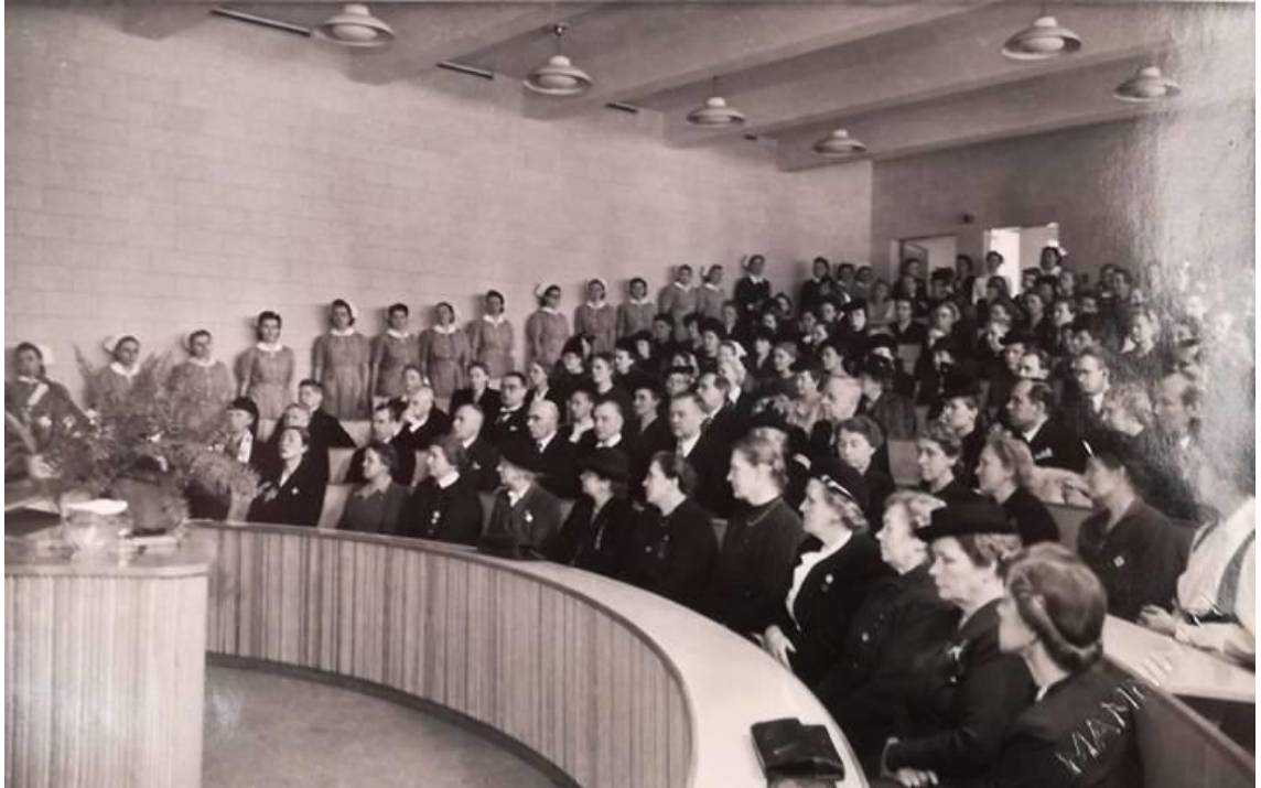
Kuvio 7. Helsingin sairaanhoito-opiston vihkiäiset vuonna 1948 (Hoitotyön koulutuksen museo. Rehtorin huone).

Oheinen kuva (kuvio 7) on Helsingin sairaanhoito-opiston vihkiäisistä vuodelta 1948, jossa vieraat istuvat F-auditoriossa.