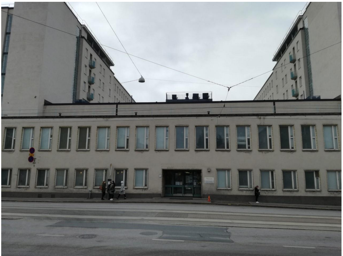
Kuvio 21. Tukholmankatu 10 rakennus edestä (Julia Liimatta 2017).

Oheinen kuva (kuvio 21) on otettu Tukholmankatu 10 rakennuksen edestä.