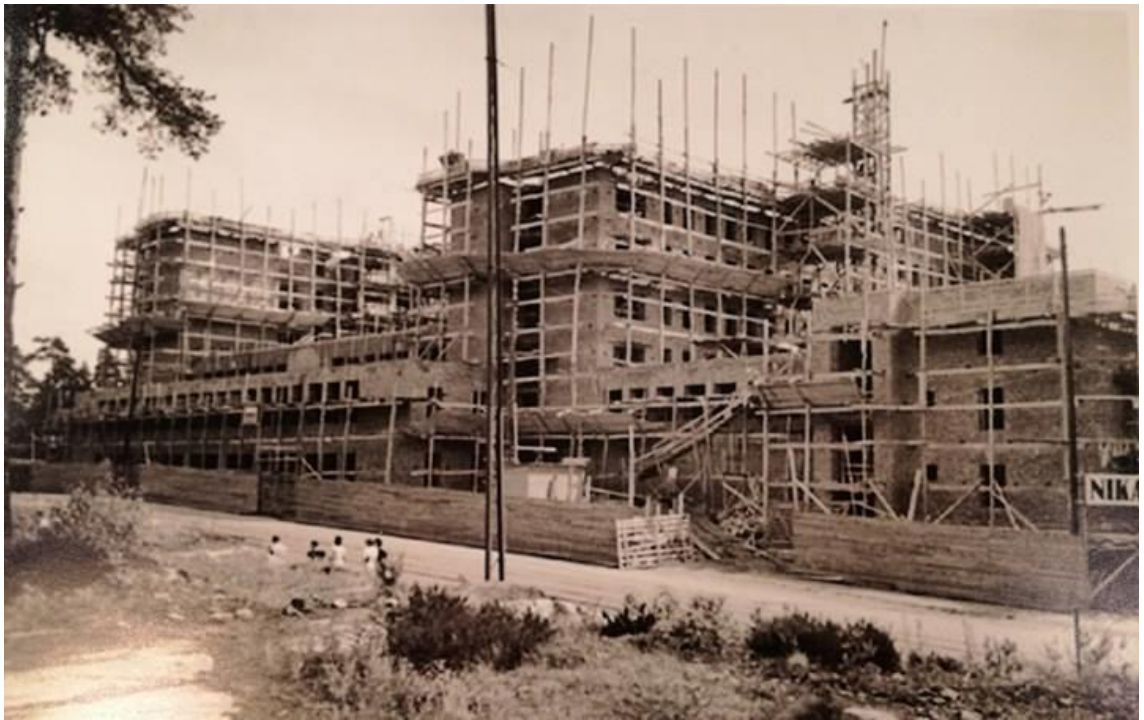
Kuvio 4. Tukholmankatu 10:n rakennusvaihe (Hoitotyön koulutuksen museo 2017).

Oheinen kuva (kuvio 4) on Tukholmankatu 10 rakennusvaiheesta.