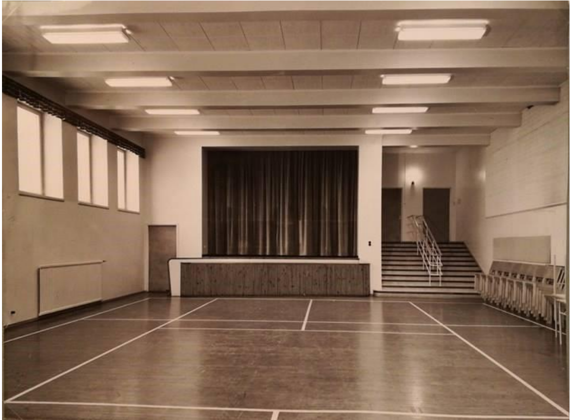
Kuvio 6. Rakennuksen jumppasali 1950-luvulla (Hoitotyön koulutuksen museo. Rehtorin huone).

Oheinen kuva (kuvio 6) on rakennuksen silloisesta jumppasalista 1950-luvulta. Nykyään se on käytössä D-auditoriona.