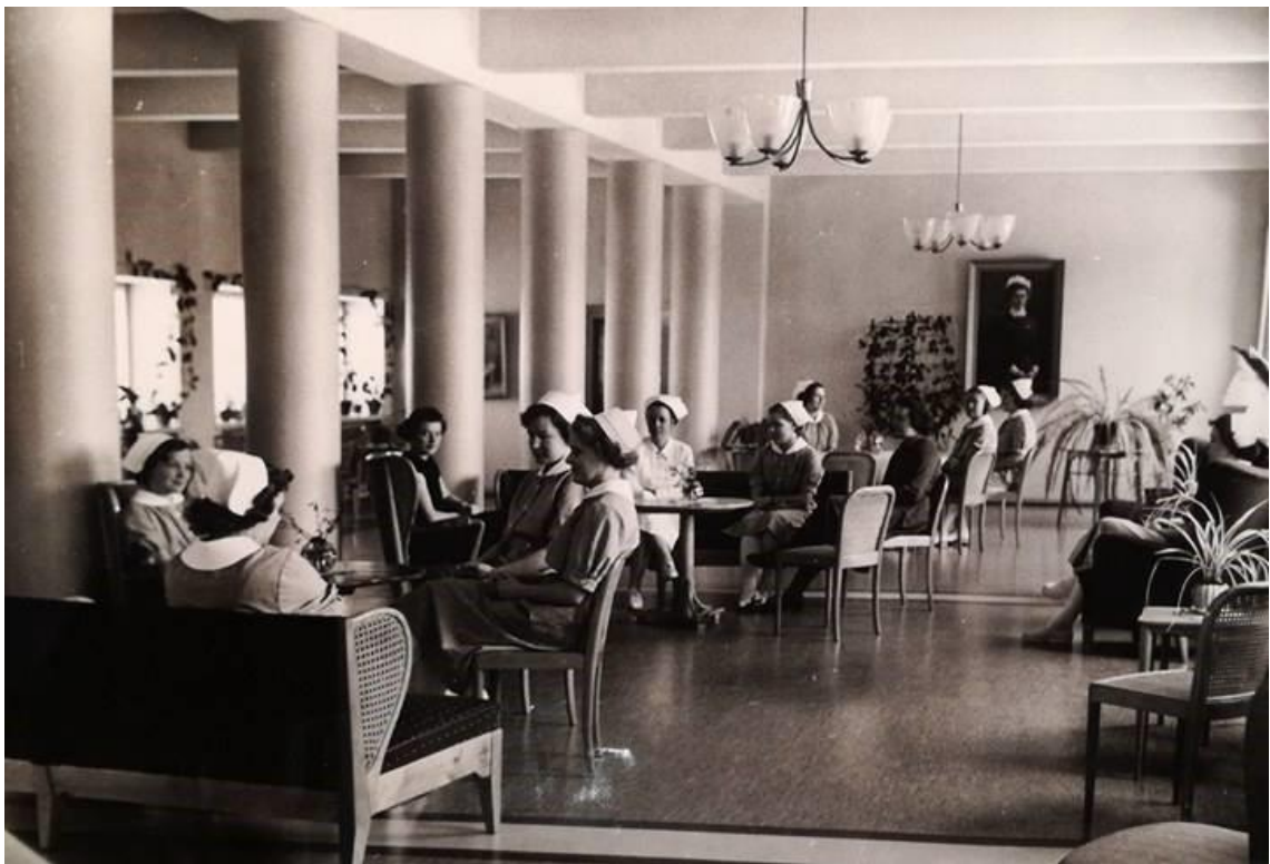
Kuvio 3. Mannerheim-salii 1950-luvulla (Hoitotyön koulutuksen museo. Rehtorin huone).

Oheinen kuva (kuvio 3) on Mannerheim-salista 1950-luvulta.