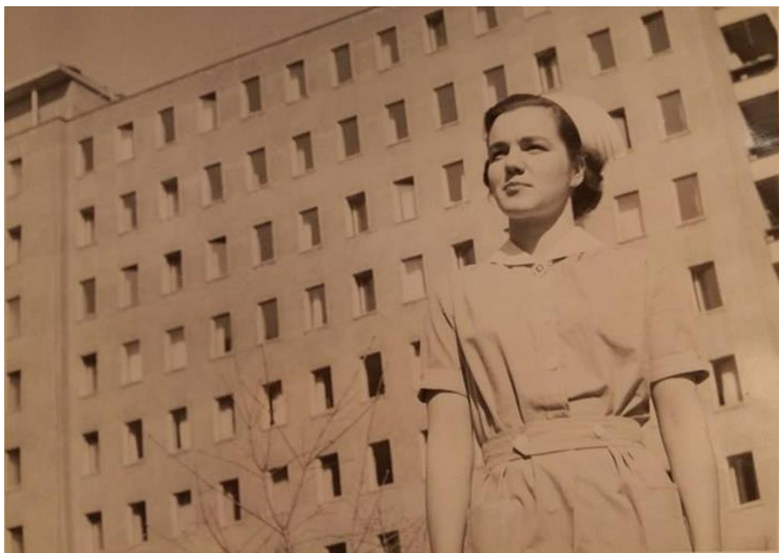
Kuvio 12. Sairaanhoitajaopiskelija Tukholmankatu 10 rakennuksen sisäpihalla (Hoitotyön koulutuksen museo. Rehtorin huone).

Oheinen kuva (kuvio 12) on sairaanhoitajaopiskelija Tukholmankatu 10 rakennuksen sisäpihalla. Kuva on otettu 1950-1960 -luvulla.