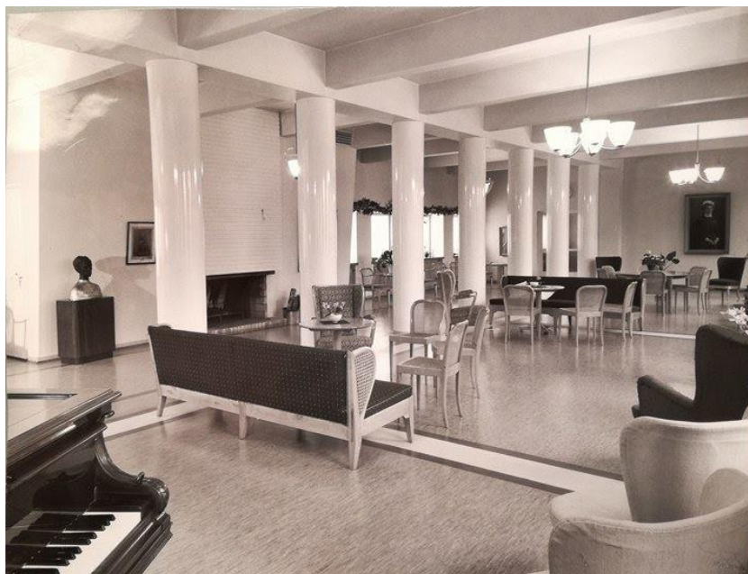
Kuvio 17. Sophie Mannerheim -sali 1960-luvun alussa (Hoitotyön koulutuksen museon. Rehtorin huone).

Oheisessa kuvassa (kuvio 17) on Sophie Mannerheim-sali 1960-luvun alussa.