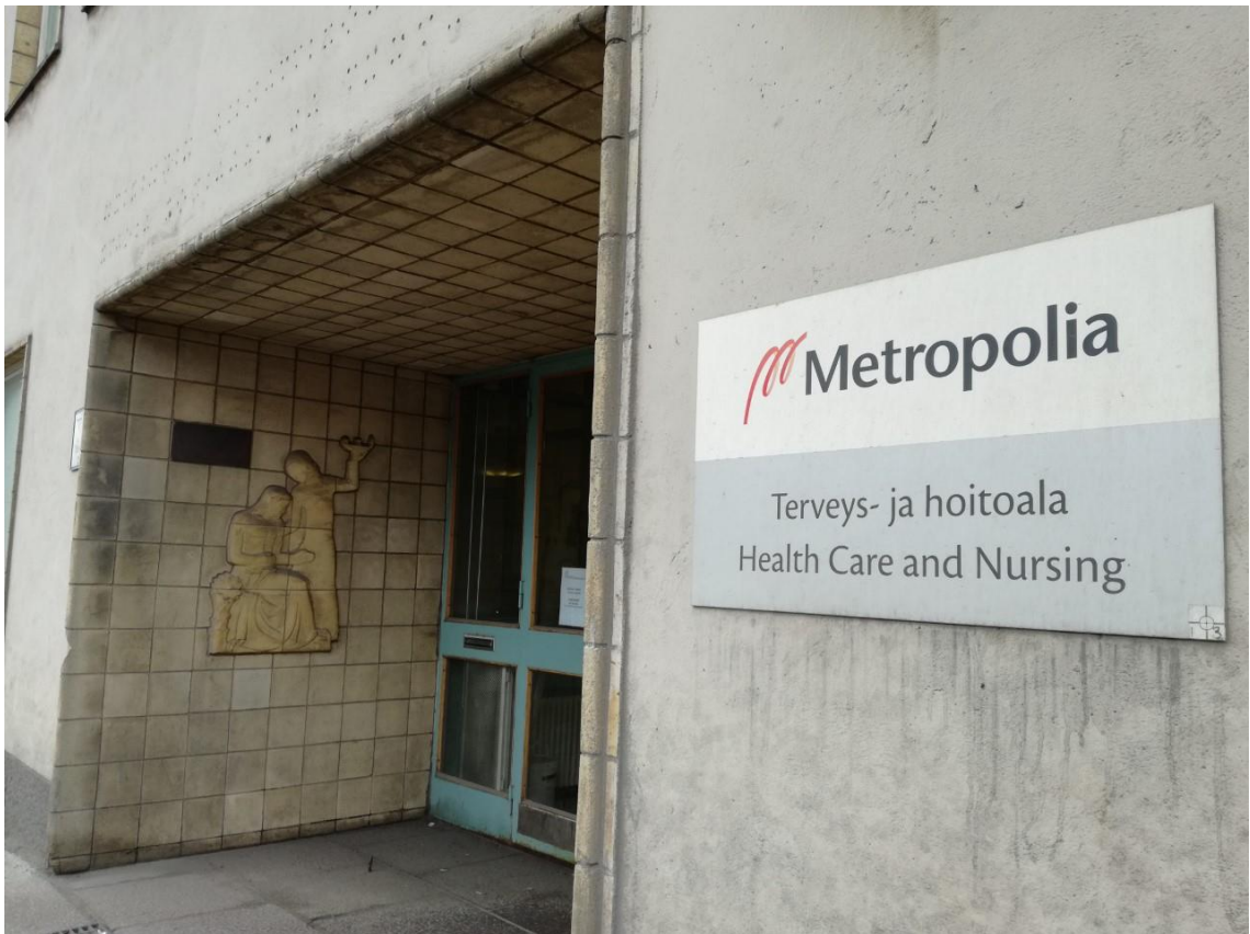
Kuvio 19. Rakennuksen pääovi nykypäivänä.

Oheisessa kuvassa (kuvio 19) on Tukholmankatu 10 rakennuksen pääovi nykypäivänä.