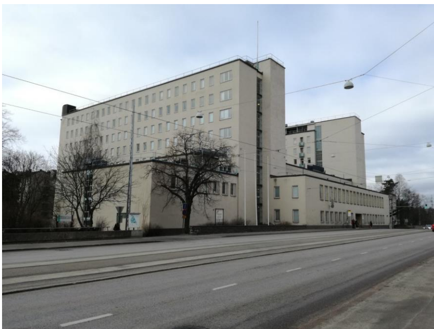
Kuvio 20. Tukholmankatu 10 rakennus ulkoa nykypäivänä.

Oheinen kuva (kuvio 20) on Tukholmankatu 10 rakennus ulkoa.