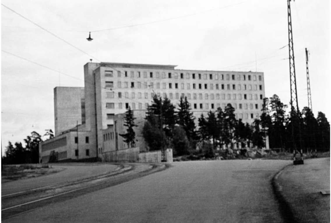
Kuvio 11. Helsingin Sairaanhoidajaopisto

Oheinen kuva (kuvio 11) on otettu Tukholmankadun ja Paciuksenkadun kulmasta.