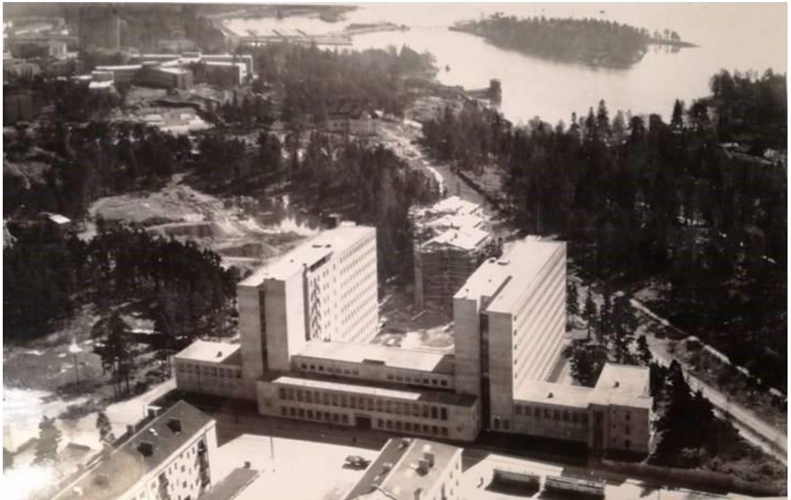
Kuvio 5. Tukholmankatu 10 rakennuksen ilmakuva 1940-1950 -luvulta (Hoitotyön koulutuksen museo. Rehtorin huone).

Oheinen kuva (kuvio 5) on Tukholmankatu 10 rakennuksesta otettu ilmakuva 1940-1950-luvulta.