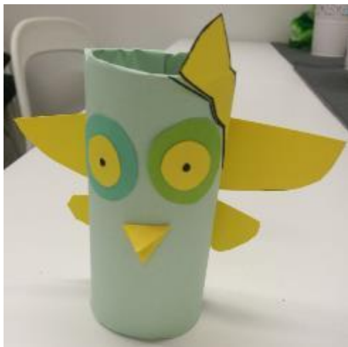
KUVA 1. Pöllö-askartelu

Särkiniemen asukastuvalla toteutettu kädentaito oli pöllö-askartelu. Löysimme askarteluun mallin lehdestä, jota muokkasimme soveltuvaksi ikätasosta riippumatta. Materiaaleina käytimme kierrätysmateriaaleja ja askartelutarvikkeita. Askartelu oli suunniteltu niin, että lapsi tarvitsi aikuista avustamaan leikkaamisessa. Kauppakeskus Apajan Kuopion Perheentalon tiloissa toteutettu kädentaitotehtävä oli isänpäiväkortti, koska isänpäivä oli tulossa. Isänpäiväkorttien tekemiseen tarvittiin vain kartonkia, maalarinteippiä ja vesivärejä. Materiaalit ja korttien ulkoasu oli suunniteltu siten, että jopa perheen pienimmätkin pystyvät sen toteuttamaan. Teimme korttipohjat valmiiksi, jolloin asiakkaiden ei tarvinnut kuin kirjoittaa maalarinteipillä korttiin haluamansa kutsumanimi isälle tai isoisälle. Korttien tekeminen sujui jouhevasti. Osa asiakkaista teki kortin nopeasti ja osa keskittyi tekemiseen pidempään. Jokainen pääsi vuorollaan tekemään oman korttinsa. Korttien lukumäärää ei ollut rajattu, joten kortteja sai tehdä enemmän kuin yhden, mikäli lapsella riitti intoa.