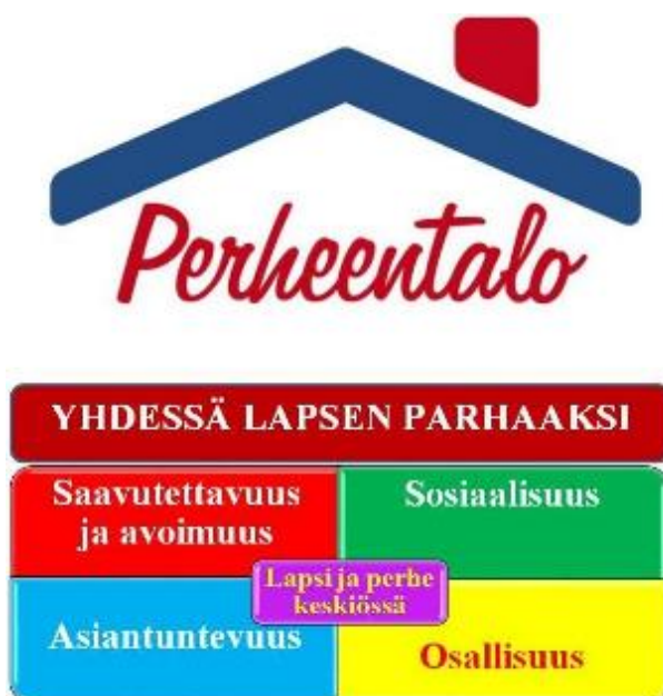
KUVIO 1. Iisalmen Perheentalon toimintamalli (Perheentalo s.a.)

Tällä hetkellä Suomesta löytyy kolme Perheentaloa. Perheentalot järjestävät matalan kynnyksen palveluita. Ensimmäinen Perheentalo perustettiin 2004 Iisalmeen. Nykyään Perheentaloja löytyy myös Joensuusta ja Kuopiosta. Kaikki Perheentalot tarjoavat Sosiaali- ja terveysjärjestöjen avustuskeskuksen (STEA) rahoittamia kolmannen sektorin lapsiperhepalveluita. Perheentalot antavat lapsiperheille varhaista tukea ja mahdollisuuden osallistua matalan kynnyksen toimintaan. Toiminnallaan he tukevat perheiden osallisuutta ja hyvinvointia. Alla olevassa kuviossa 1 on havainnollistettu Perheentalojen toimintamalli. (Perheentalo s.a.)