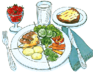
Kuva 4. Lautasmalli (Suomalaiset ravitsemussuositukset)

taa nauttia yhdestä kahteen palaa täysjyväleipää. Lisäksi on hyvä sisäistää seuraavat terveellisen ruokavalion kriteerit: valitaan aina vähärasvaisia vaihtoehtoja, korvataan kovat rasvat pehmeillä, syödään kalaa vähintään kahdesti viikossa, vältetään liiallista suolan käyttöä sekä pidetään alkoholin käyttö kohtuullisena. (Aapro ym. 2008, 23; Niemi 2006, 132–134.)