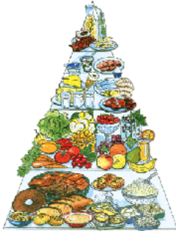
Kuva 3. Ruokakolmio (Suomalaiset ravitsemussuositukset)

Ihminen tarvitsee energiaa perusaineenvaihduntaan, ruoan aiheuttamaan lämmöntuottoon ja fyysisen työn tekemiseen. Perusaineenvaihdunnalla (PAV) tarkoitetaan välttämättömien elintoimintojen aiheuttamaa energiankulutusta. Ihmisen perusaineenvaihdunta on yleensä päivästä toiseen melko vakio. Aikuisikäisten energian ja ravintoaineiden tarve vaihtelee huomattavasti. Siihen vaikuttavat mm. ikä, sukupuoli, fyysinen aktiivisuus, terveydentila ja yksilöllisyys. Energian liikasaanti ja siitä johtuva lihavuus ovat yleisiä työikäisten suomalaisten keskuudessa. Lihavuus aiheuttaa mm. seuraavia terveysriskejä: sydän- ja verisuonitaudit, aineenvaihduntasairaudet (diabetes), keuhkosairaudet, tuki- ja liikuntaelinsairaudet ja syöpätaudit. (Aapro ym. 2008, 27; Haglund ym. 2007, 11; Peltosaari ym. 2002, 255–258.)