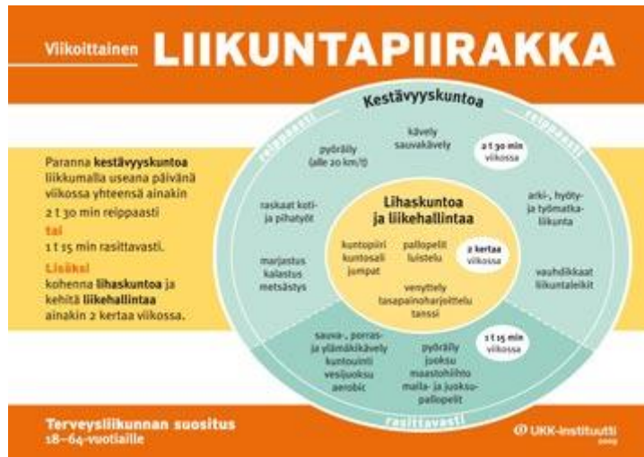
Kuva 2 Terveysliikunnan toteuttaminen (UKK-Instituutti)

veysriskit vältetään. Tähän voi päästä joko 3–4 tunnin perusliikunnalla viikossa tai 2–3 tunnin viikoittaisella täsmäliikunnalla. Viikon tavoite tulisi kerätä vähintään 10 minuutin liikuntakertojen avulla. Perusliikuntaa tulisi olla joka päivä tai vaihtoehtoisesti täsmäliikuntaa vähintään joka toinen päivä. (kuva 2.) (Fogelholm ym. 2005, 78–79; UKK-Instituutti.)