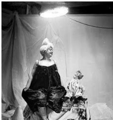
Kuva 1 Josephine Mathews Evetta klovnina noin vuonna 1895. ©Emil Constant Puyo 1895

"I believe that a woman can do anything for living that man can do, and I do it just as well as man." - Josephine Mathews (Kralj 2011, 211 - 216.)