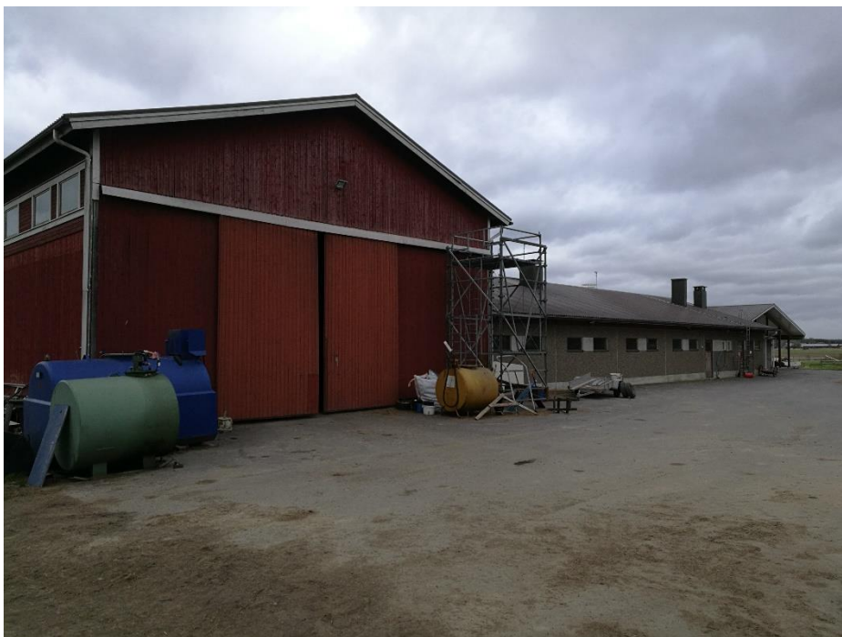
Kuva 4. Tilan vanha navetta, jonka yhteydessä on rehulato. (Mäkelä, 2017)

kikäteen kyseiseen rakennukseen on tehty myös tilaa vasikoiden yksilökarsinoita varten.