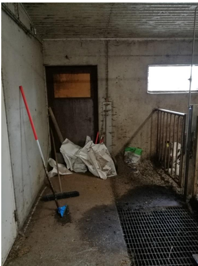
Kuva 6. Poistumisteiden ovien edessä ei tulisi säilyttää ylimääräistä tavaraa. (Mäkelä, 2017)

laitumelle, jolloin tuotantorakennukseen saataisiin lisää tilaa ja mahdollisen hätätilanteen varalta osa eläimistä olisi jo valmiiksi poistettuna navetan sisältä. Eläinten pelastustilannetta varten kannattaisi suunnitella myös jokin toinen kokooma-alue tuotantorakennuksen läheisyyteen, jonne eläimet kyettäisiin helposti siirtämään laumana. Eläinten siirtämiseen kokooma-alueelle voisi hyödyntää siirrettäviä täräsaitoja, joiden avulla eläimet pystyttäisiin siirtämään turvallisesti haluttuun paikkaan.