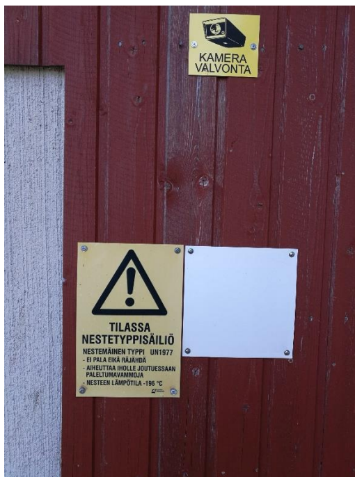
Kuva 1. Nestemäisen typen säilytyspaikka on merkitty rakennuksen ulkoseinään. (Mäkelä, 2017)