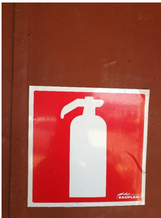
Kuva 2. Käsiammuttimien sijainnit ovat merkitty rakennusten oviin. (Mäkelä, 2017)