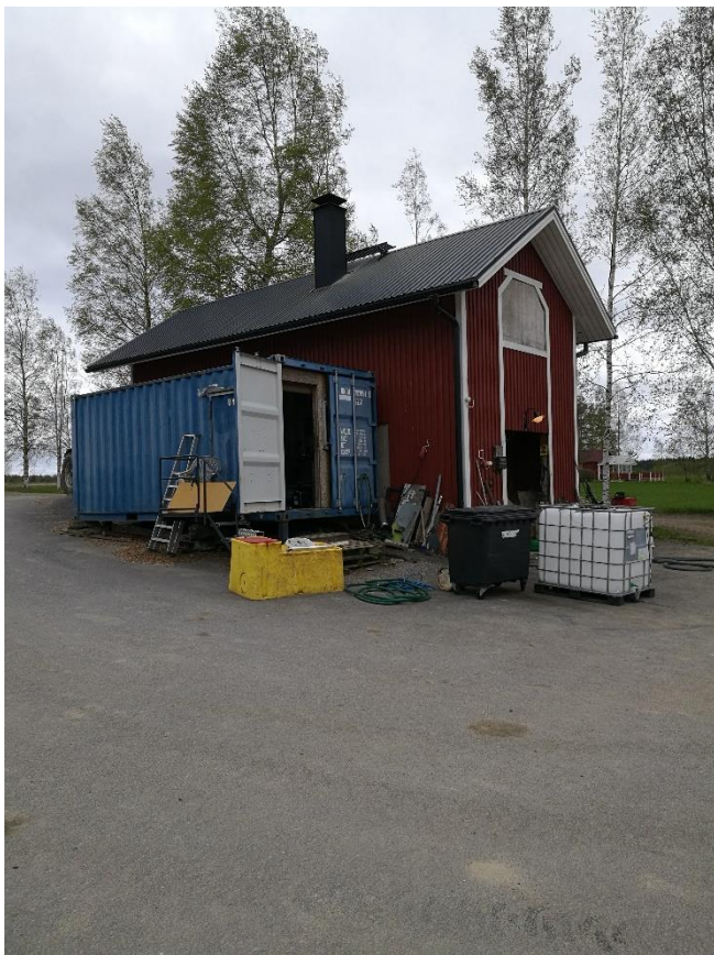
Kuva 5. Tilan lämpökeskus. (Mäkelä, 2017)