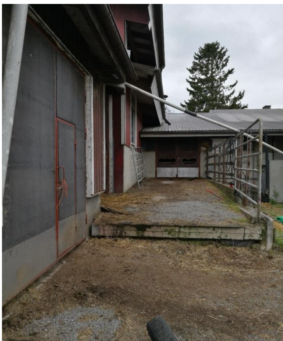
Kuva 7. Vanhan tuotantorakennuksen sekä pihaton poistumistiet. (Mäkelä, 2017)