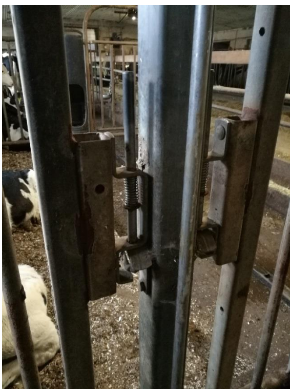
Kuva 8. Porttien sekä aitojen lukitukset tulisivat olla mahdollisimman yhdenmukaiset, jolloin kaikki kykenisivät avaamaan ne hädän sattuessa. (Mäkelä, 2017)