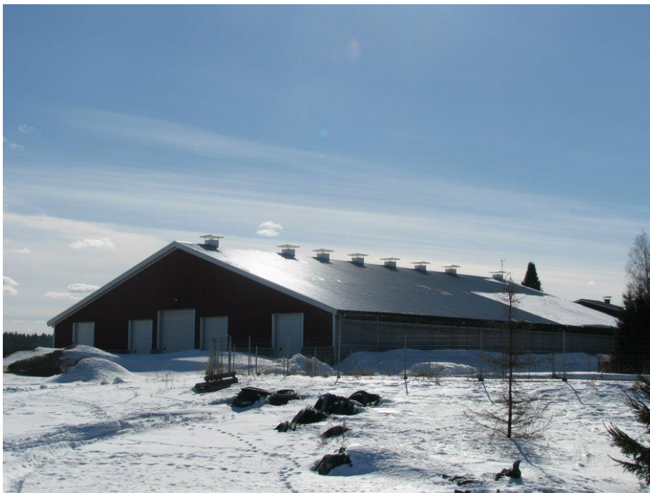
Kuva 3. Tilan verhoseinäpihatto. (Yli-Hynnälän tila, 2013)