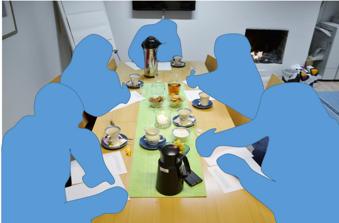
Kuvio 3 Aineistonkeruutilaisuus, kirjallinen ryhmäistunto MLL:n Kainuun piiri ry:n toimistolla.