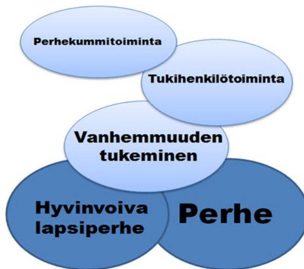
Kuvio 1 Perhekummitoiminta tukee perhettä ja lapsiperheiden hyvinvointia.

Keskeisiä laajempia käsitteitä tässä opinnäytetyössä ovat perhe, hyvinvoiva lapsiperhe, vanhemmuuden tukeminen, vapaaehtoinen tukihenkilötoiminta, sekä perhekummitoiminta.