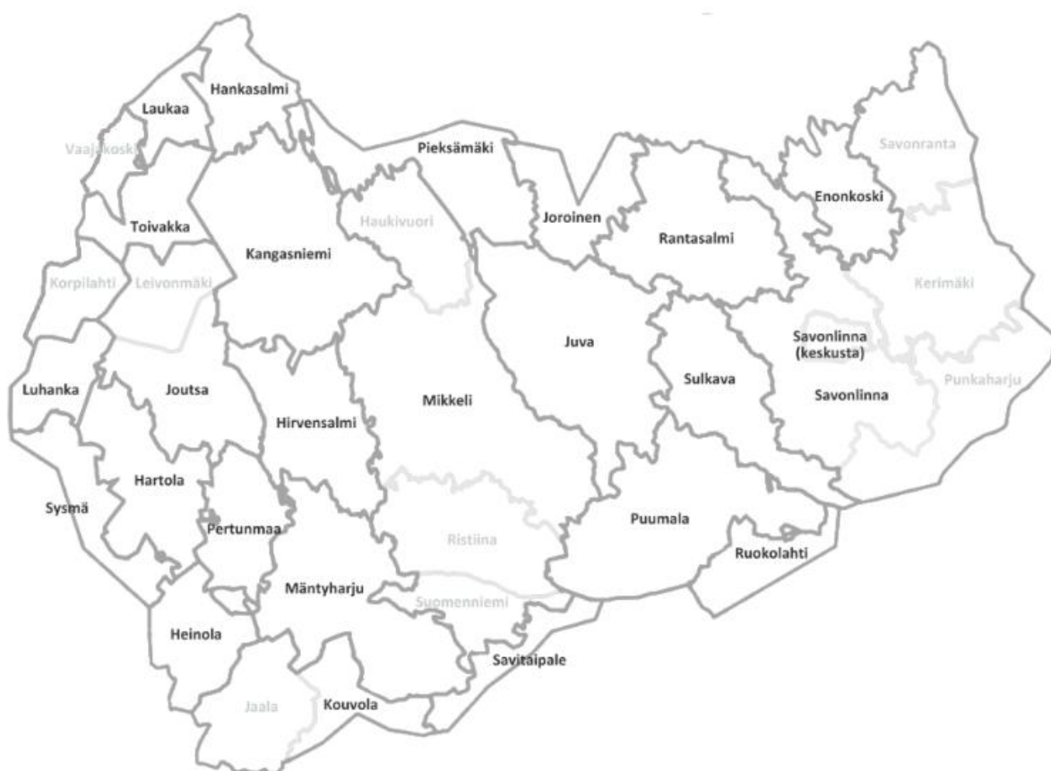
KUVA 1. Järvi-Suomen Energian jakelualue (Suur-Savon Sähkö, 2017).

Järvi-Suomen Energia (JSE) huolehtii sähköenergian jakelusta Suur-Savon Sähkö -konsernin (SSS) alueella yli 100 000 taloudelle. JSE vastaa noin 28 000 kilometrin pituisen sähköverkoston suunnittelusta, rakennuttamisesta, käytöstä ja kunnossapidosta. Yhtiö sopii omalla toimialueellaan sähköliittymien kaupat kuluttajien kanssa. Järvi-Suomen Energialla työskentelee yli 20 henkilöä ja vuoden 2016 liikevaihto oli noin 89 miljoonaa euroa. Investoinnit samana vuonna olivat 36 miljoonaa euroa. (Järvi-Suomen Energia, 2017)