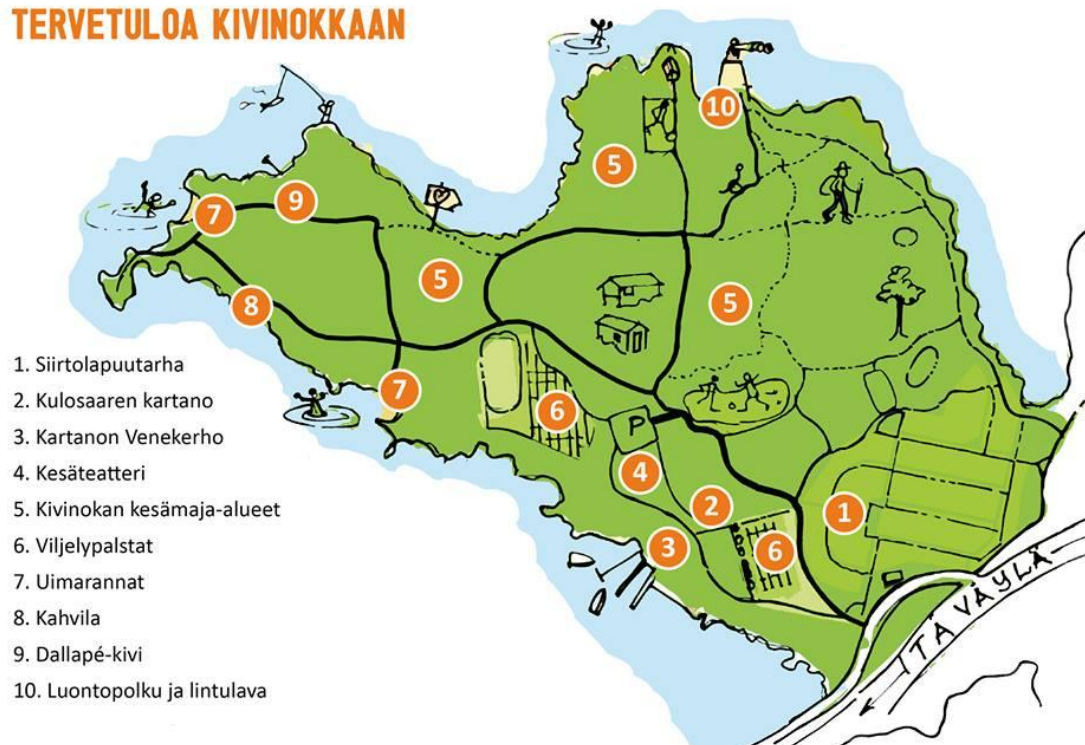
Kuvio 1: Kivinkkan kartta (Visit Kivinkka)