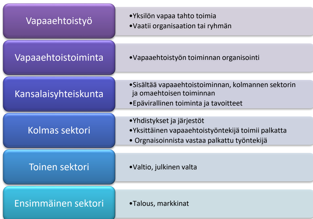
Kuvio 6: Vapaaehtoistyön käsitteitä (Eskola & Kurki 2001, 16-17)