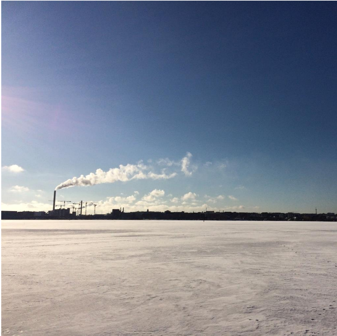
Kuvio 4: Talvinen Kivinokan ympäristö