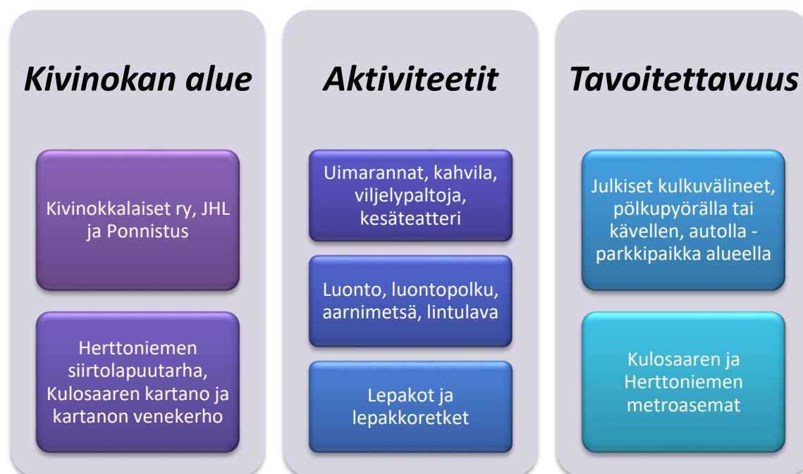
Kuvio 3: Kivinokka ulkoilu- ja virkistätymisalueena

Kivinokkaan pääsee helposti julkisilla kulkuvälineillä, polkupyörällä, kävellen, autolla, sekä soutu- tai pienellä perämoottoriveneellä. Herttoniemen ja Kulosaaren metroasemilta on Kivinokkaan noin 10-15 minuutin kävelymatka. Kivinokkaan pääsee myös autolla helposti ja Kivinokassa on varattu parkkipaikka autoilijoille. Useat saapuvat Kivinokkaan polkupyörällä, sillä pyörällä ja kävellen pääsee liikkumaan alueella vapaammin kuin esimerkiksi autolla. (Kivinokkalaiset ry.)