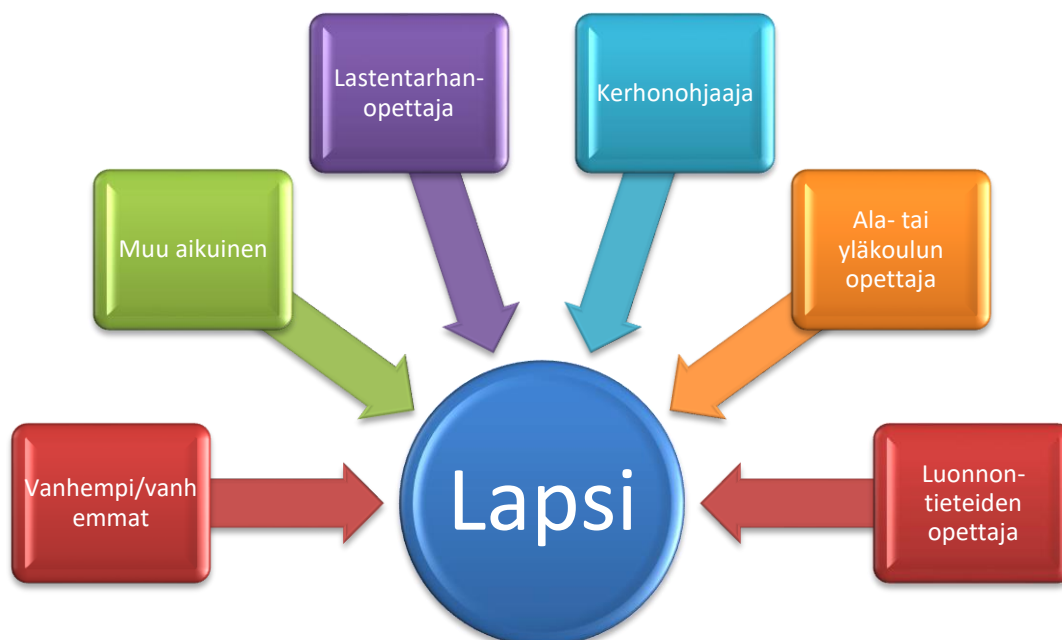
Kuvio 5: Sidosryhmät

Tärkeä kiinnittymiskohde sidosryhmien (Kuvio 5) aktivoimisessa on nykyään itse toiminta, eikä niinkään enää jokin mahdollinen yhdistys, johon vapaaehtoisen toimijan panos kohdentuu rajatusti. Toiminnalle keskeistä on eritoten lähipiirin, kuten lasten harrastukset, ja halu tukea harrastuksia sekä edistää lasten liikumista ja oppimista. Erilaiset hankkeet ovat usein projektimaisia ja rajattuja, joissa konkreettisesti on alku ja loppu. (Helminen & Samstén 2004, 39.)