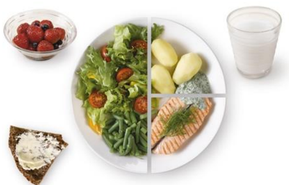
KUVA 1. Lautasmalli

Tyypin 2 diabetesta sairastavan ruokavaliosuositukset eivät käytännössä poikkea yleisistä terveyttä edistävästä ruokasuosituksista. Koska tyypin 2 diabetesta sairastavalla on suurentunut riski sairastua huonoihin elintapoihin liittyviin sairauksiin, tulisi ruokavaliota noudattaa erityisellä tarkkuudella. (THL 2014a.) Lisäksi monella tyypin 2 diabetesta sairastavalla on jo piirteitä metabolisesta oireyhtymästä, jonka hoitona toimii myös terveellinen ruokavalio (Suomen Diabetesliitto a). Ruokavalion tulisi sisältää vain vähän kovia rasvoja, kohtuullisesti pehmeitä rasvoja, vähän suolaa, runsaasti ravintokuituja sekä kasviksia, hedelmiä ja marjoja joka aterialla, vähintään kuitenkin puoli kiloa päivässä. Lautasmallin (KUVA 1) avulla on helppo valita terveellinen ja tasapainoinen ateriakokonaisuus. (THL 2014a.) Ateriainsuliinihoitoista diabetesta sairastavan tulee laskea aterian sisältämät hiilihydraattimäärät, joiden mukaan oikea insuliinimäärä annostellaan (Suomen Diabetesliitto c).