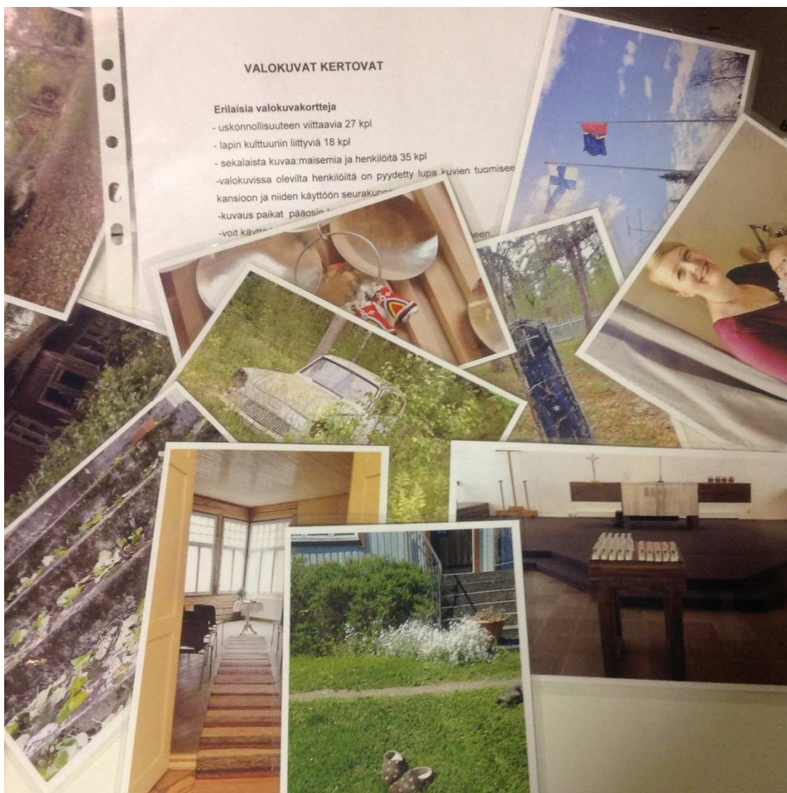
KUVA 5. Valokuvat kertovat

Virikekansio jatkuu erilaisin valokuvin, joista osa on hengellisiä. Kuvat voivat olla tunnelman kertojina tai tarinan muodostajina. Kuvissa on huomioitu alueen kulttuuri, mutta esille on nostettu myös aiheita omasta asuinympäristöstä