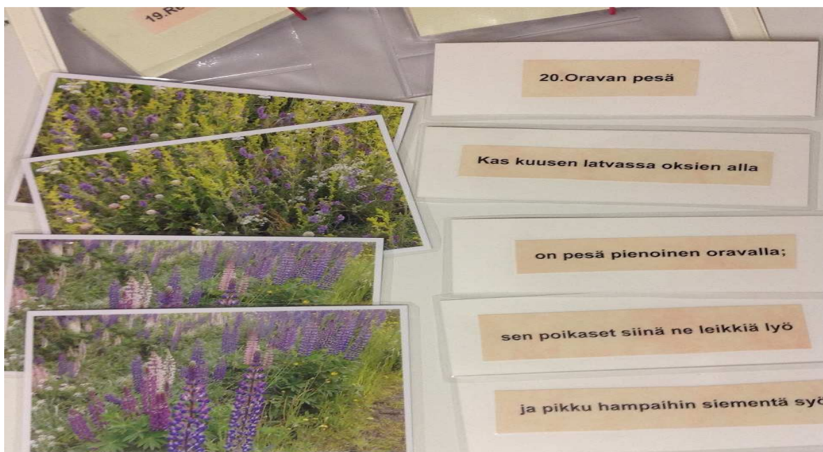
KUVA 1. Tutustumisvälineet: valokuvat ja laulunsanat

Ensimmäinen kansio jatkuu vuodenaika-kysymyskorttein, joita voi käyttää keskustelun virittämisessä ja muistelemisessa. Muistitoimintoja tukee runsas keskustelu ja muistelu. Muistelu piristää mielialaa sekä aktivoi keskusteluun ja on mahdollisesti myös hauska yhdessäolon muoto.