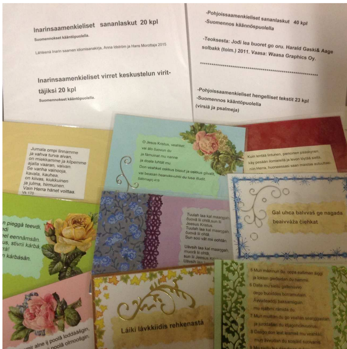
KUVA 7. Saamen kieliset sananlasku- ja hengelliset keskustelukortit