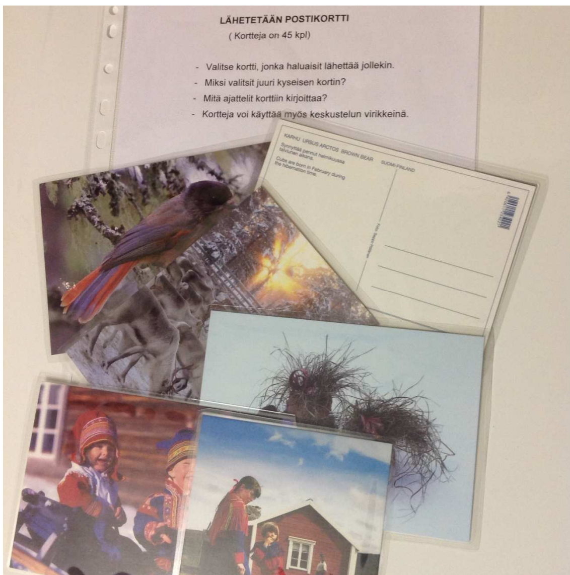
KUVA 4. Kenellä lähetän postikortin ja mitä siihen kirjoitan?

Toinen produktio osa eli kansio kaksi sisältää lähinnä kuvakortteja sekä saamenkielisen osan. Kuvat toimivat apuvälineenä keskusteluihin ja muisteluun. Virikekansion toinen osa alkaa postikorteilla. Inarin lähikaupan poistokorista löytyneet vanhat postikortit antoivat inspiraation tehtävään, jossa pitää valita postikortti, jonka haluaa lähettää jollekin. Keskustelu syntyy siitä, kenelle kortin haluaa lähettää ja mitä siihen haluaa kirjoittaa.