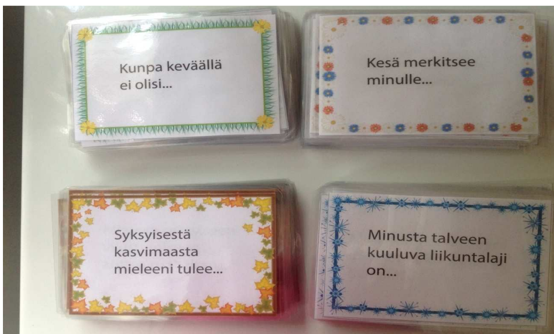
KUVA 2. Kirsi Alastalon suunnittelemat Vuodenaika kysymyskortit Vahvikkeen materiaalipankista (Vahvike i.a.)

Ensimmäinen kansio jatkuu vuodenaika-kysymyskorttein, joita voi käyttää keskustelun virittämisessä ja muistelemisessa. Muistitoimintoja tukee runsas keskustelu ja muistelu. Muistelu piristää mielialaa sekä aktivoi keskusteluun ja on mahdollisesti myös hauska yhdessäolon muoto.