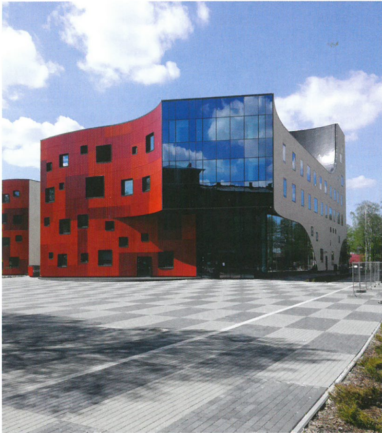
Riikan yliopistosairaalan laboratorion uudet tilat.

toja (12 ECTS). Lisäksi opiskelijoilla on mahdollista valita vapaavalintaisia opintoja 3 ECTS:n verran.