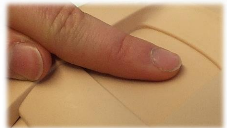
KUVA 1 PALPOINTI