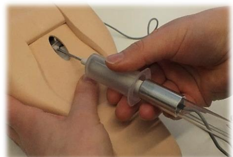
KUVA 3 PISTÄMINEN