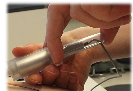
KUVA 4 NÄYTEPUTKEN ASETTAMINEN HOLKKIIN